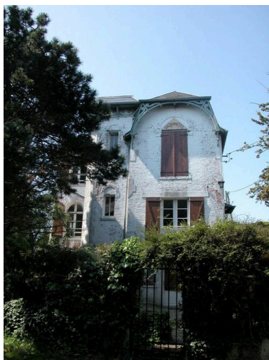
Elévation antérieure. IVR22_20048001639NUCA