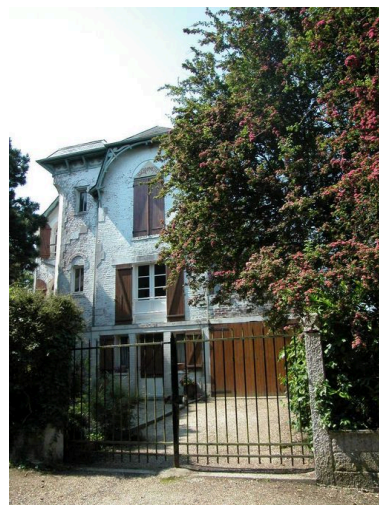
Vue d'ensemble depuis la rue en 2004, façade avec badigeon. IVR22_20048001638NUCA