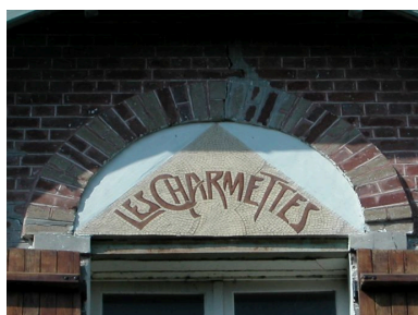
Détail du panneau de mosaïque portant appellation. IVR22_20058003037NUCA