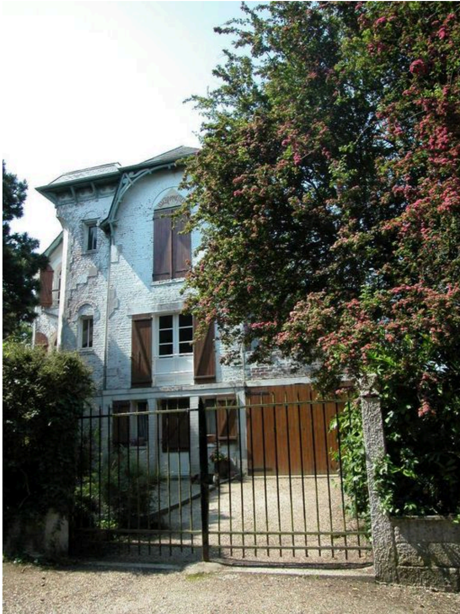
Vue d'ensemble depuis la rue en 2004, façade avec badigeon.