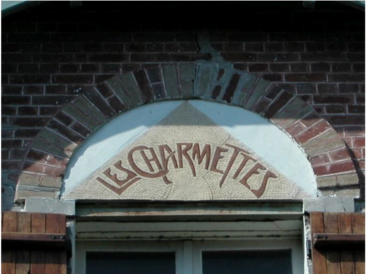
Détail du panneau de mosaïque portant appellation.