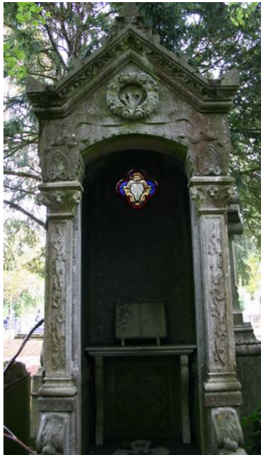
Détail de la façade antérieure du tombeau-chapelle.