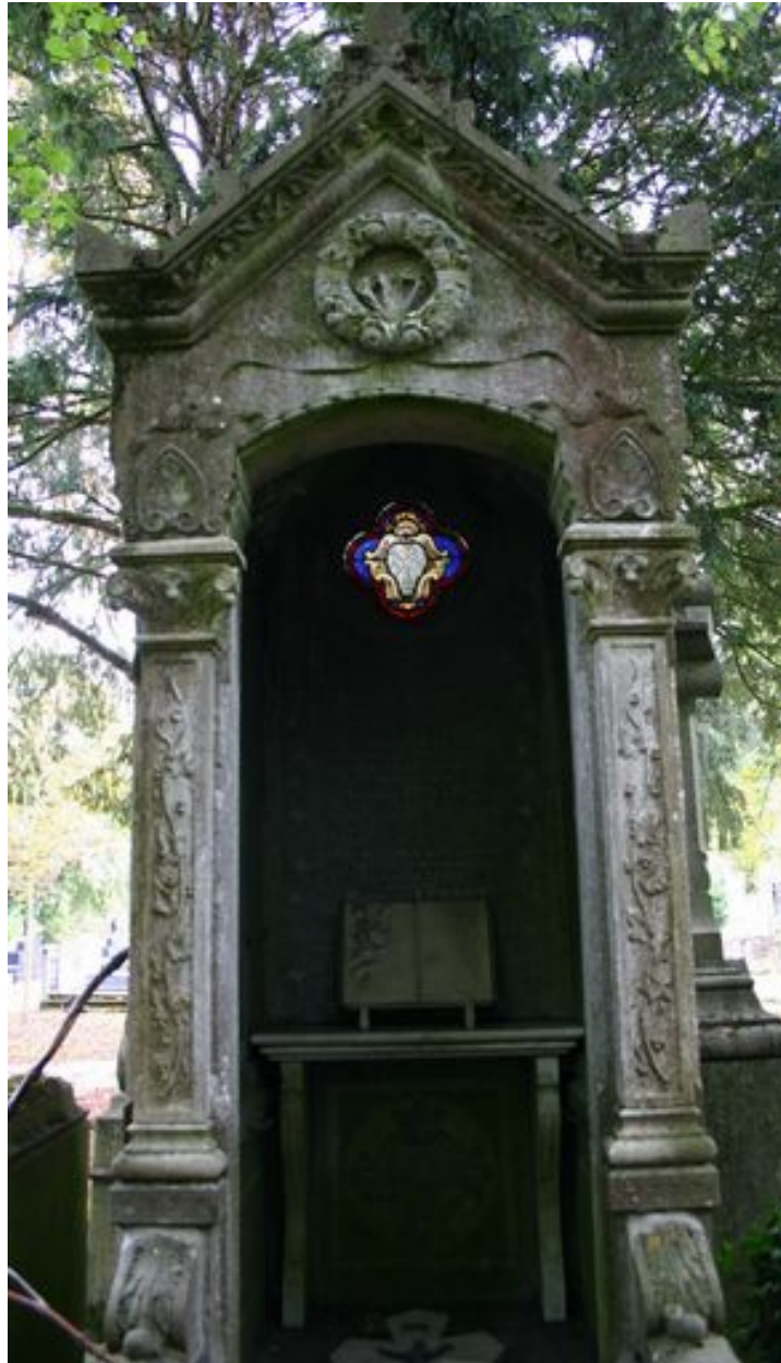
Détail de la façade antérieure du tombeau-chapelle.