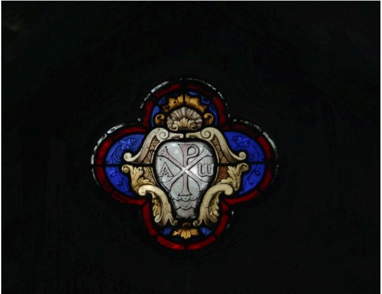
Détail du vitrail quadrilobé.