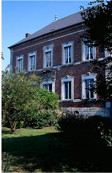
Vue générale. IVR22_19980203557ZA