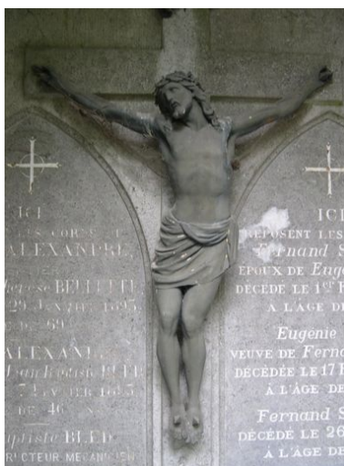
Christ en croix.