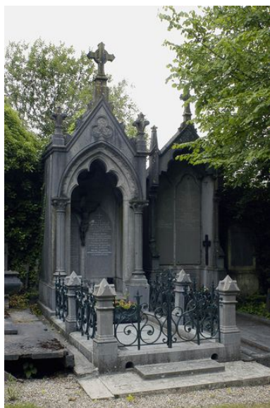
Vue générale. IVR22_20058001332NUCA