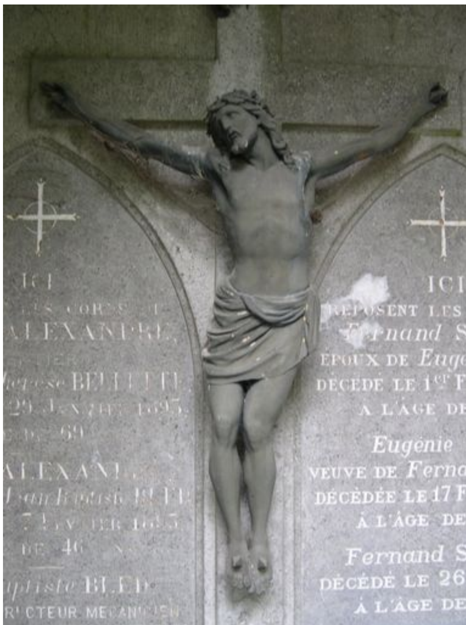
Christ en croix.