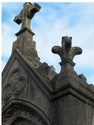
Vue des rampants. IVR22_20048001262NUCA