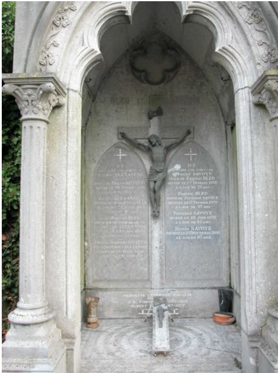
Détail du tombeau-niche.