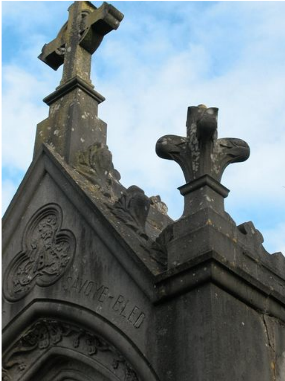
Vue des rampants.