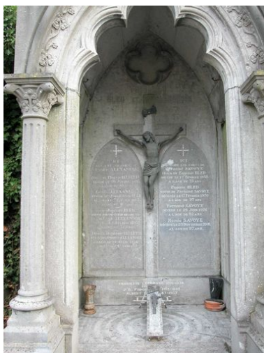
Détail du tombeau-niche. IVR22_20048001261NUCA