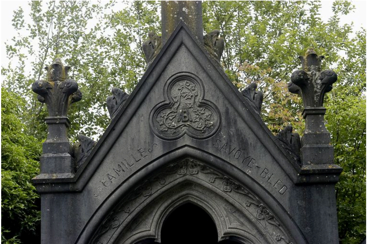
Détail du fronton avec le monogramme.