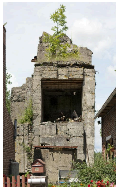
Vue vers le nord, depuis la rue Basse IVR31_20145904192NUCA