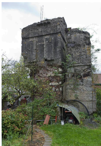
Elévation nord IVR31_20145904202NUCA