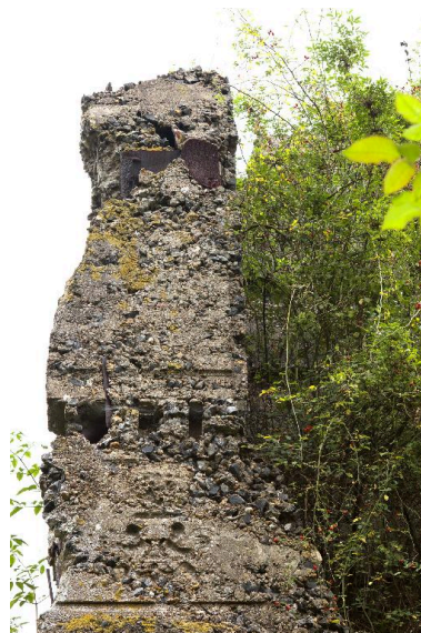
Détail du contrefort est où apparaissent des fragments de blindage (en haut) ainsi que les empreintes des bois de coffrage moulurés utilisés : une porte (à droite), des angelots (en bas)