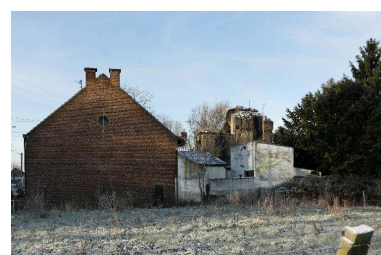
vue générale vers vers le sud IVR31_20145904196NUCA