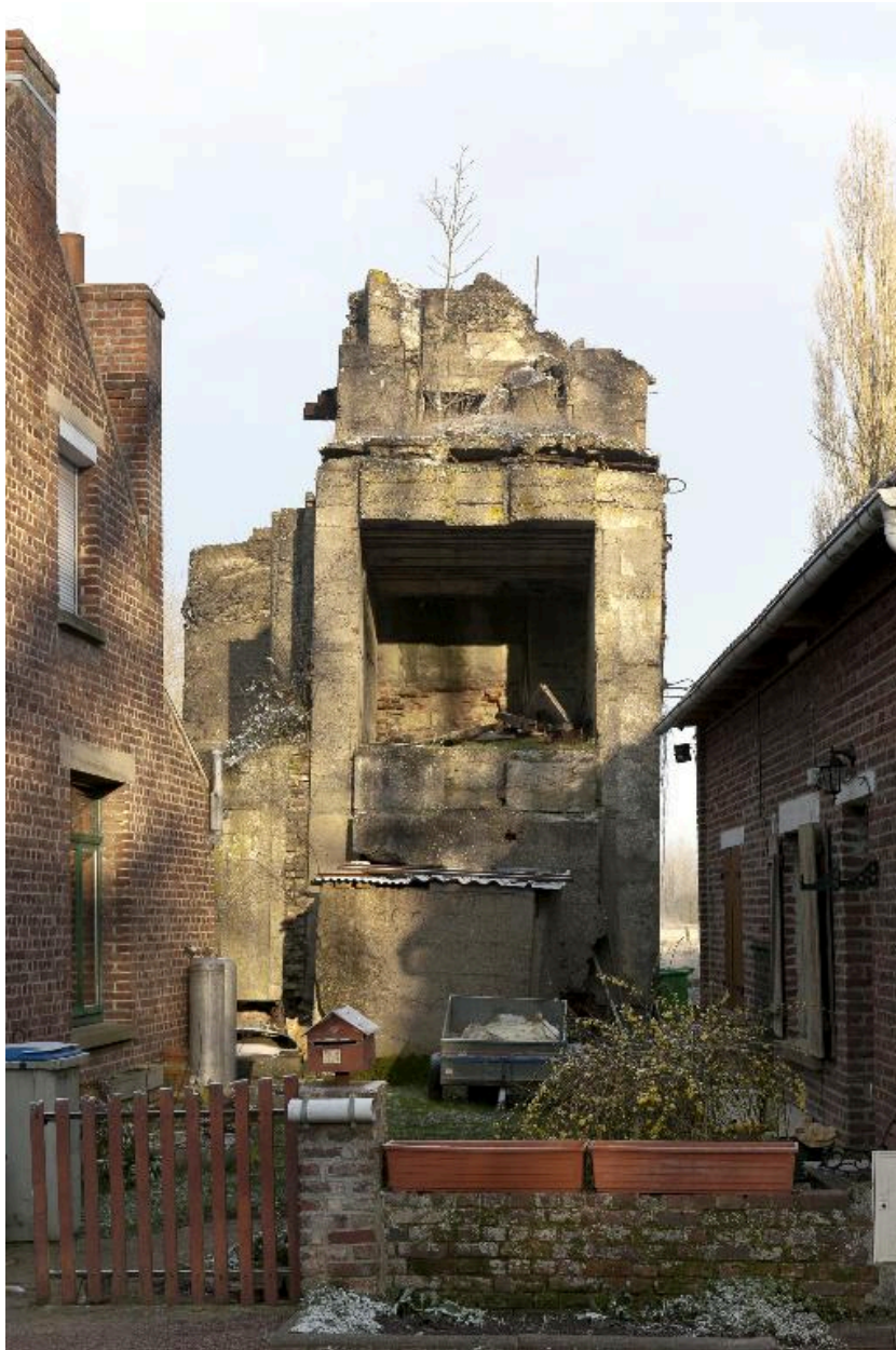
Vue vers le nord, depuis la rue Basse