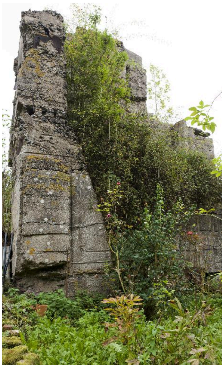
Vue vers l'est