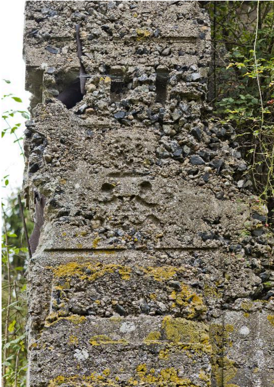
Détail du contrefort est : Angelots d'un bois de coffrage