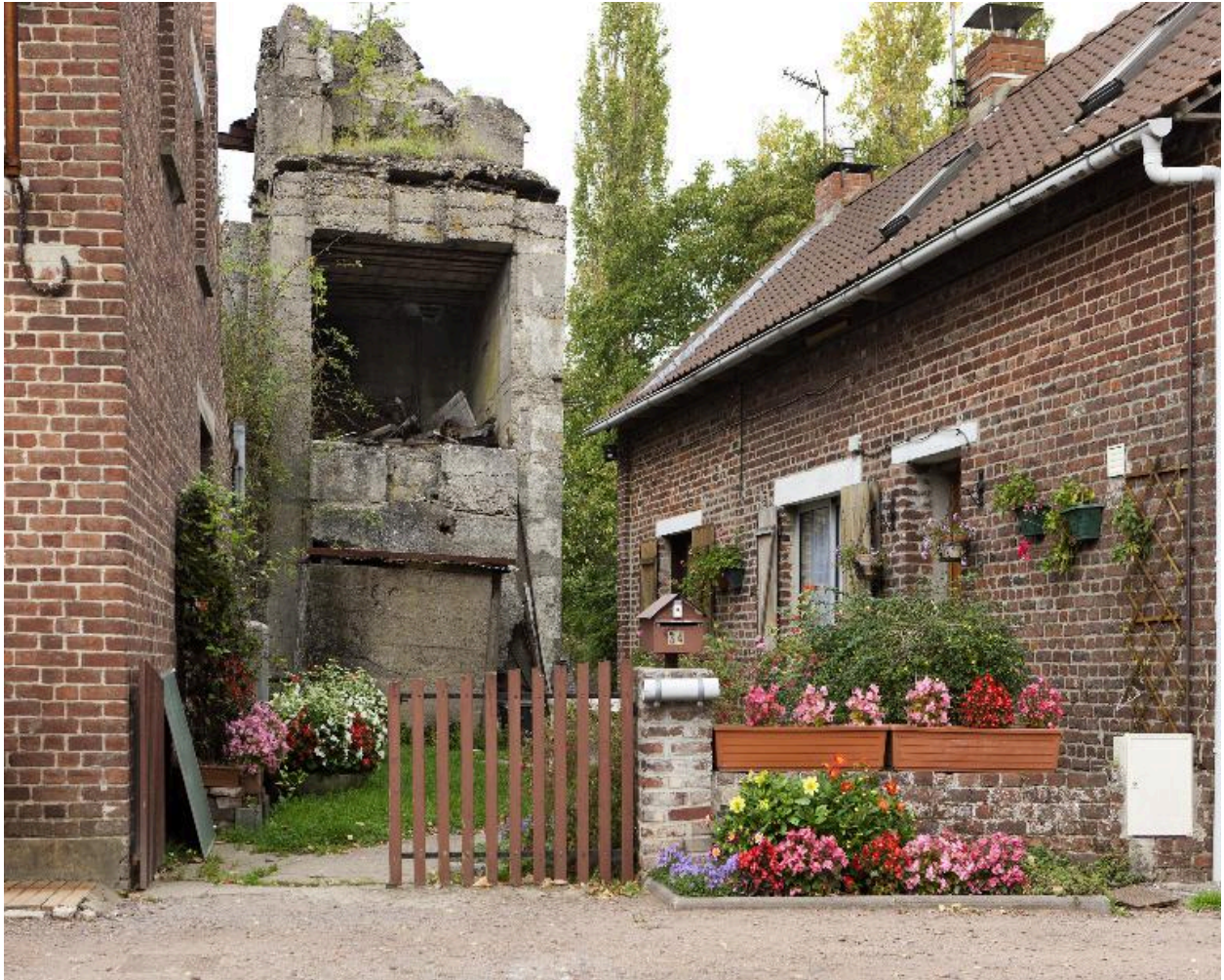
Vue vers le nord, depuis la rue Basse