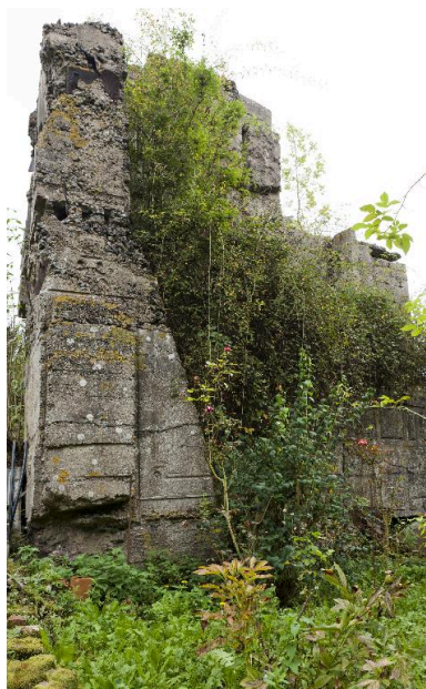
Vue vers l'est IVR31_20145904191NUCA