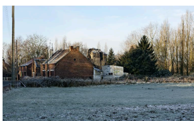
vue générale vers vers le sud IVR31_20145904194NUCA

Plan allemand du réseau de transmissions téléphoniques (non daté) avec situation (cercle rouge) de l'observatoire. IVR32_20175900082NUCA