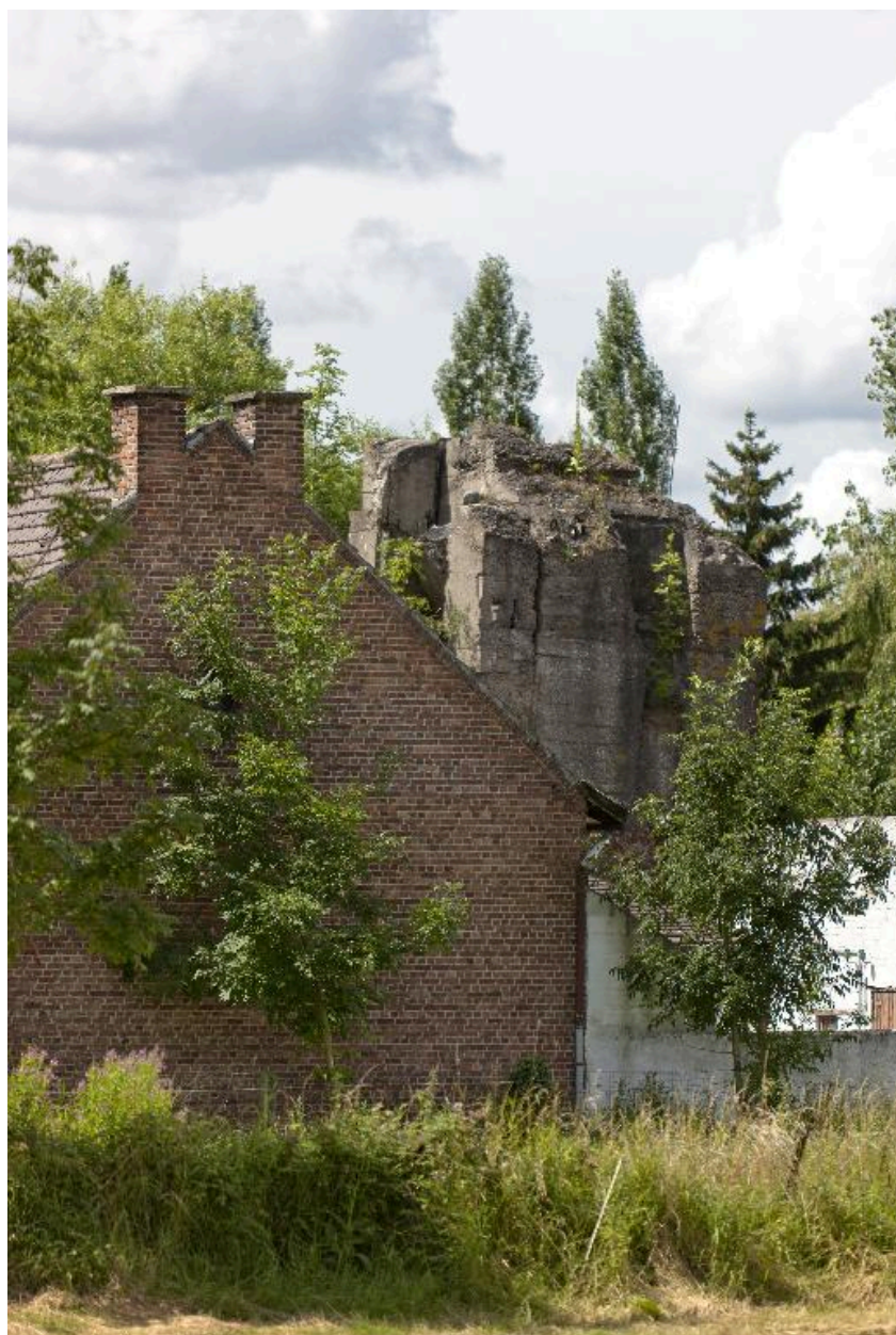
vue générale vers vers le sud