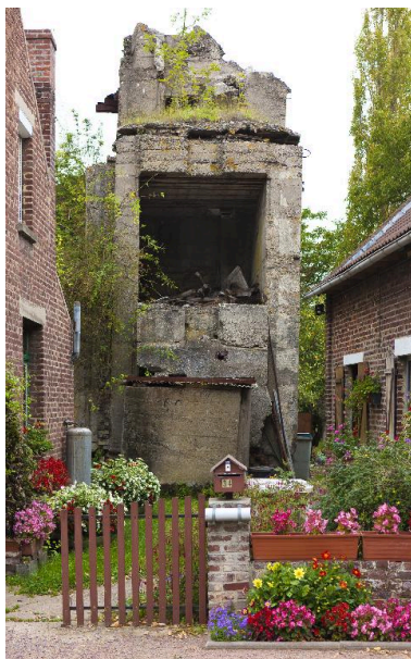
Vue vers le nord, depuis la rue Basse