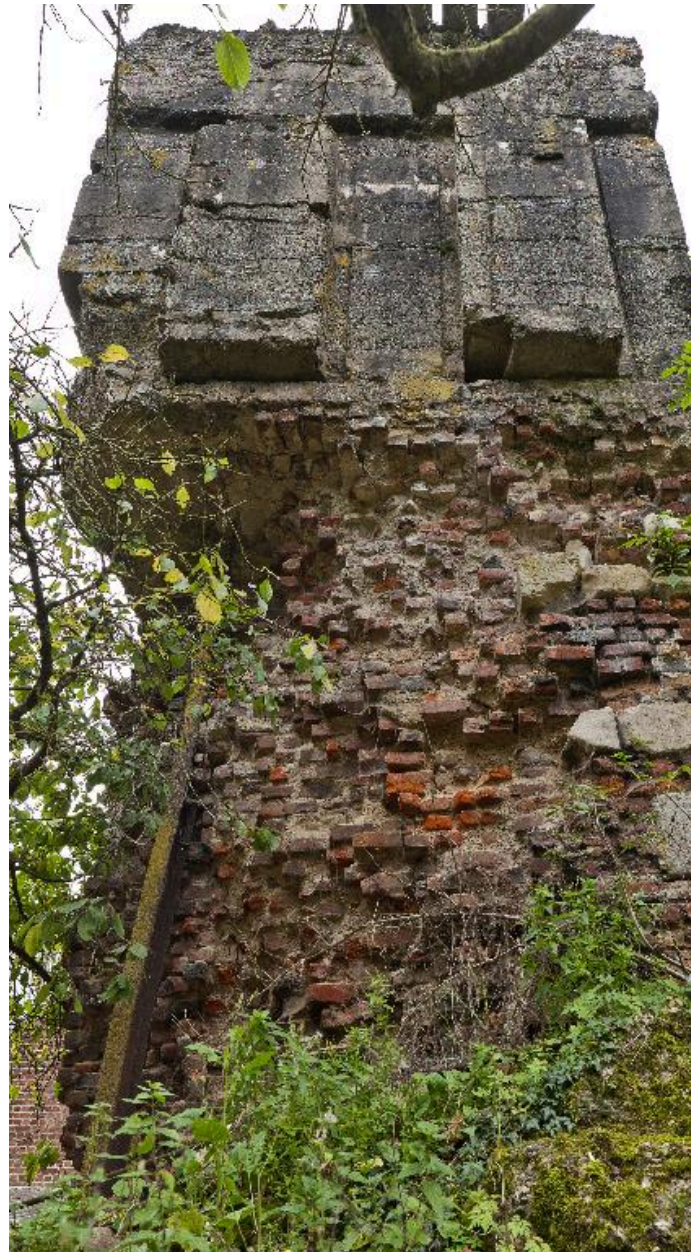
En contre-plongée de l'élévation nord : Détail du sous-bassement en brique et pierre surmonté de la casemate