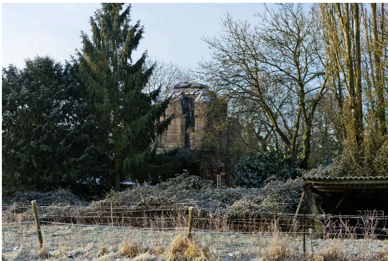
vue générale vers vers le sud