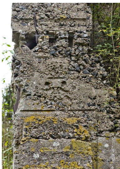
Détail du contrefort est : Angelots d'un bois de coffrage