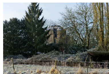
vue générale vers vers le sud IVR31_20145904198NUCA