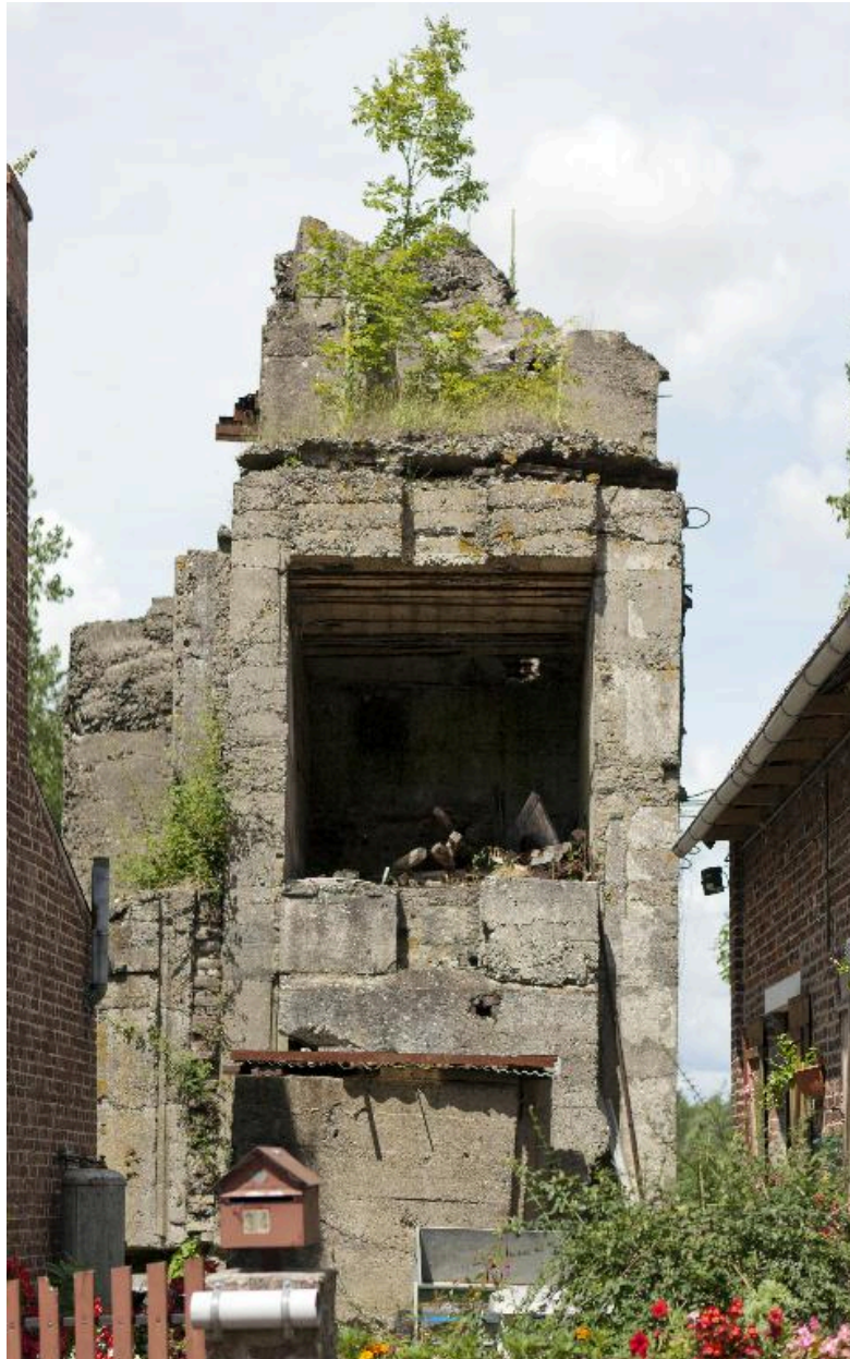
Vue vers le nord, depuis la rue Basse