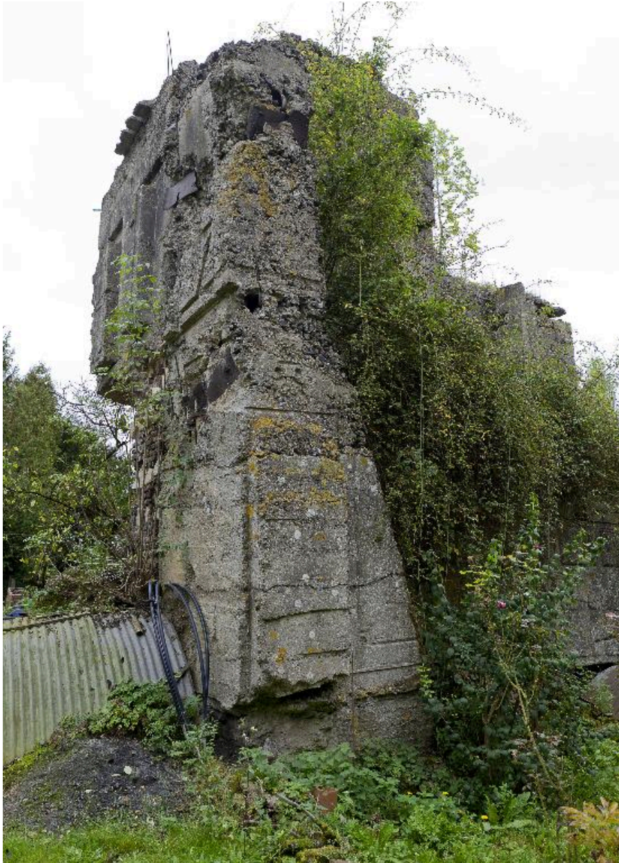
Vue vers l'est