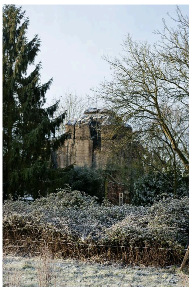
vue générale vers vers le sud IVR31_20145904197NUCA