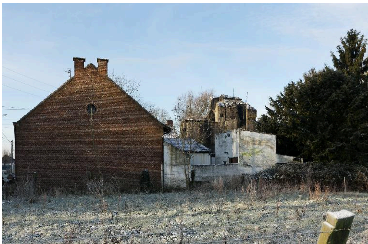
vue générale vers vers le sud