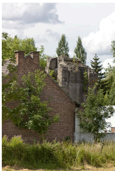
vue générale vers vers le sud