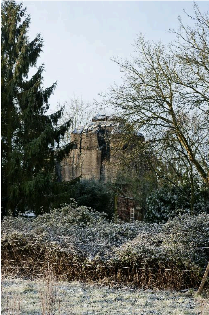
vue générale vers vers le sud