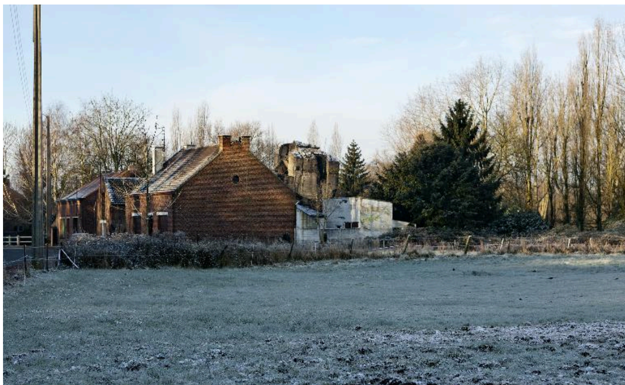
vue générale vers vers le sud