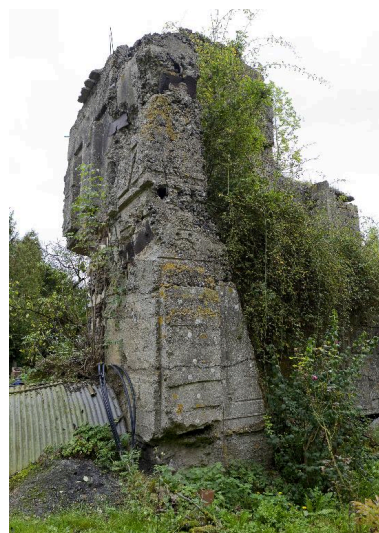
Vue vers l'est