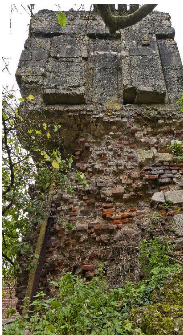
En contre-plongée de l'élévation nord : Détail du sous- bassement en brique et pierre surmonté de la casemate IVR31_20145904208NUCA