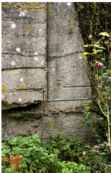
Détail du contrefort est. Empreintes d'une porte