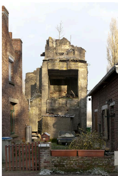
Vue vers le nord, depuis la rue Basse