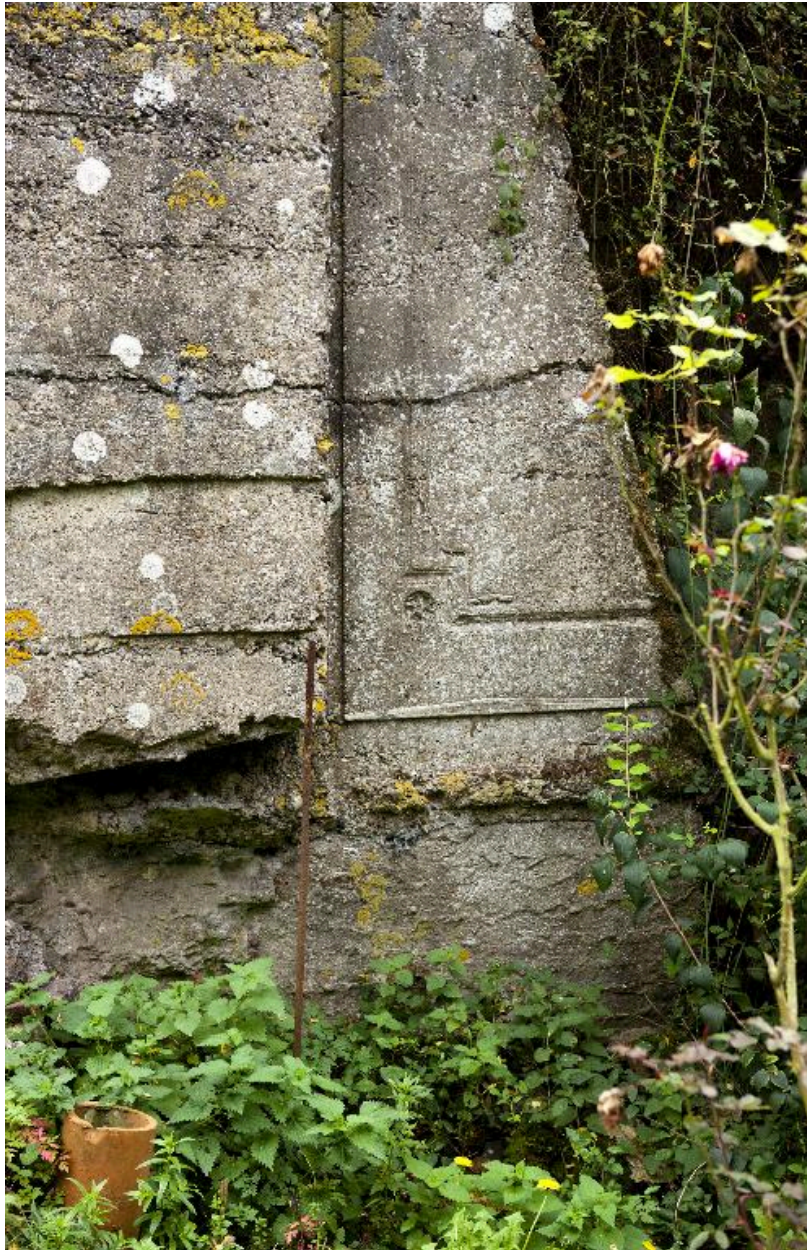
Détail du contrefort est. Empreintes d'une porte