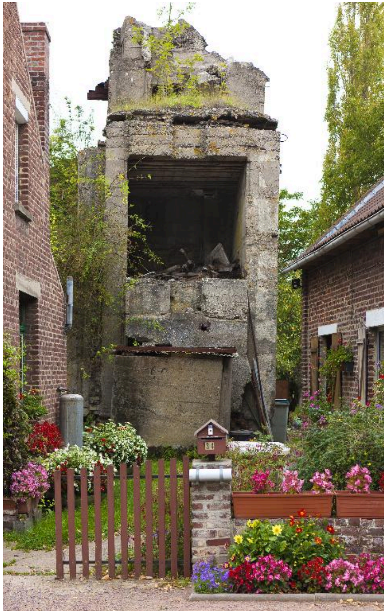
Vue vers le nord, depuis la rue Basse