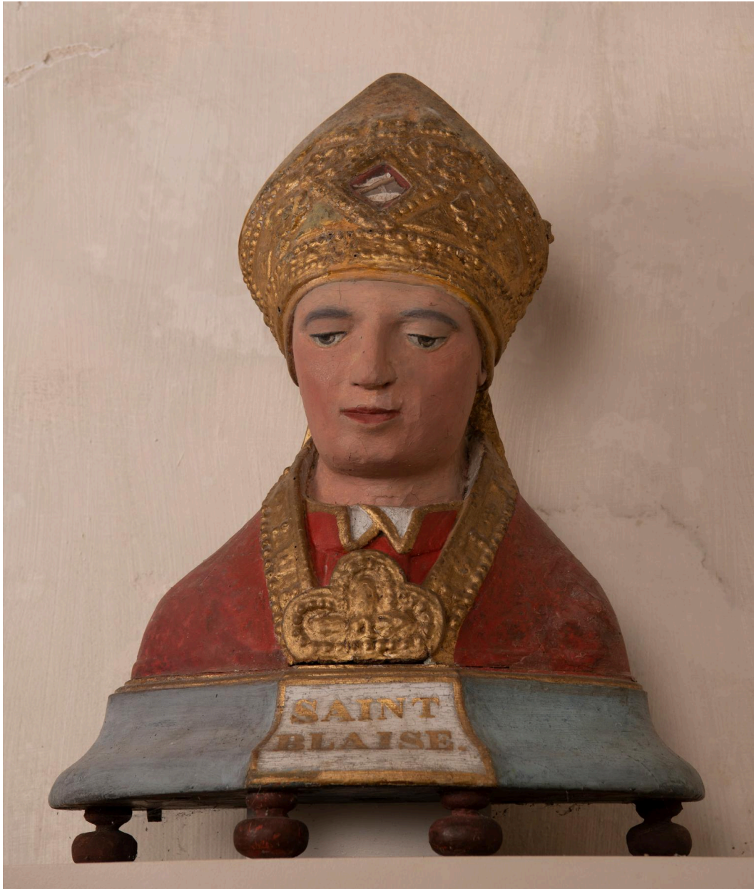
Buste-reliquaire de saint Blaise, bois polychrome, XVIe siècle.