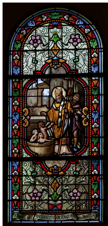
Verrière (baie 1) : saint Nicolas, verre peint, signé « Latteux Bazin, Mesnil-saint-Firmin », dernier quart du XIXe siècle.

IVR32_20236000154NUCA