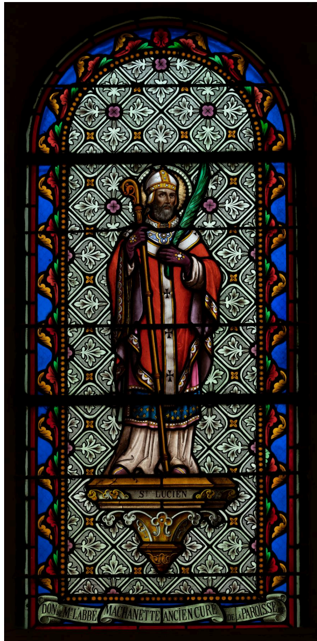
Verrière (baie 3) : saint Lucien, verre peint, atelier Latteux Bazin, dernier quart du XIXe siècle.