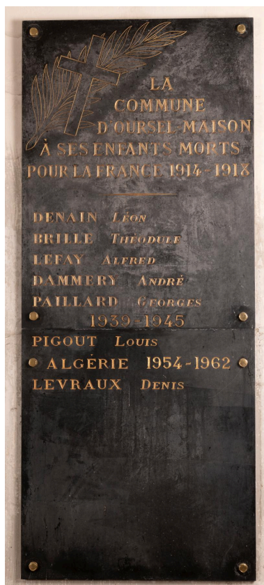
Plaque commémorative des paroissiens morts pendant les guerres, marbre, vers 1920 puis après 1962.

IVR32_20236000153NUCA