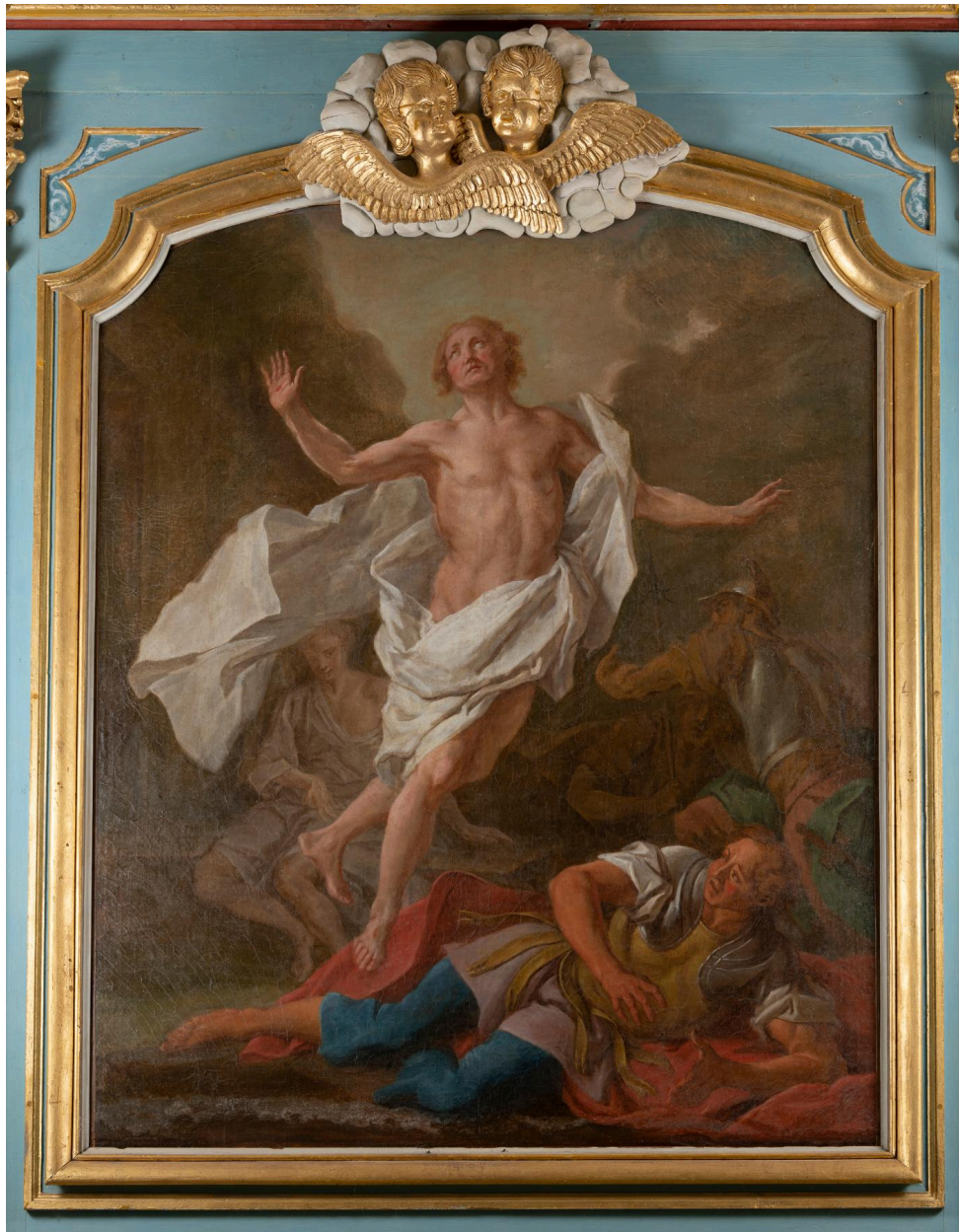
Tableau d'autel : La Résurrection, huile sur toile, XVIIIe siècle.