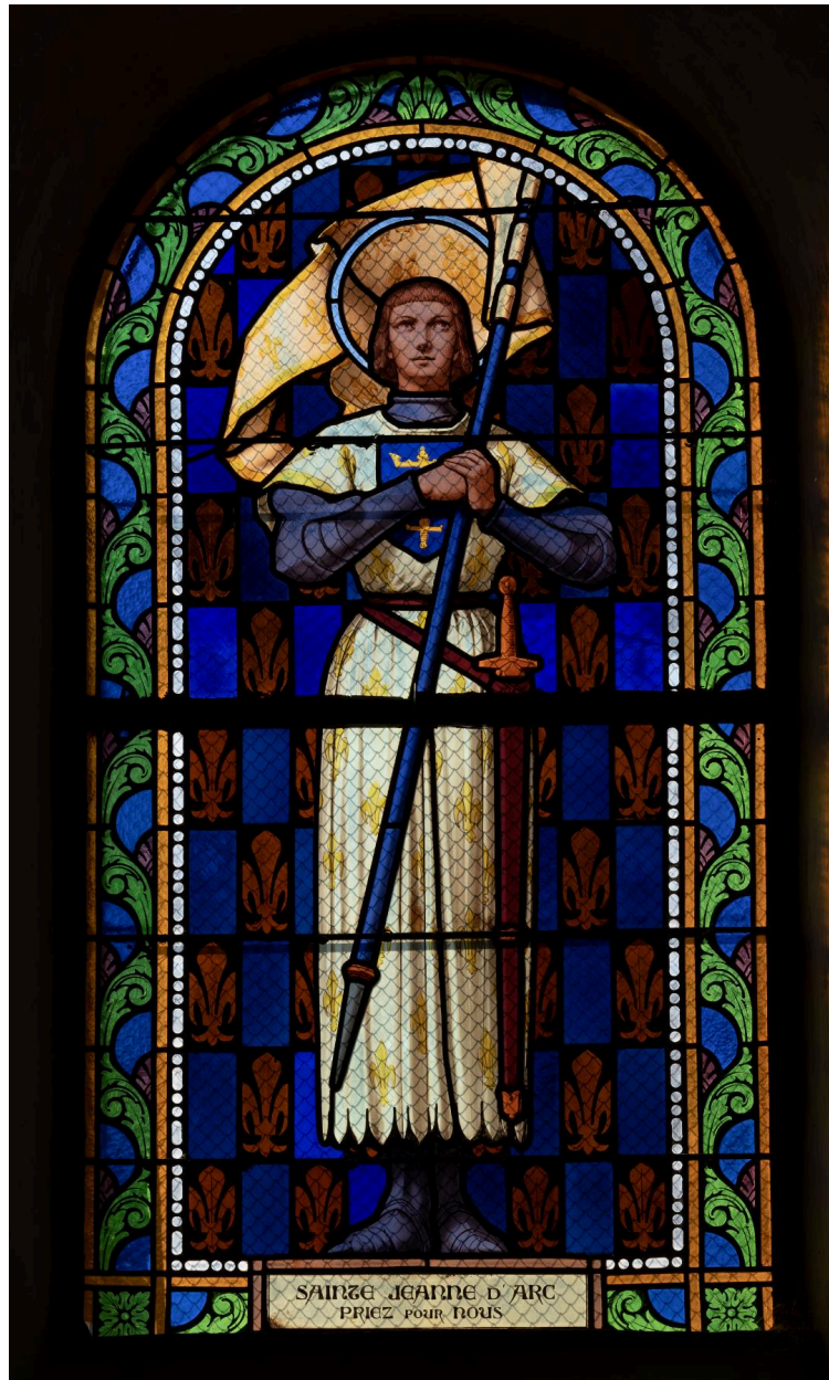
Verrière (baie 10) : Jeanne d'Arc, verre peint, première moitié du XXe siècle.