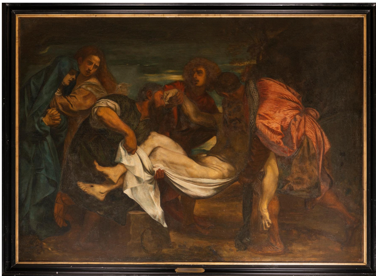
Tableau : Mise au tombeau, huile sur toile, M. Bourbon, d'après un tableau de Titien, 1899.