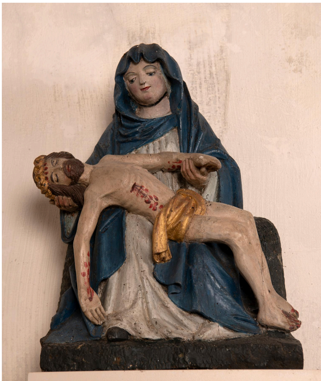
Statue : Pietà, bois polychrome, XVIe siècle.