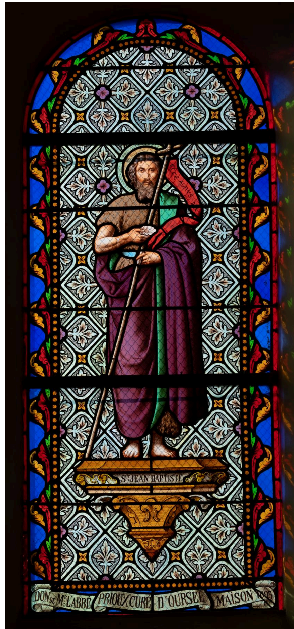
Verrière (baie 4) : saint Jean-Baptiste, verre peint, atelier Latteux Bazin, dernier quart du XIXe siècle.