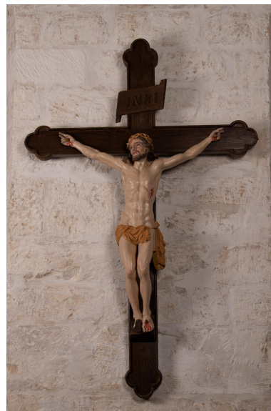
Croix : Christ en Croix, bois polychrome, XVIIIe siècle (?). IVR32_20236000149NUCA