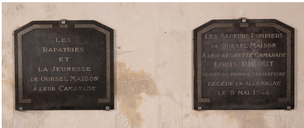
Deux plaques commémoratives, marbre, après 1944.