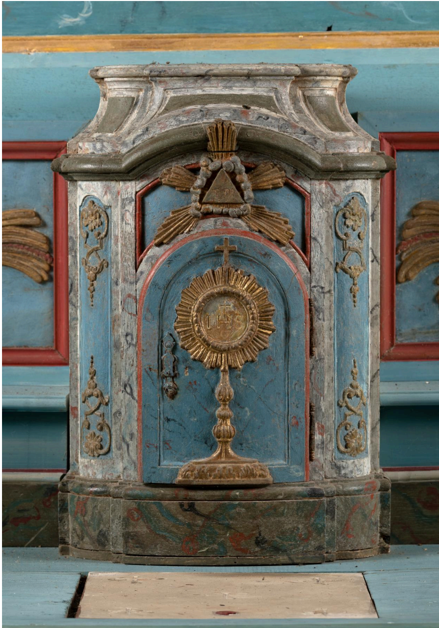
Tabernacle du maître-autel, bois polychrome, XVIIIe siècle.