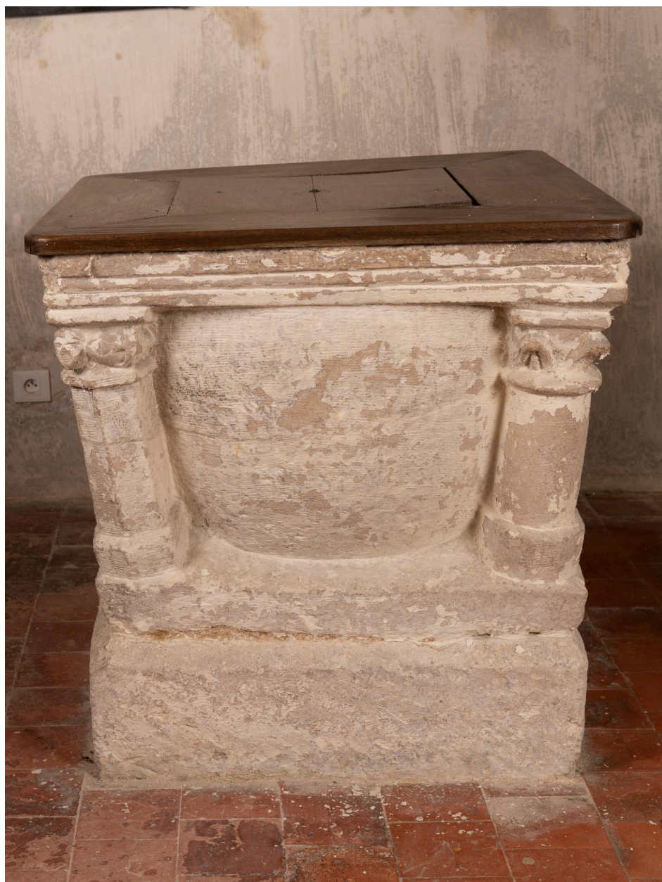
Fonts baptismaux, pierre monolithe, XIIIe siècle (?), classés Monument Historique (PM60001254).