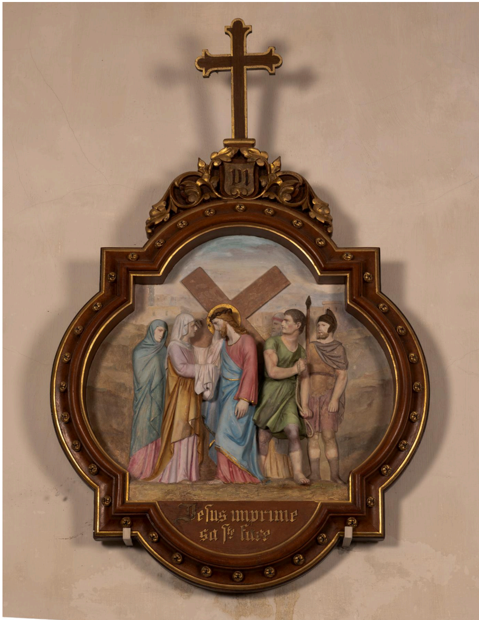
Station 6 du chemin de croix : Jésus imprime sa Sainte Face, plâtre polychrome, seconde moitié du XIXe siècle.