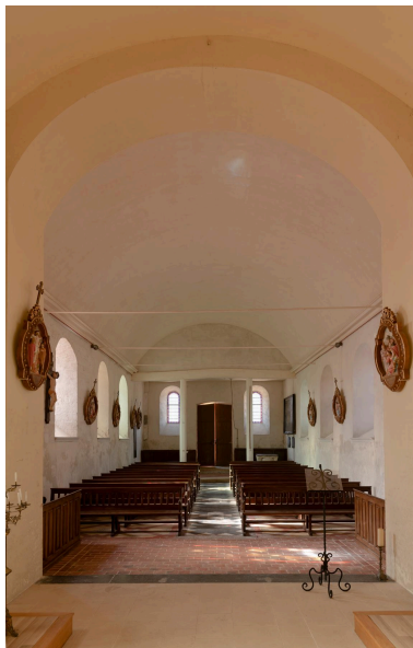
Vue vers la nef. IVR32_20236000157NUCA