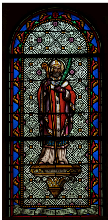
Verrière (baie 3) : saint Lucien, verre peint, atelier Latteux Bazin, dernier quart du XIXe siècle.