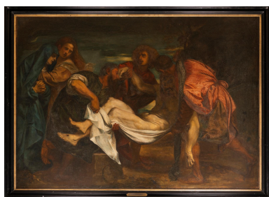
Tableau : Mise au tombeau, huile sur toile, M. Bourbon, d'après un tableau de Titien, 1899.

IVR32_20236000153NUCA