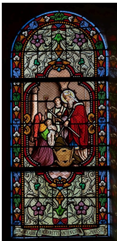
Verrière (baie 2) : saint Blaise guérit un enfant avec une épine dans la

IVR32_20236000135NUCA