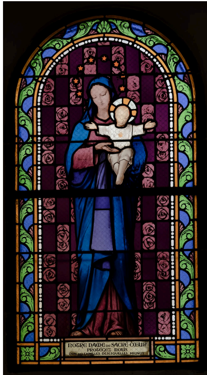
Verrière (baie 9) : Notre Dame du Sacré-Cœur, verre peint, première moitié du XXe siècle.