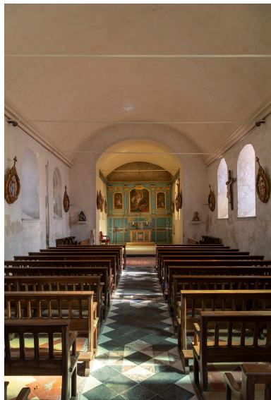
Vue vers le chœur.