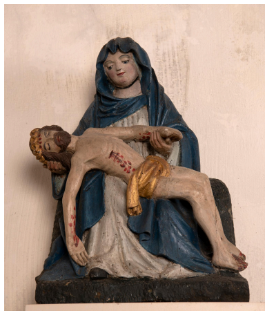
Statue : Pietà, bois polychrome, XVIIe siècle. IVR32_20236000147NUCA