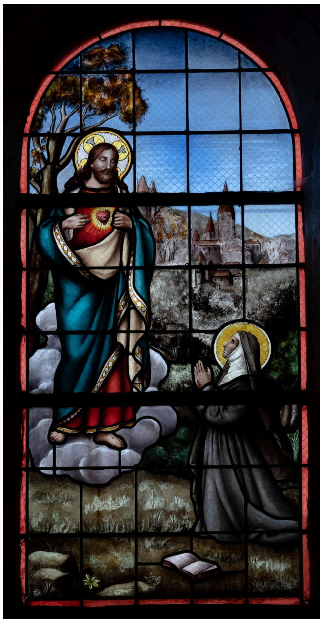
Verrière (baie 6) : Apparition du Sacré-Cœur à Marguerite-Marie Alacoque, verre peint, vers 1893.