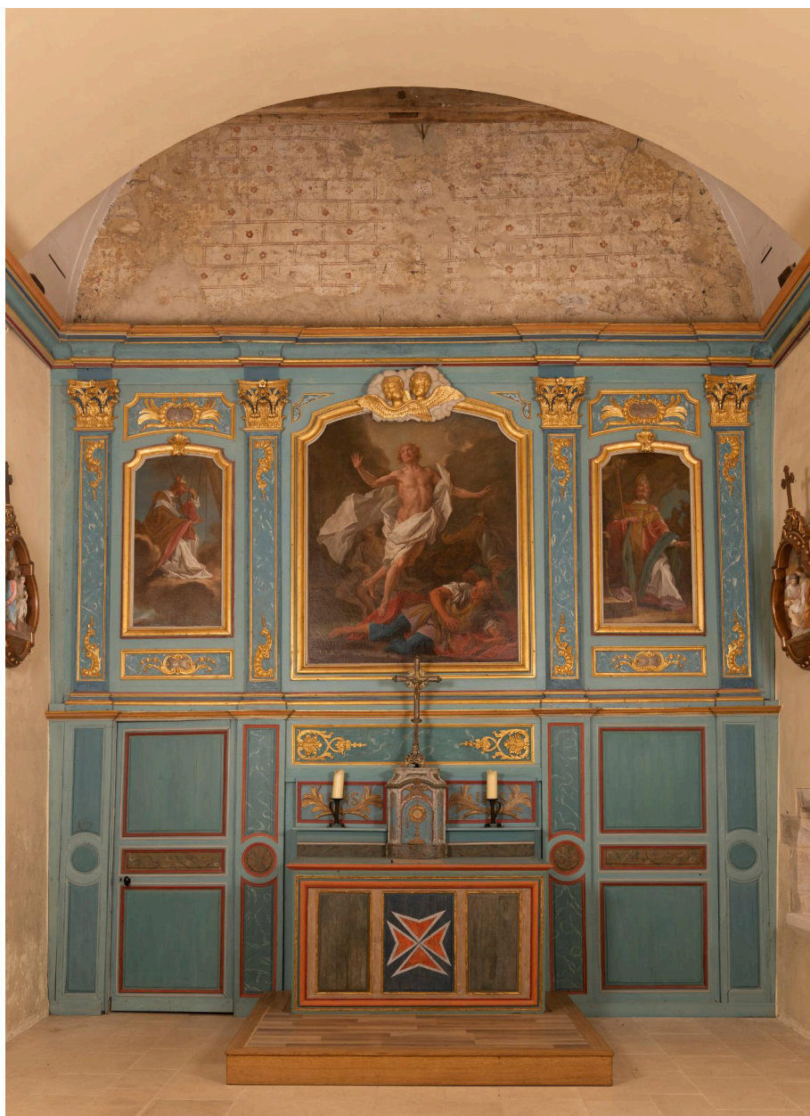
Vue générale du sanctuaire avec l'ensemble du maître-autel.