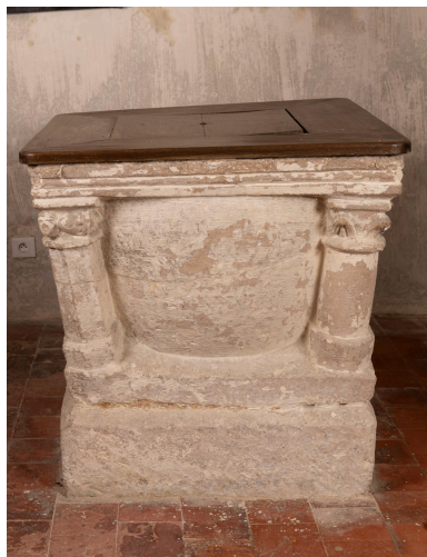
Fonts baptismaux, pierre monolithe, XIIIe siècle (?), classés Monument Historique (PM60001254). IVR32_20236000151NUCA