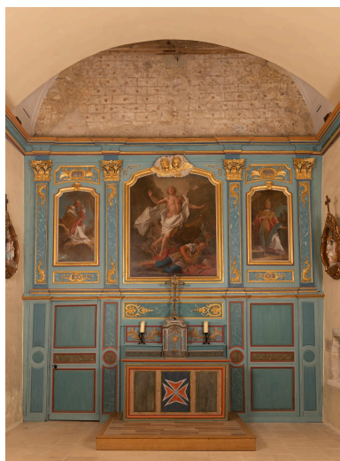
Vue générale du sanctuaire avec l'ensemble du maître-autel.