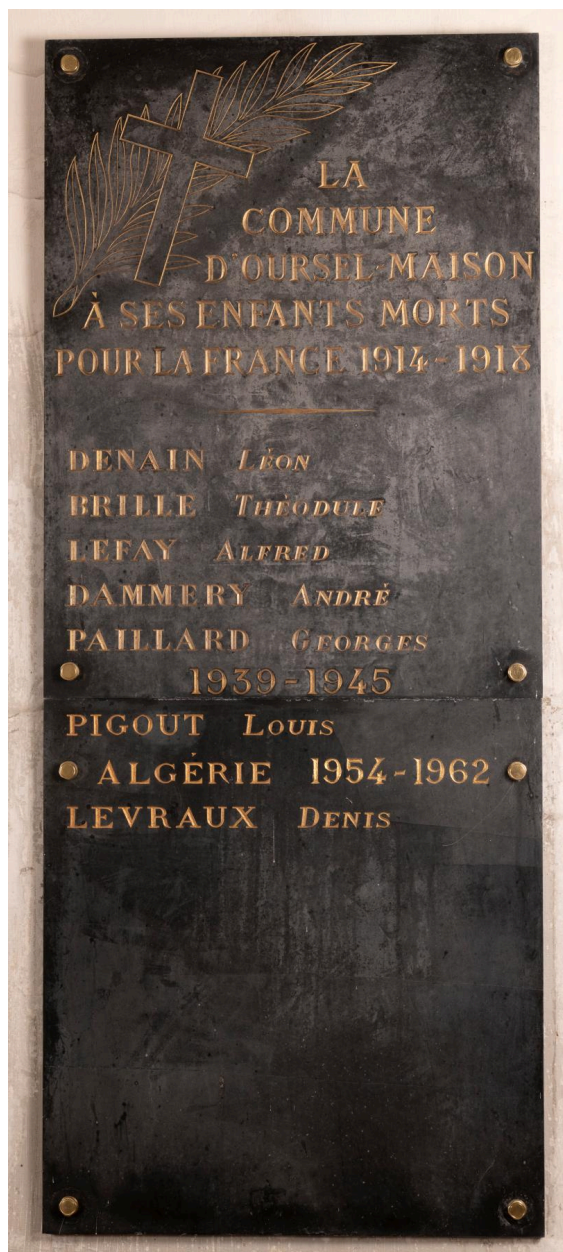
Plaque commémorative des paroissiens morts pendant les guerres, marbre, vers 1920 puis après 1962.