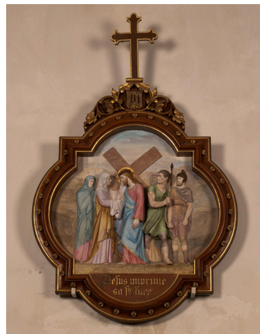
Station 6 du chemin de croix : Jésus imprime sa Sainte Face, plâtre polychrome, seconde moitié du XIXe siècle. IVR32_20236000155NUCA