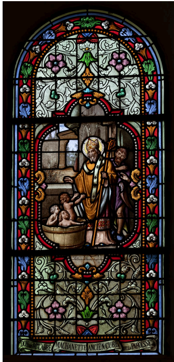
Verrière (baie 1) : saint Nicolas, verre peint, signé « Latteux Bazin, Mesnil-saint-Firmin », dernier quart du XIXe siècle.