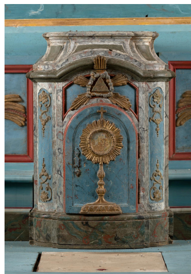
Tabernacle du maître-autel, bois polychrome, XVIIIe siècle. IVR32_20236000143NUCA