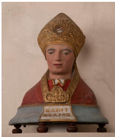
Buste-reliquaire de saint Blaise, bois polychrome, XVIIe siècle. IVR32_20236000148NUCA