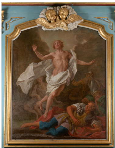
Tableau d'autel : La Résurrection, huile sur toile, XVIIIe siècle.