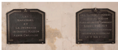
Deux plaques commémoratives, marbre, après 1944.