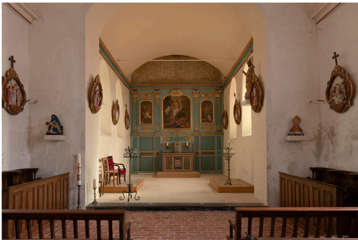
Vue générale du chœur.