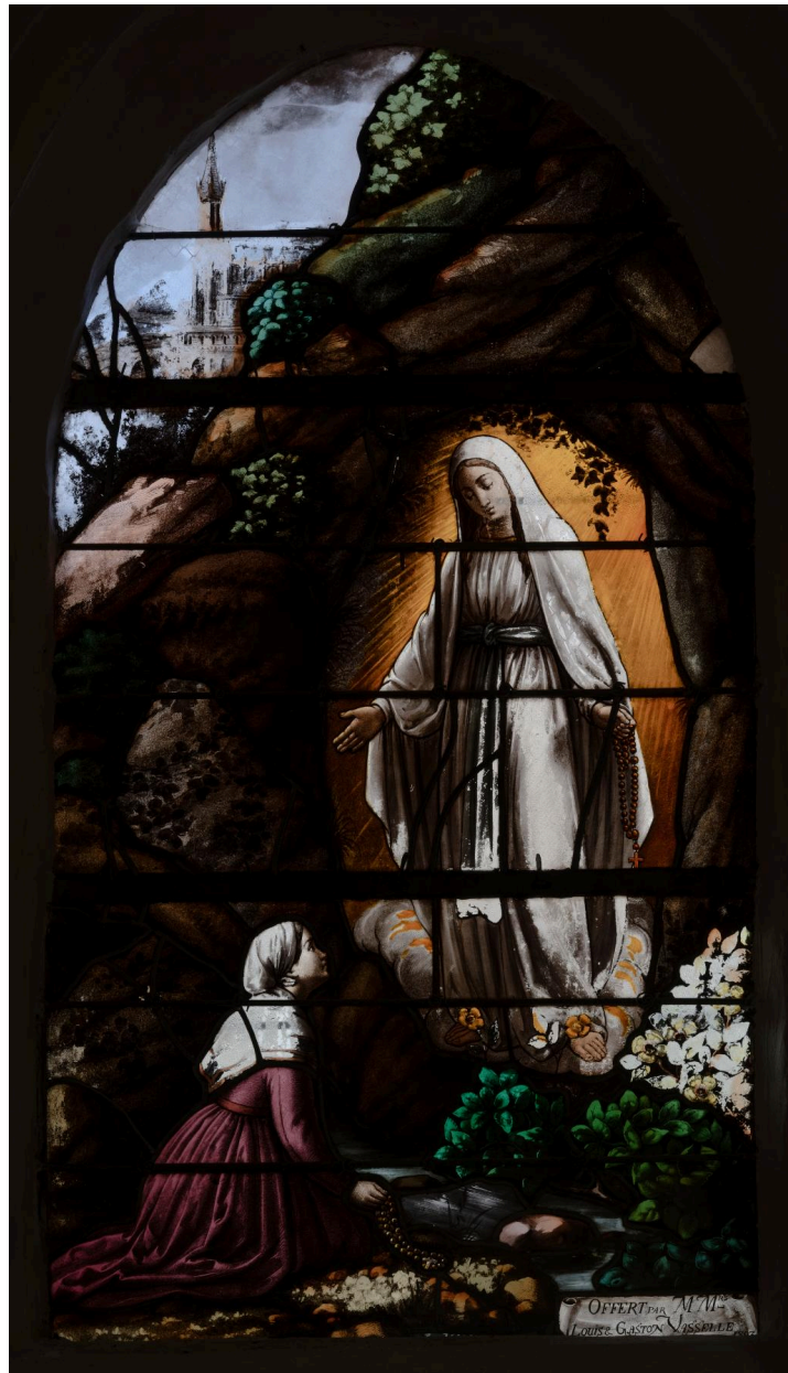
Verrière (baie 5) : Grotte de Lourdes, verre peint, 1893.