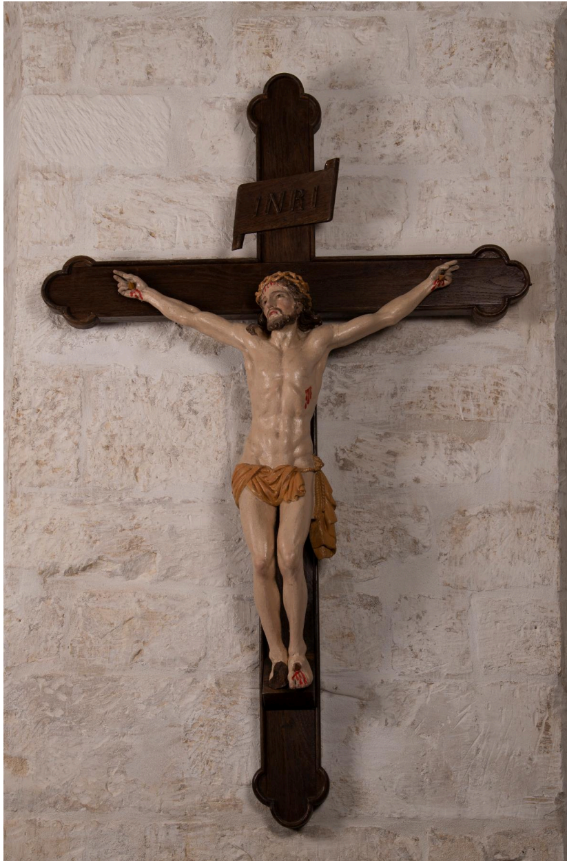
Croix : Christ en Croix, bois polychrome, XVIIIe siècle (?).