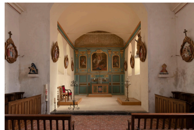
Vue générale du chœur. IVR32_20236000150NUCA