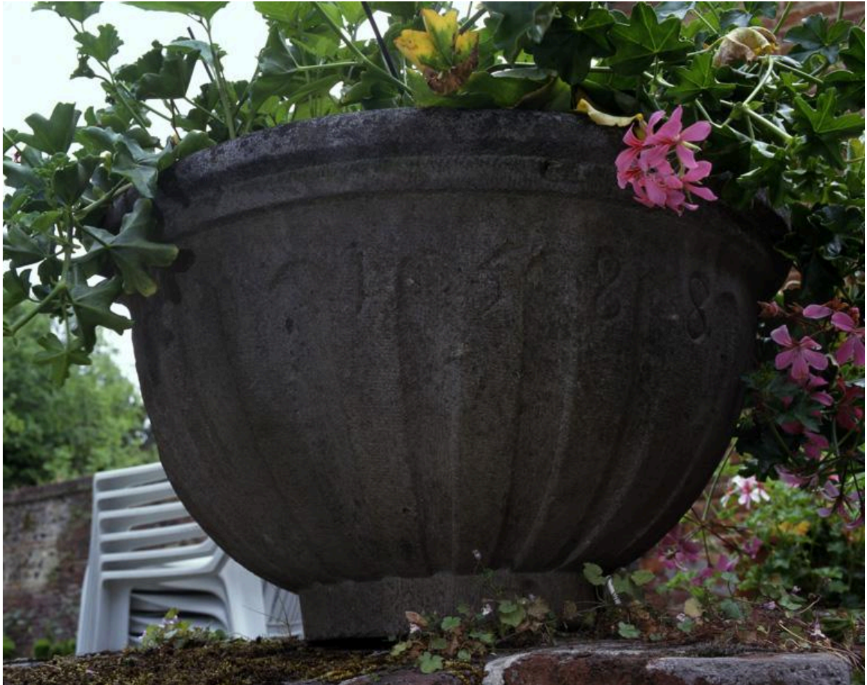
Cuve des précédents fonts baptismaux de l'église.