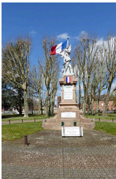
Vue générale. IVR32_20210205028NUCA