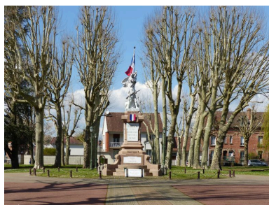
Vue de situation, dans le parc Sellier.