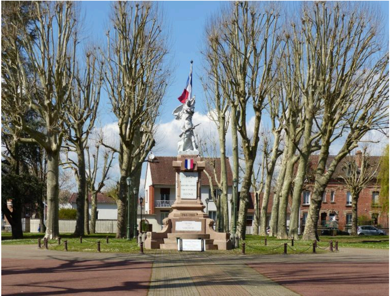
Vue de situation, dans le parc Sellier.