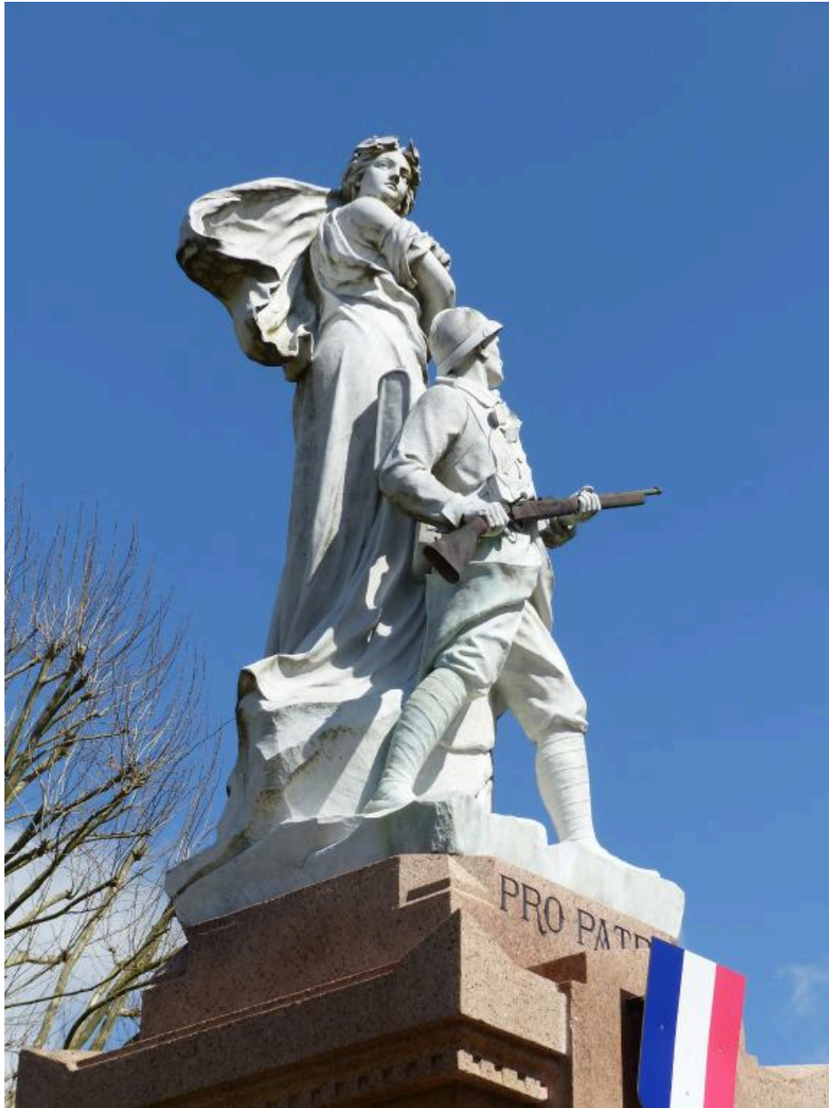
Vue du groupe sculpté, depuis le sud-ouest.