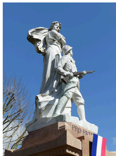
Vue du groupe sculpté, depuis le sud-ouest. IVR32_20210205029NUCA