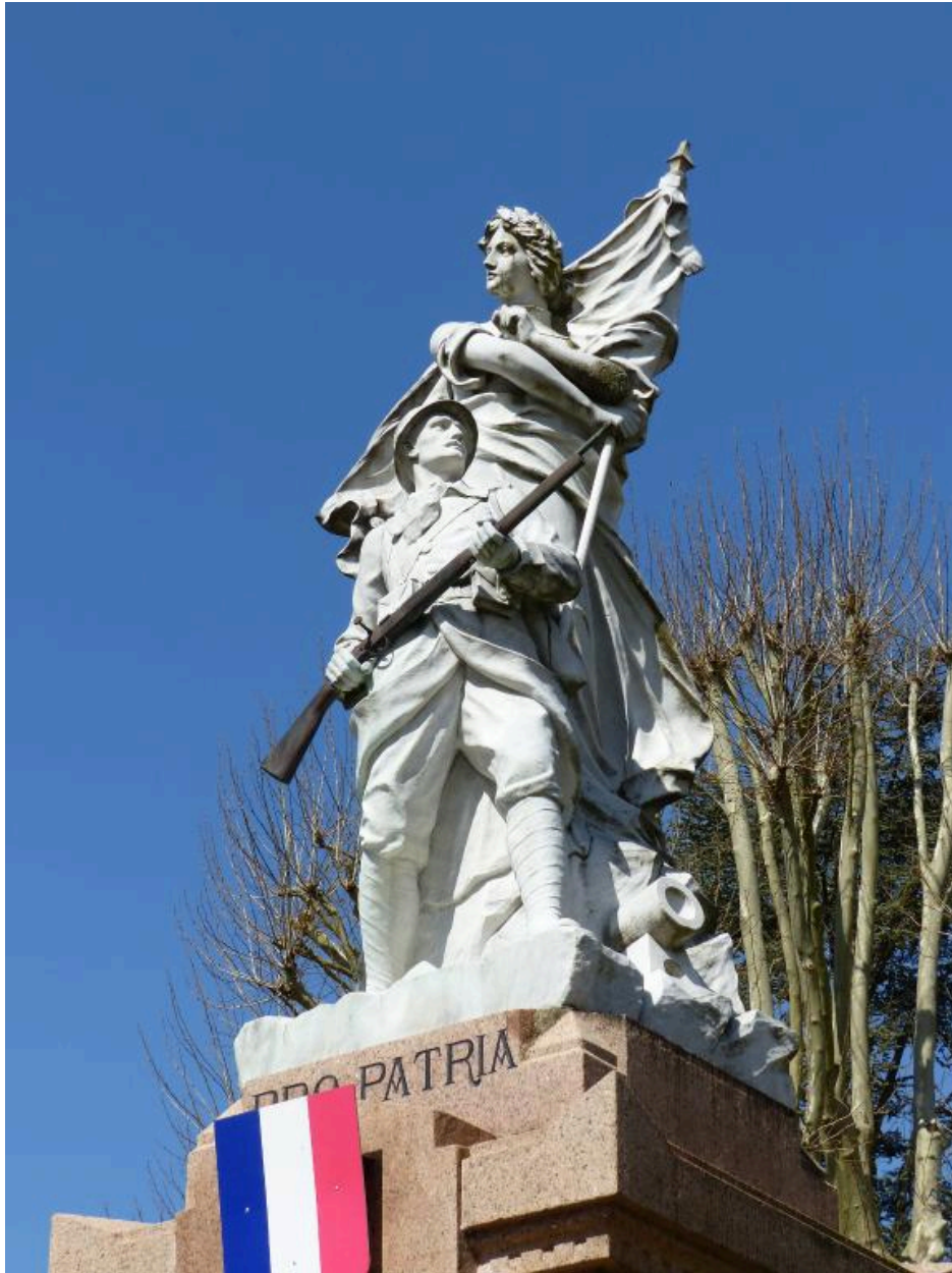
Vue du groupe sculpté depuis le sud-est.