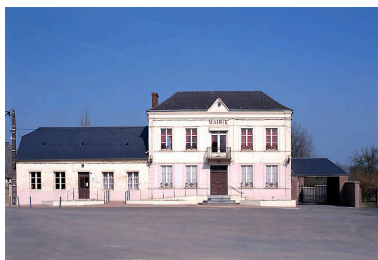
Vue générale depuis le sud-ouest. IVR22_19990201285XA