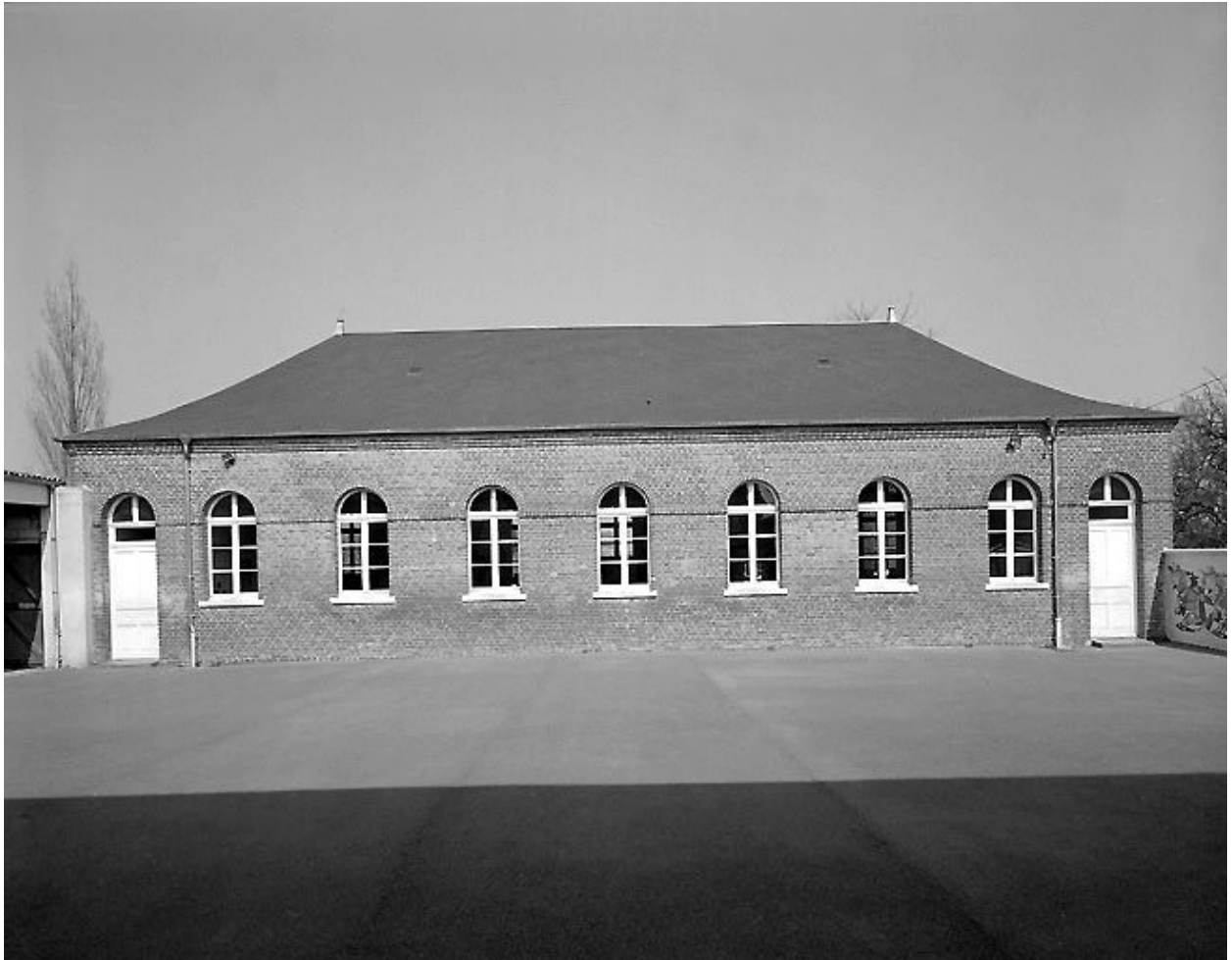
Salle de classe au fond de la cour arrière.