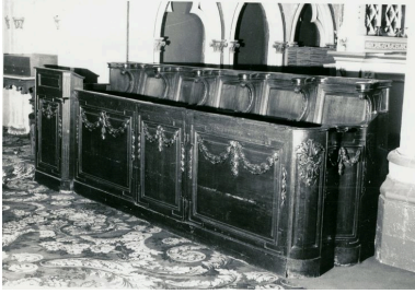
Vue générale, de côté IVR31_20106202220NUC