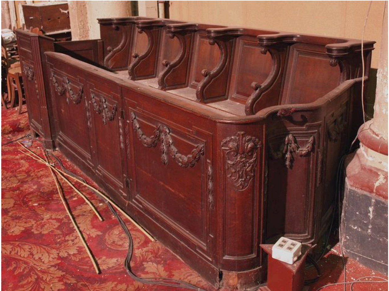
Stalles du côté gauche