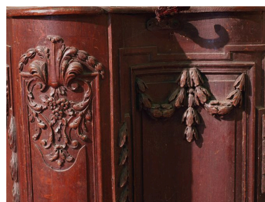
Vue de détail, guirlande et décor d'angle IVR31_20106201931NUCA