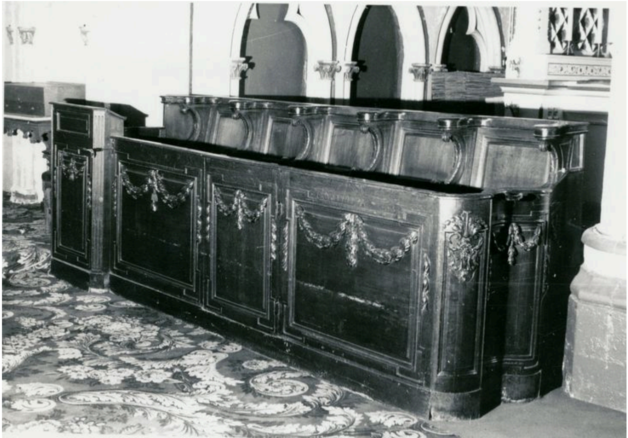
Vue générale, de côté