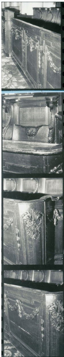
Vue de détail (phot. Wintrebert, 1978, fonds AOA62)