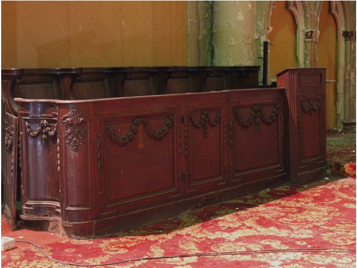
Stalles du côté droit