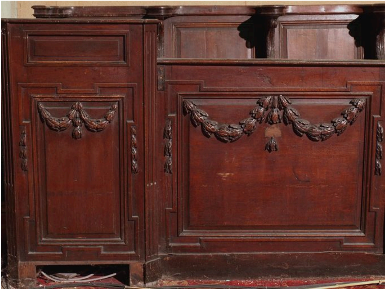
Vue de détail, guirlandes