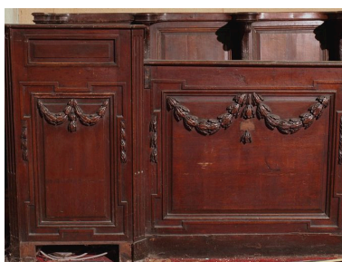
Vue de détail, guirlandes IVR31_20106201930NUCA