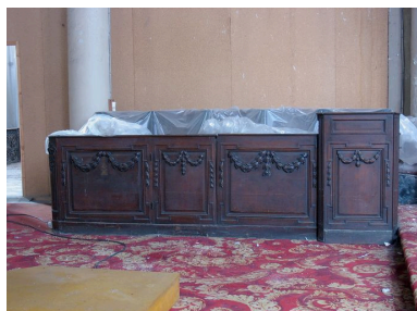
Vue de face IVR31_20106201929NUCA