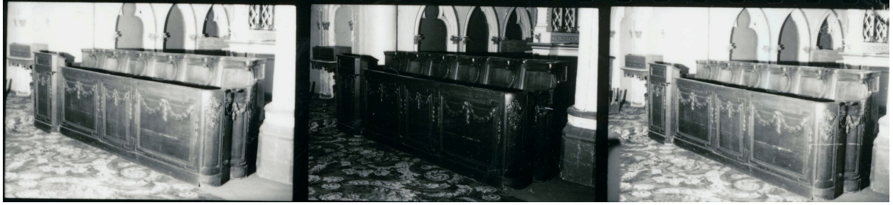
Vue générale, de côté