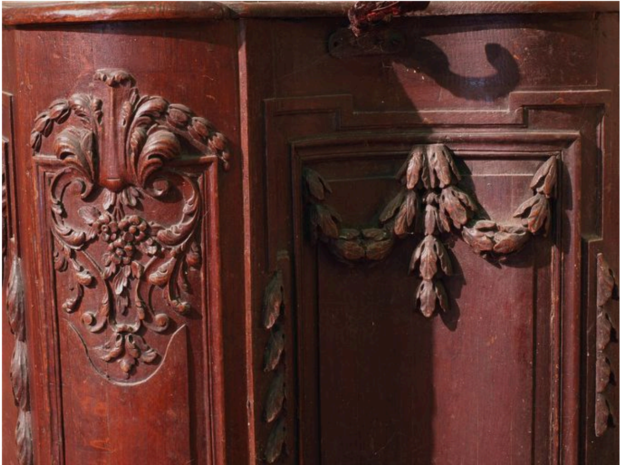
Vue de détail, guirlande et décor d'angle