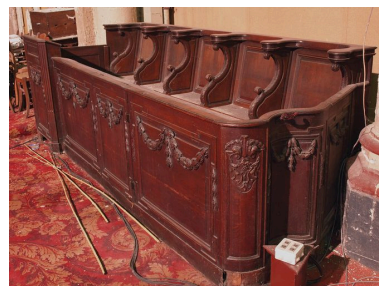
Stalles du côté gauche IVR31_20106201927NUCA