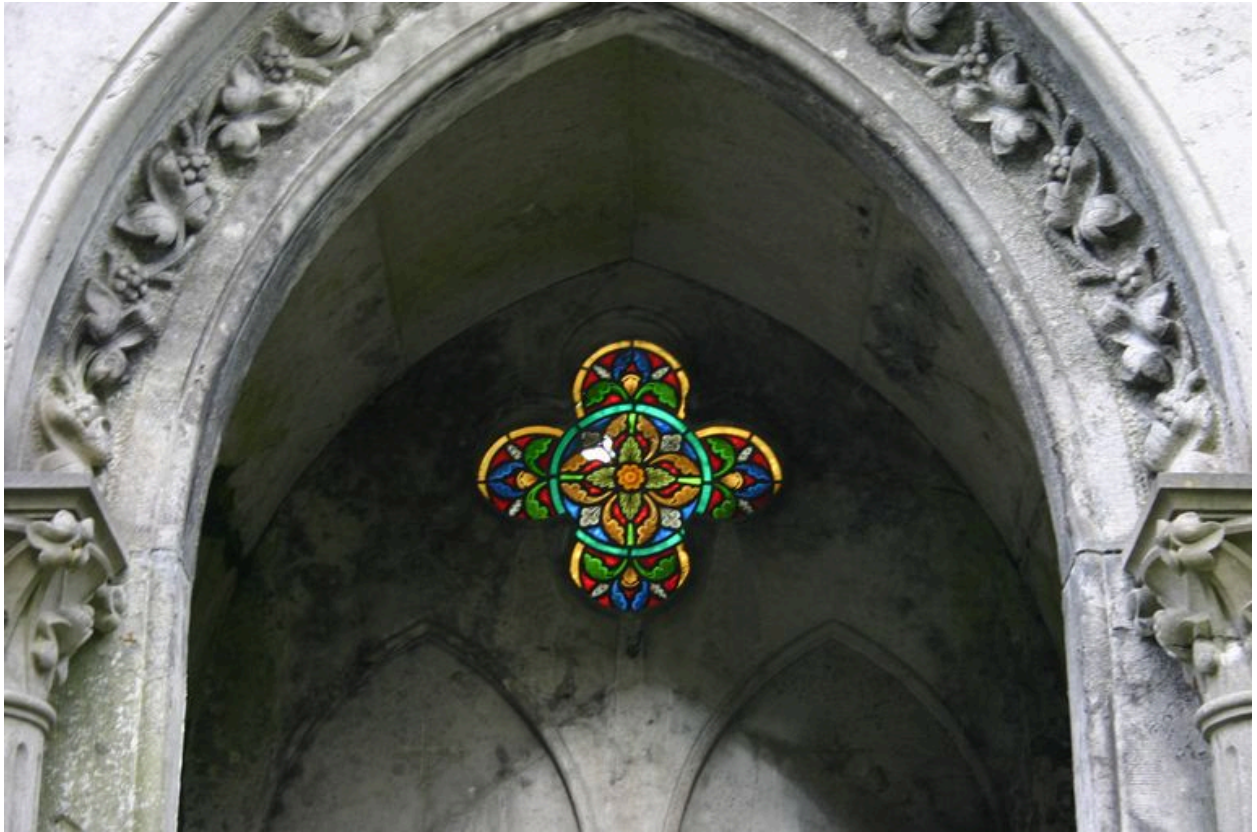
Détail du vitrail quadrilobé.