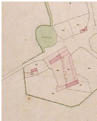
Extrait du cadastre napoléonien présentant le plan de la ferme en 1832.

Phot. Monnehay-Vulliet Marie-Laure IVR22_20068005931XA