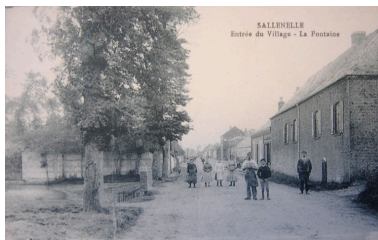
Carte postale présentant le logis au début du 20e siècle : celui-ci ne porte pas la date de 1849.