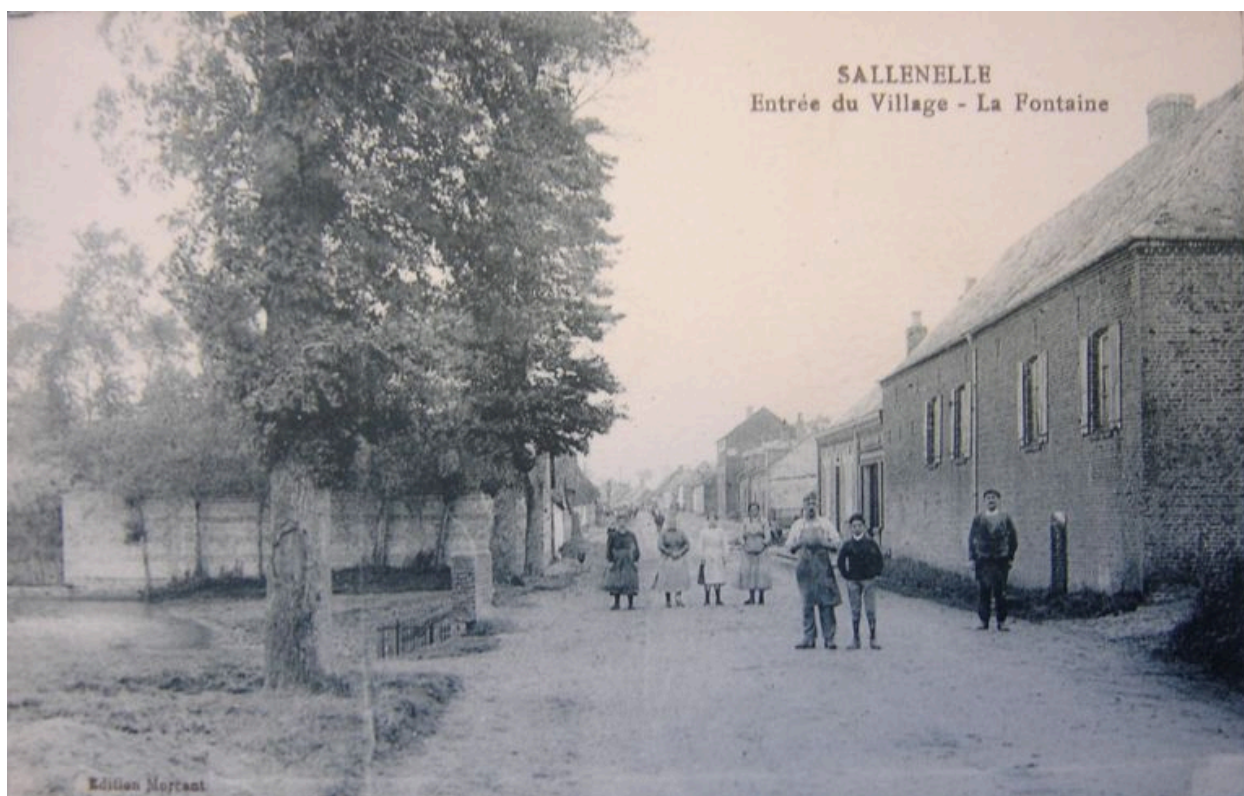
Carte postale présentant le logis au début du 20e siècle : celui-ci ne porte pas la date de 1849.