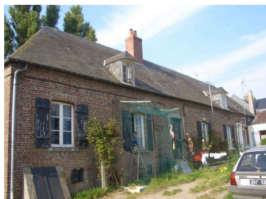
Vue postérieure.