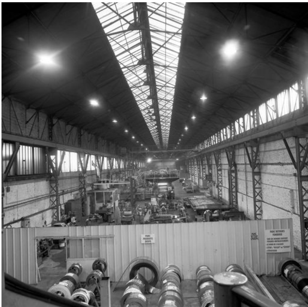
Intérieur de l'atelier de fabrication (laminage et tréfilerie) avec la charpente métallique apparente.