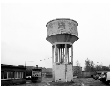
Le château d'eau. IVR22_19986000074X