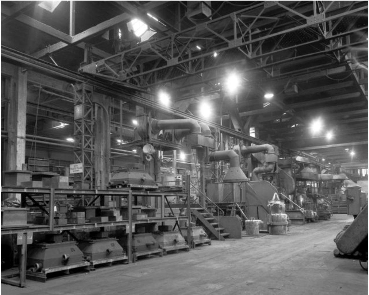
Intérieur de l'atelier de fabrication (fonderie) avec la charpente métallique apparente.