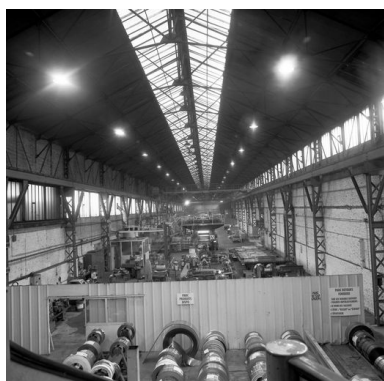
Intérieur de l'atelier de fabrication (laminage et tréfilerie) avec la charpente métallique apparente.