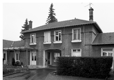
Les bureaux, façade est. IVR22_19986000064X