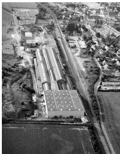
Vue aérienne de l'usine en 1994.