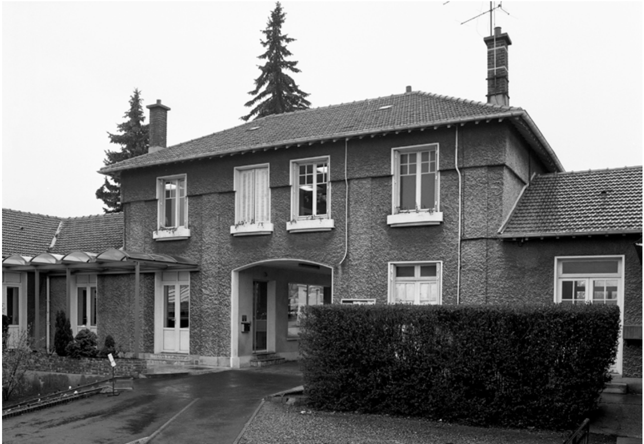
Les bureaux, façade est.