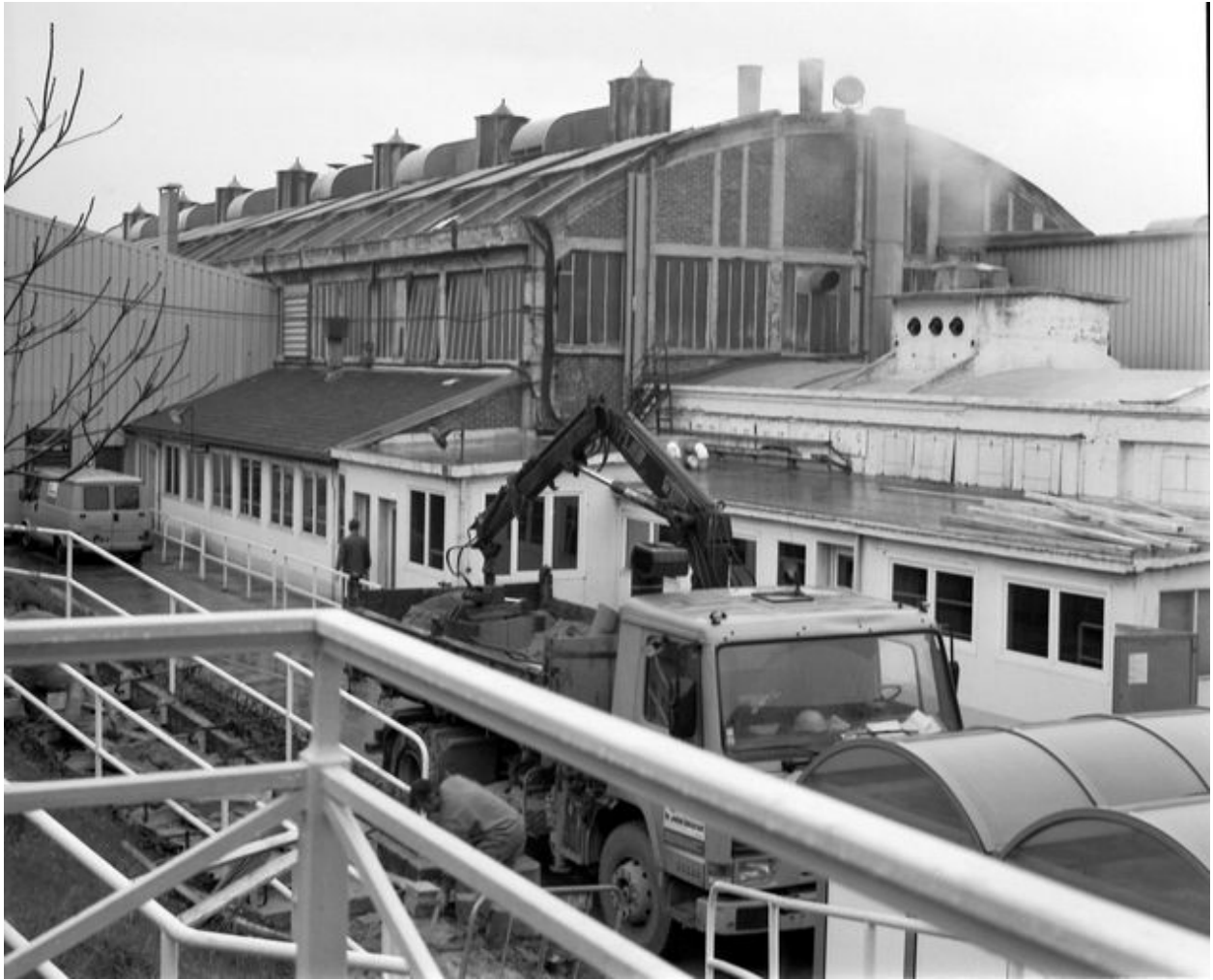
L'atelier de fabrication (fonderie) et son toit bombé, pignon sud.