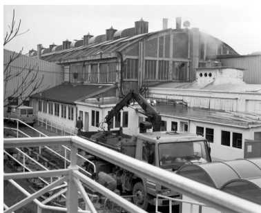
L'atelier de fabrication (fonderie) et son toit bombé, pignon sud.