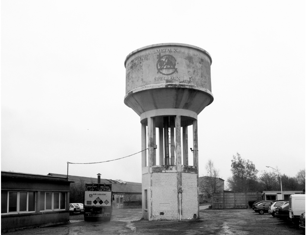
Le château d'eau.