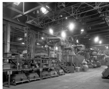
Intérieur de l'atelier de fabrication (fonderie) avec la charpente métallique apparente.