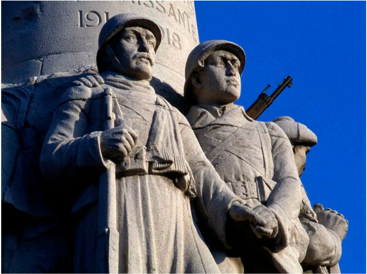
Vue de détail.