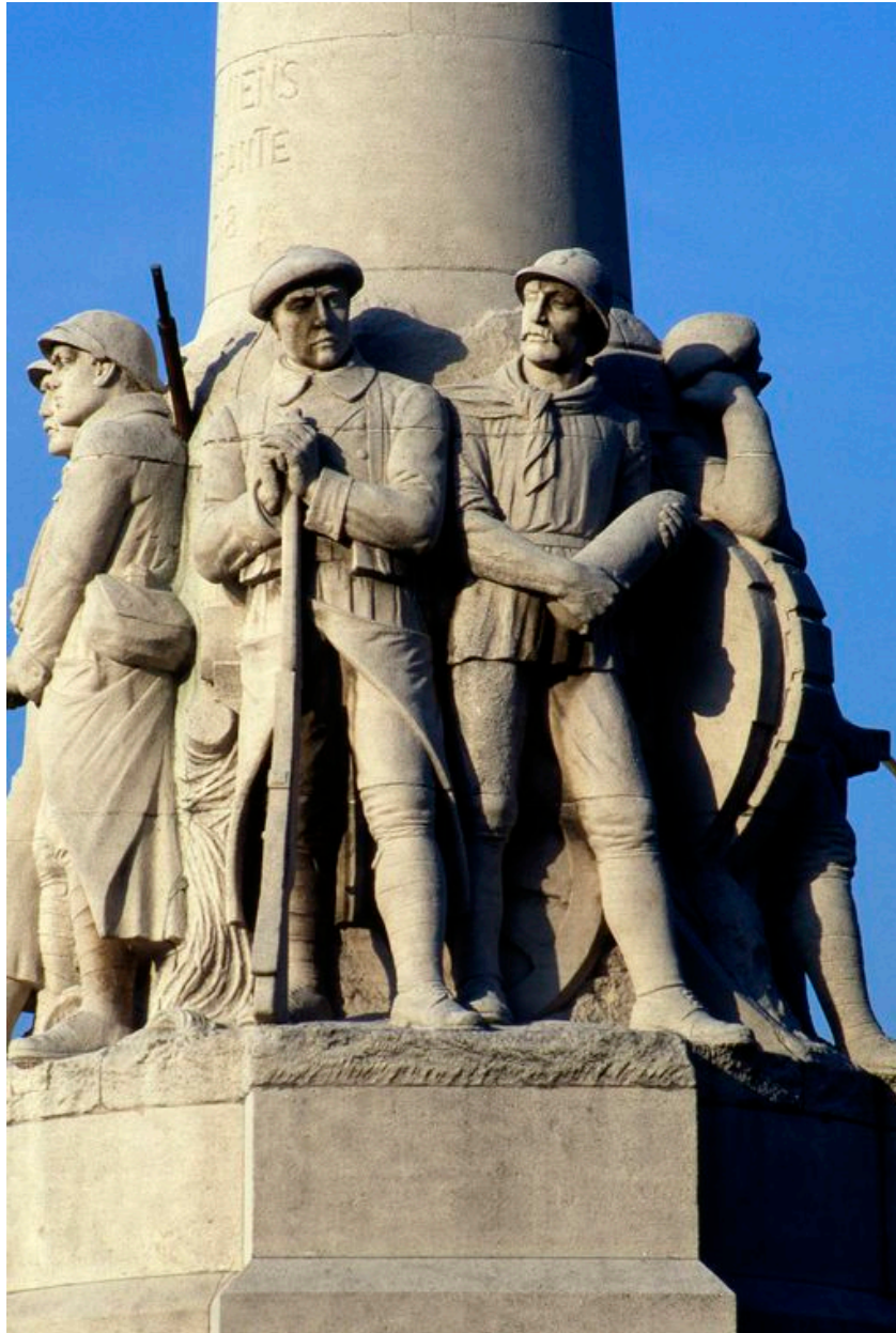
Partie centrale du monument.