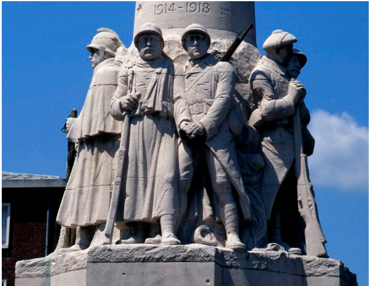
Partie centrale du monument.