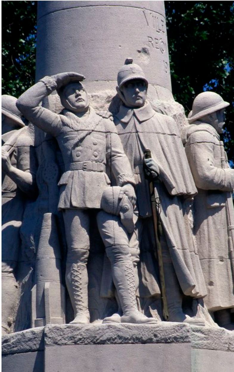
Partie centrale du monument : détail sur un aviateur et un cavalier.