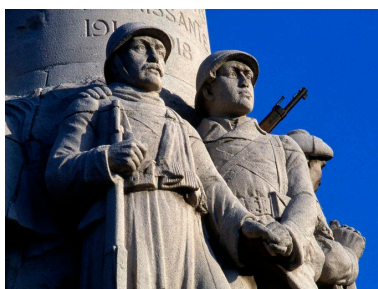
Vue de détail. IVR22_19948000373ZA