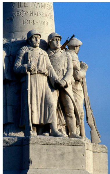
Partie centrale du monument.