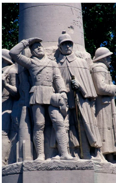
Partie centrale du monument : détail sur un aviateur et un cavalier. IVR22_19948000371ZA