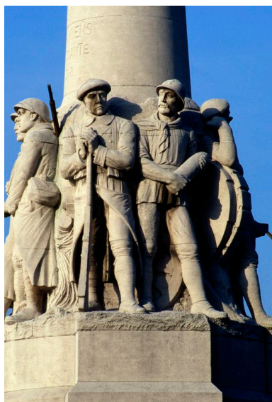
Partie centrale du monument.