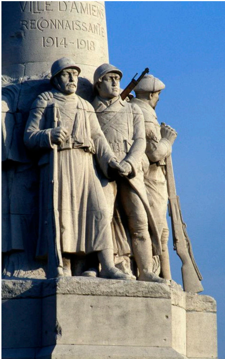
Partie centrale du monument.