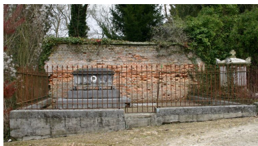
Vue générale. IVR22_20068000609NUCA

IVR22_20078000771NUCA