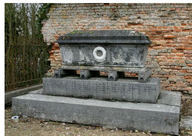
Tombeau en forme de sarcophage.