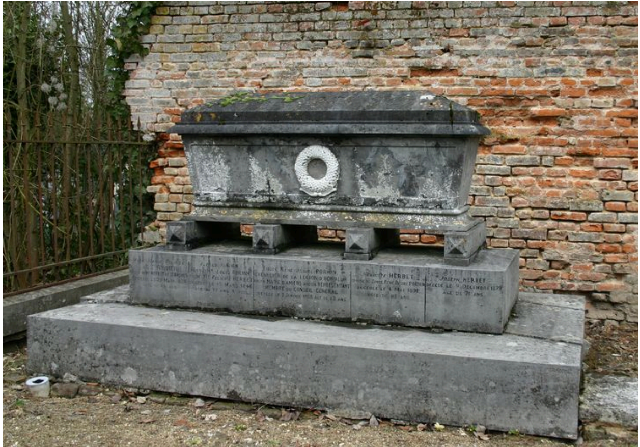
Tombeau en forme de sarcophage.