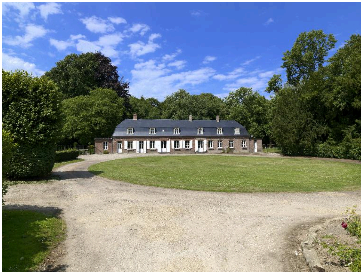
Vue générale de la façade antérieure.