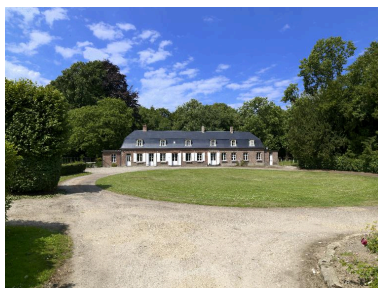
Vue générale de la façade antérieure. IVR22_20158000567NUC2A