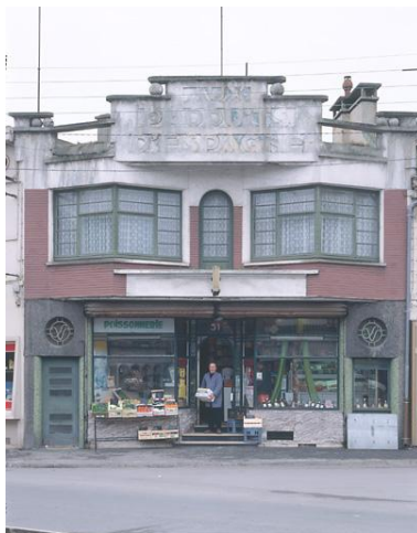
Élévation antérieure. IVR31_19935901399VA