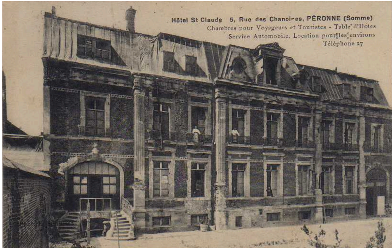
Hôtel Saint-Claude. carte postale (coll. part).