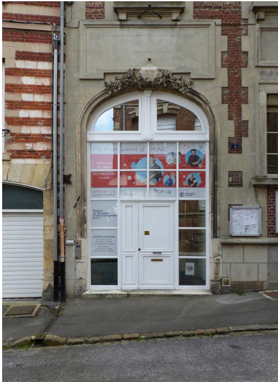
Vue de l'ancienne porte cochère.