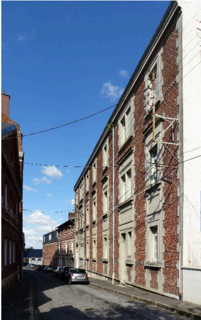
Vue générale depuis le sud.