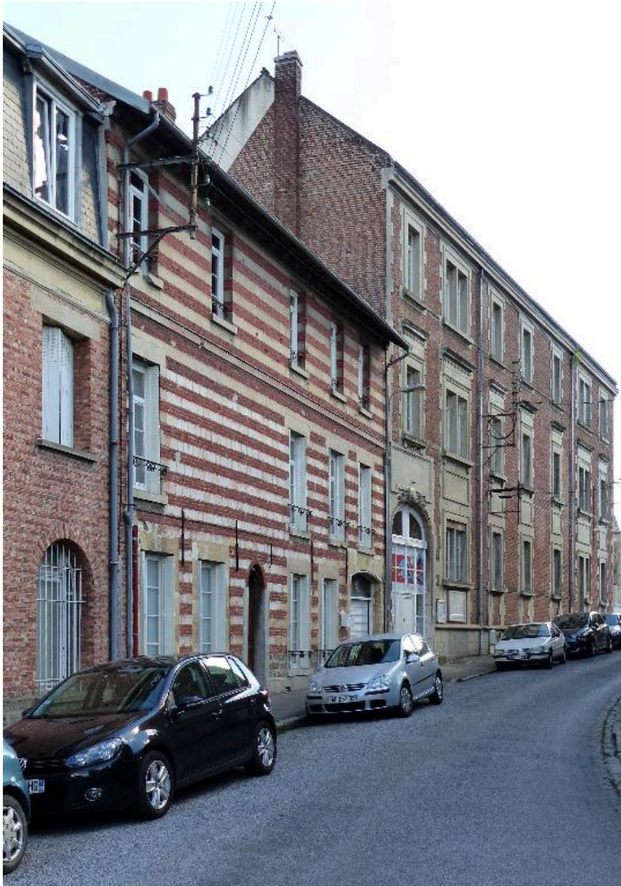
Vue de situation, depuis le nord.