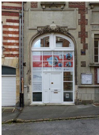
Vue de l'ancienne porte cochère.