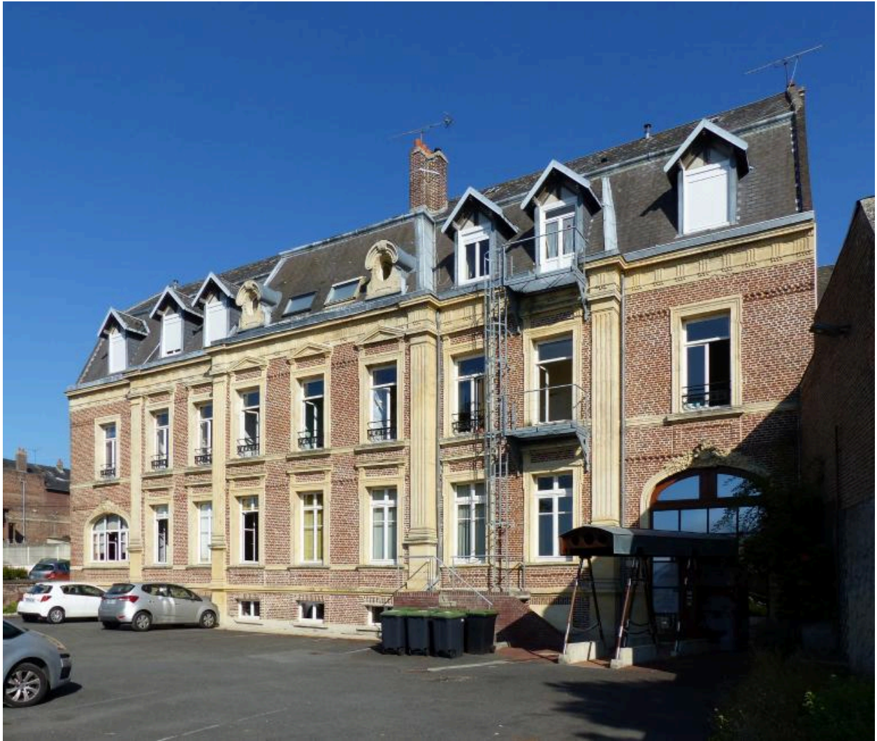
Vue depuis la cour.