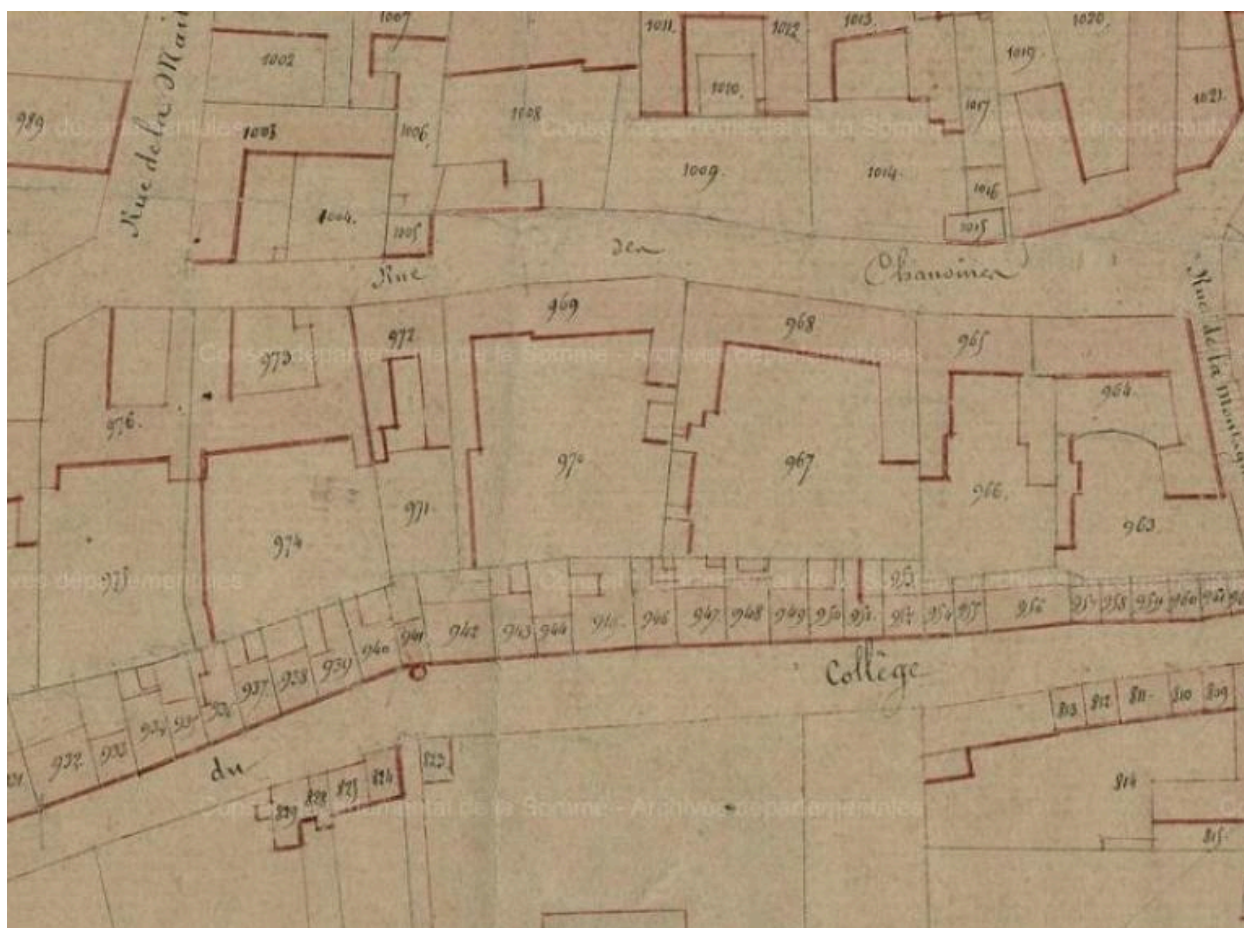
Extrait du cadastre napoléonien. Section B (AD Somme ; 3P 2065/4).