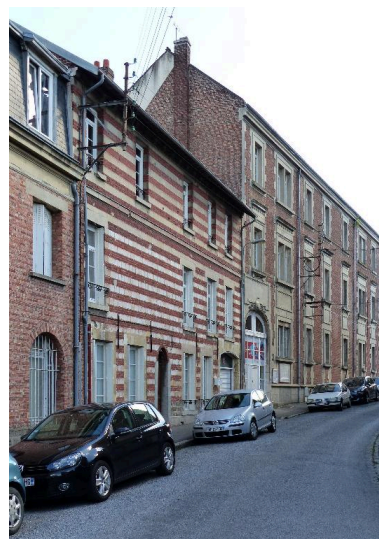
Vue de situation, depuis le nord.