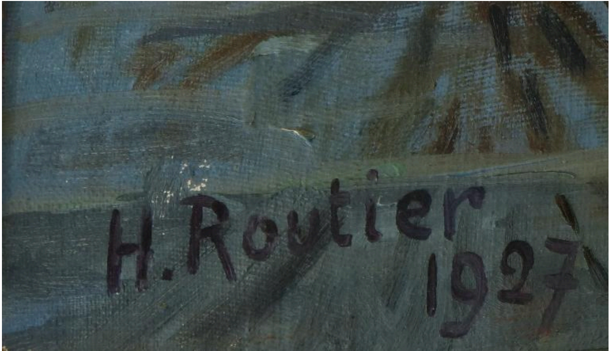
Vue de détail sur la date protégée et la signature.