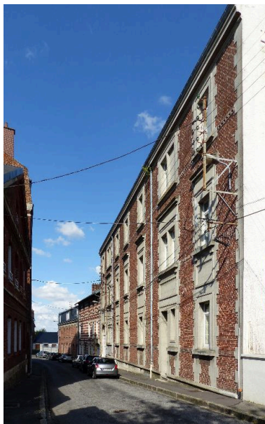
Vue générale depuis le sud. IVR32_20178005225NUCA