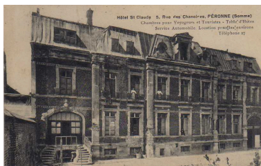
Hôtel Saint-Claude. carte postale (coll. part). IVR32_20178005283NUCA