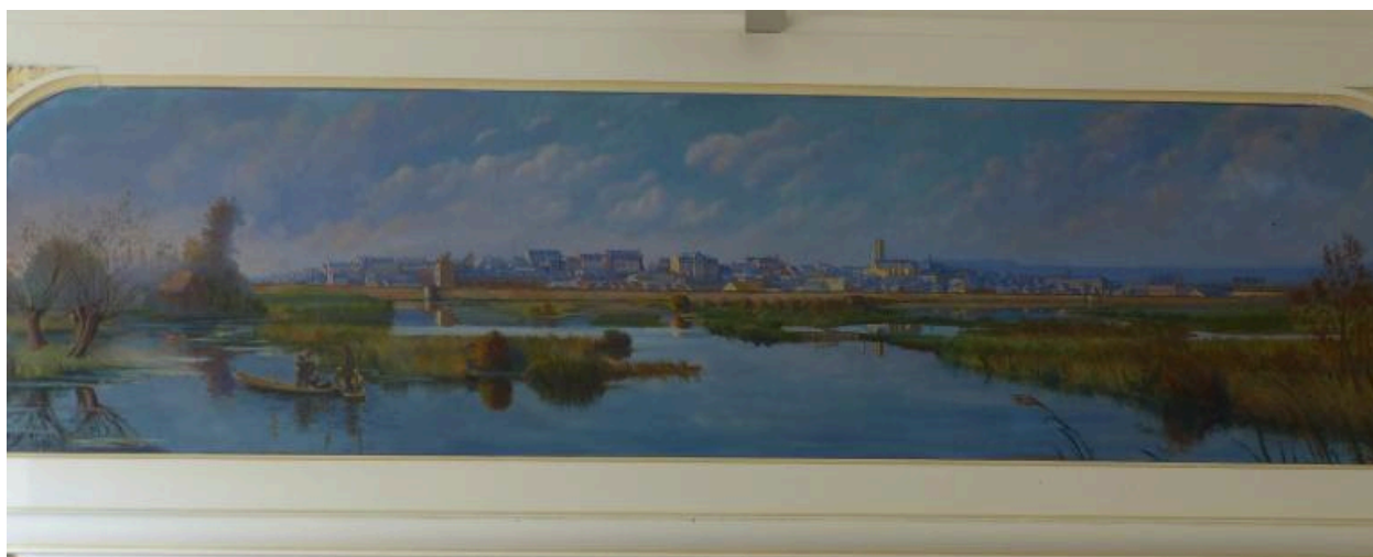
Vue de Péronne à la veille de la première guerre mondiale, peinture d'H. Routier, 1927.