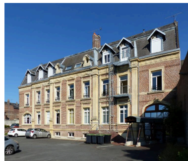
Vue depuis la cour.