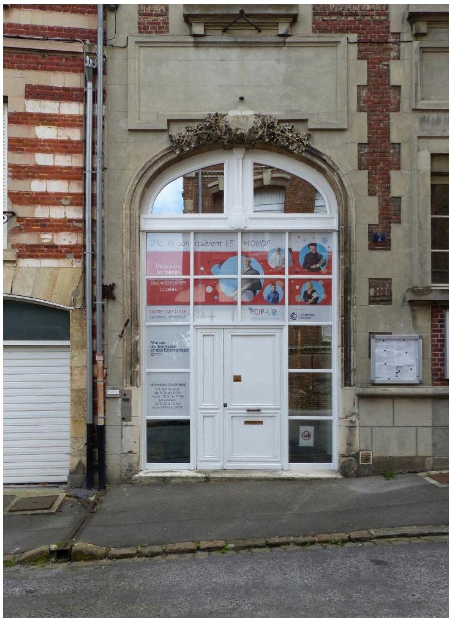
Vue de l'ancienne porte cochère.