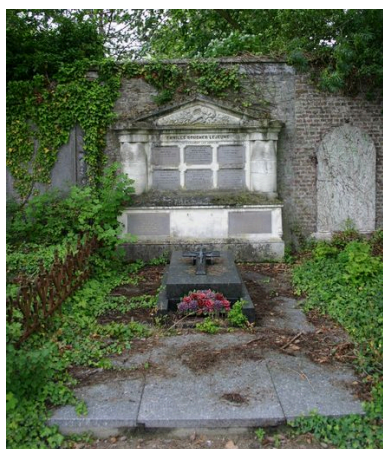
Vue générale. IVR22_20068001103NUCA