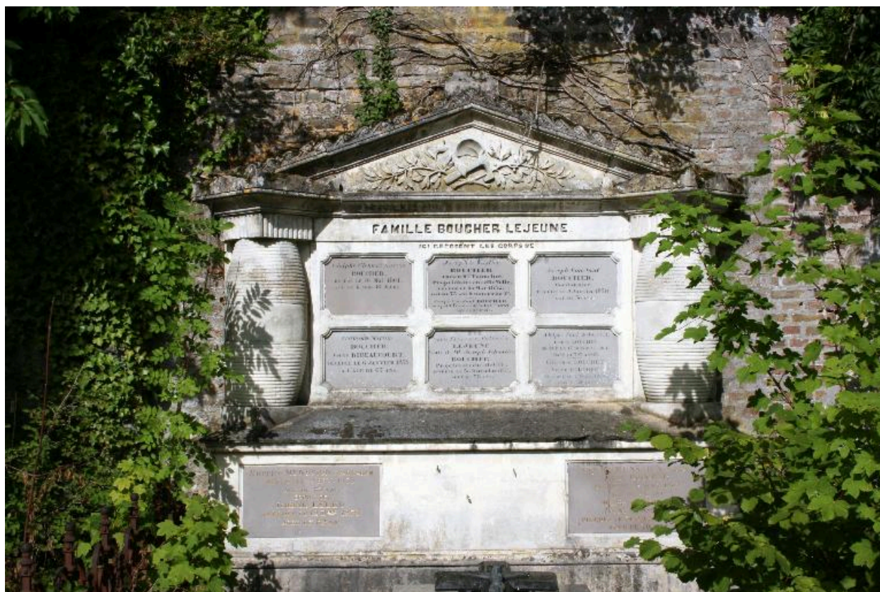
Vue de la stèle.