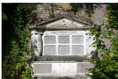
Vue de la stèle. IVR22_20158006323NUCA