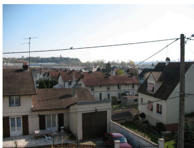
Toits des maisons de la cité Marinoni.