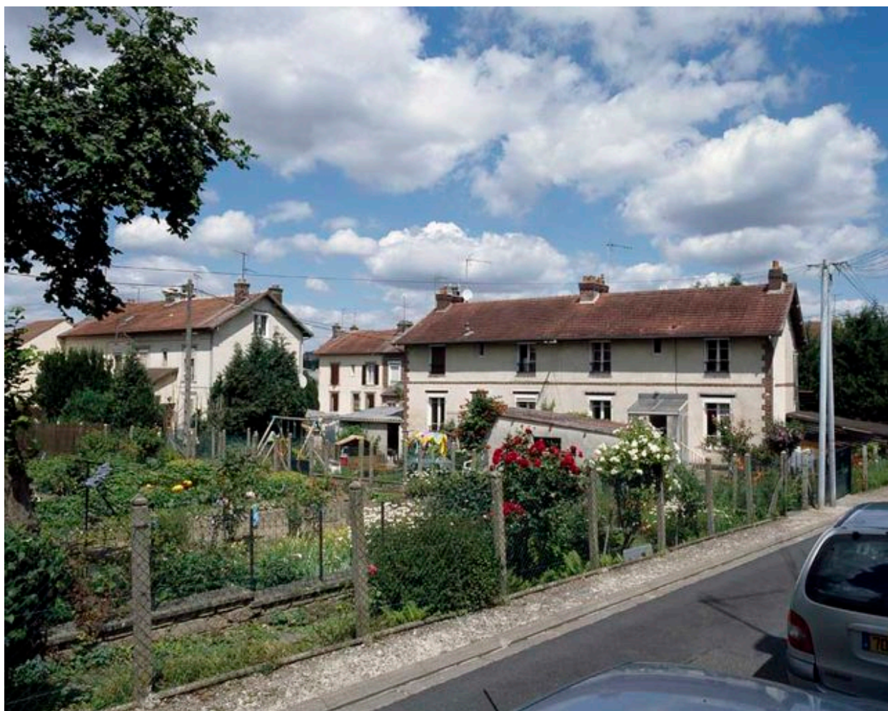
Maison ouvrière de la cité Marinoni.