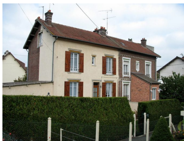
Une maison ouvrière, regroupant 4 logements, construite par les architectes Perret pour la société Marinoni.