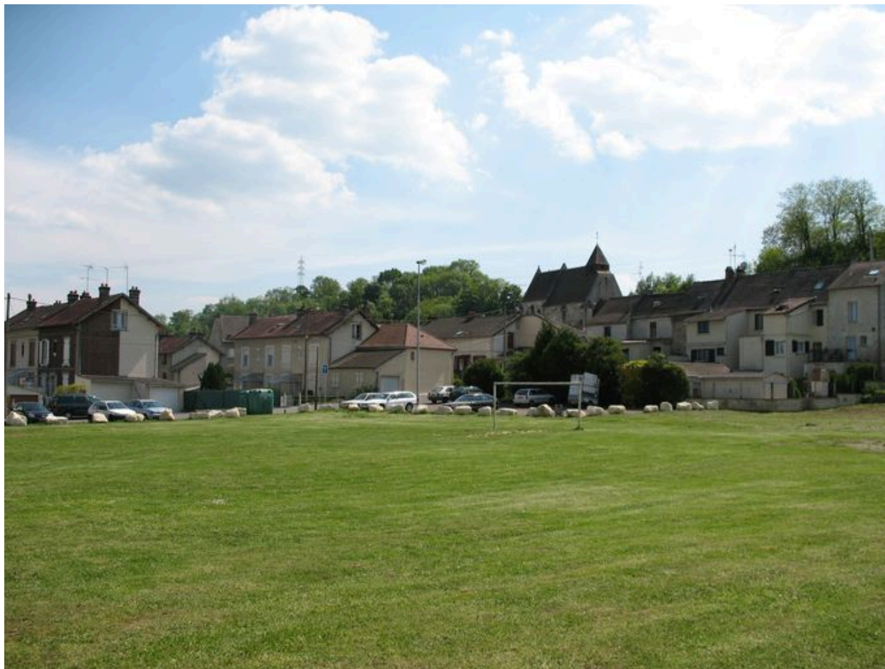
Vue générale de la cité Marinoni.