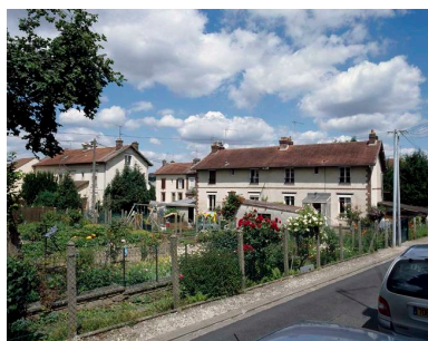
Maison ouvrière de la cité Marinoni. IVR22_20106000759NUCA