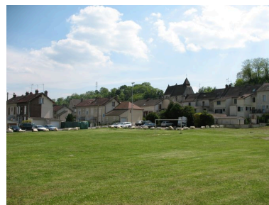
Vue générale de la cité Marinoni.