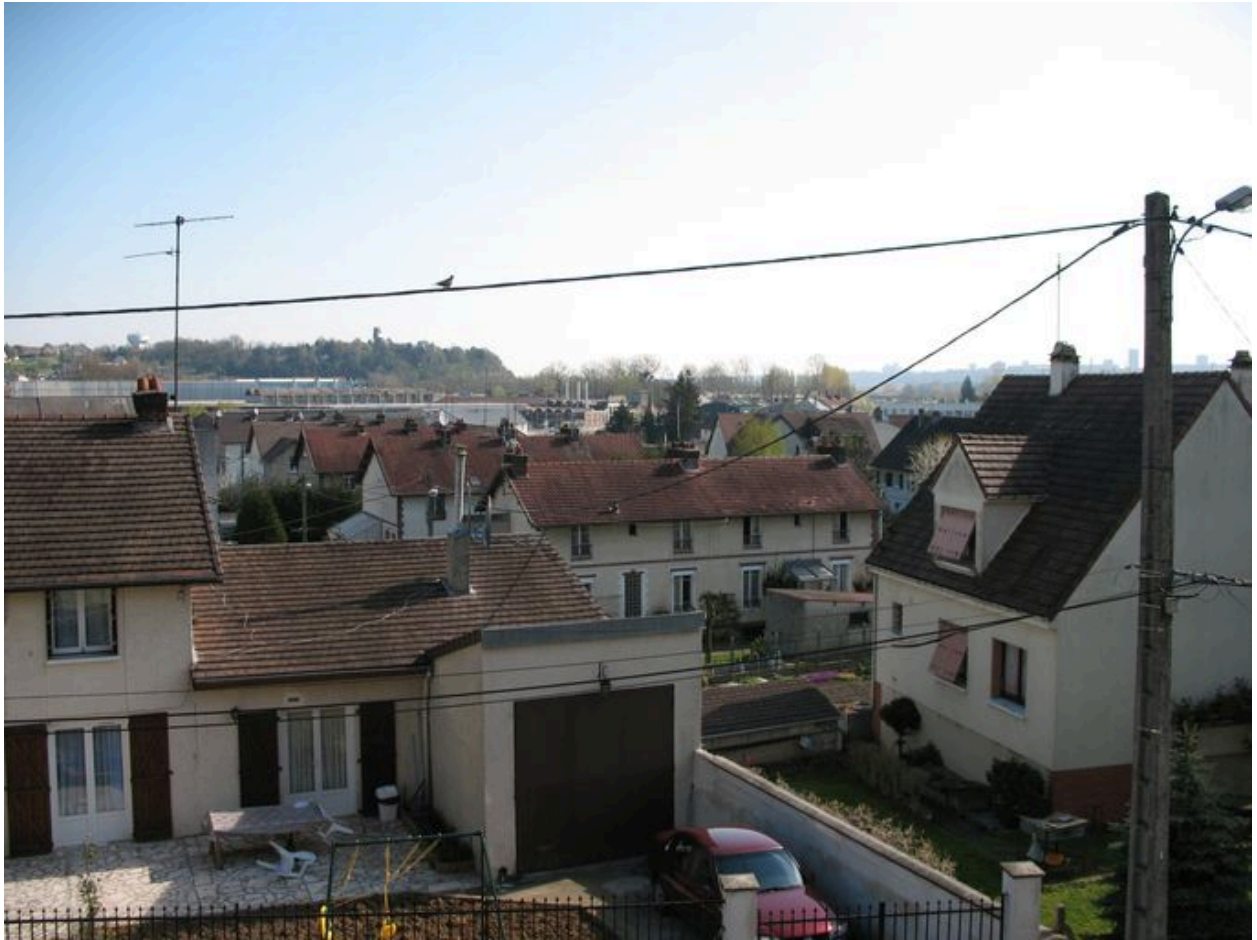
Toits des maisons de la cité Marinoni.