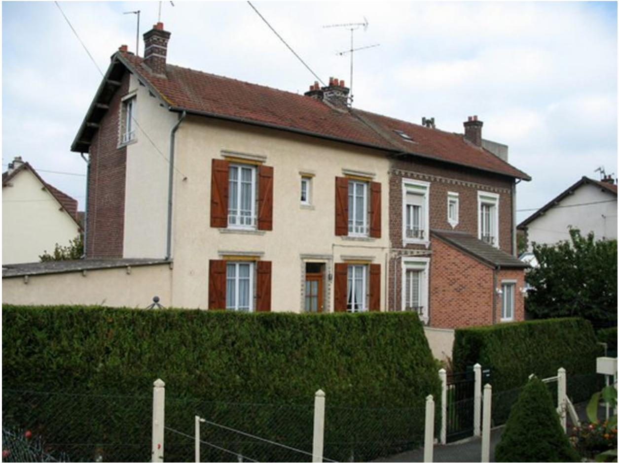
Une maison ouvrière, regroupant 4 logements, construite par les architectes Perret pour la société Marinoni.