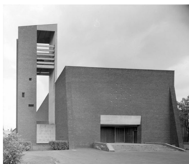
Vue générale depuis l'ouest. IVR22_19968000289V