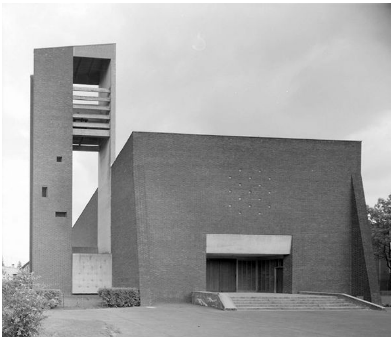
Vue générale depuis l'ouest.