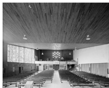
Vue intérieure vers l'ouest. IVR22_19968000290V