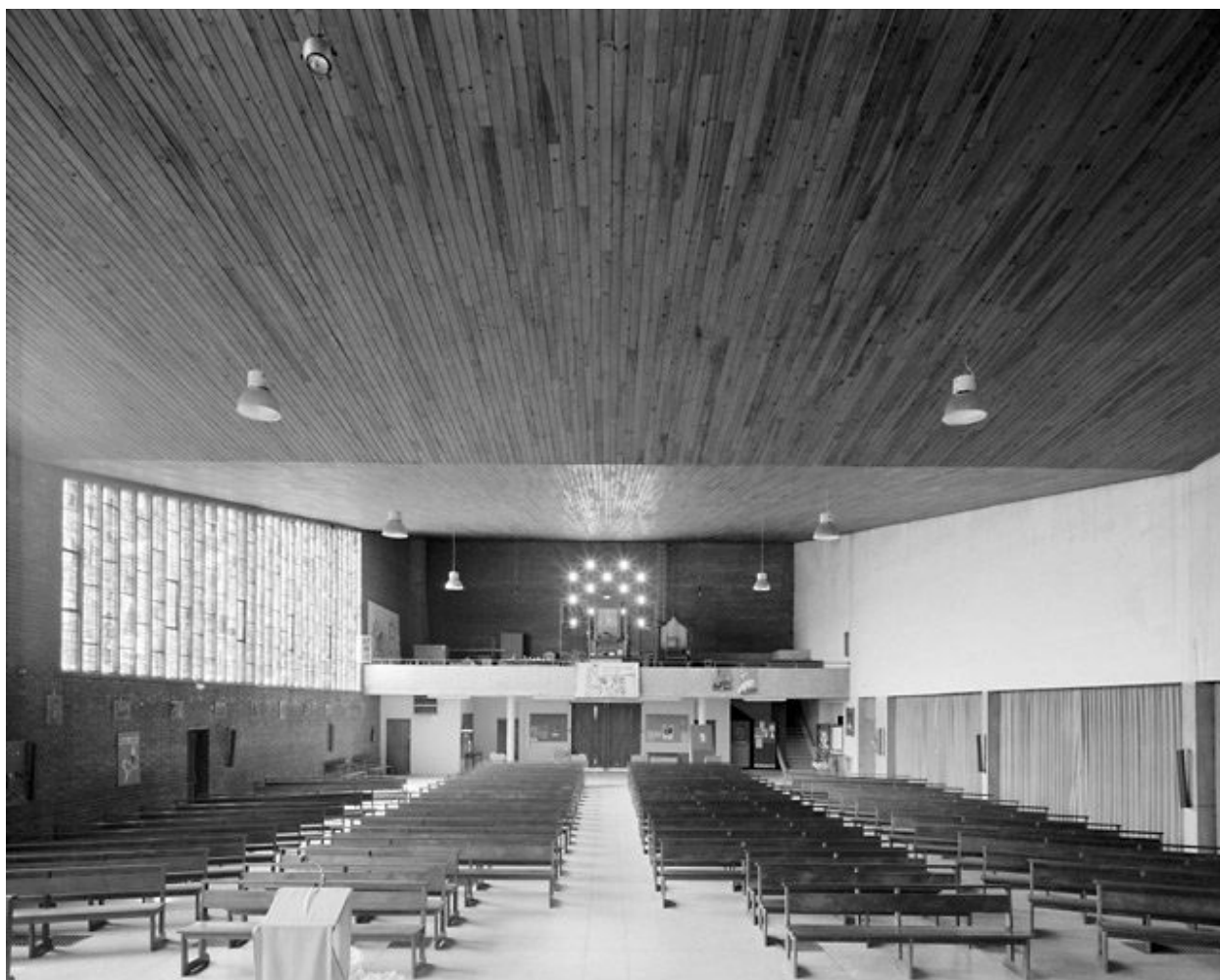
Vue intérieure vers l'ouest.