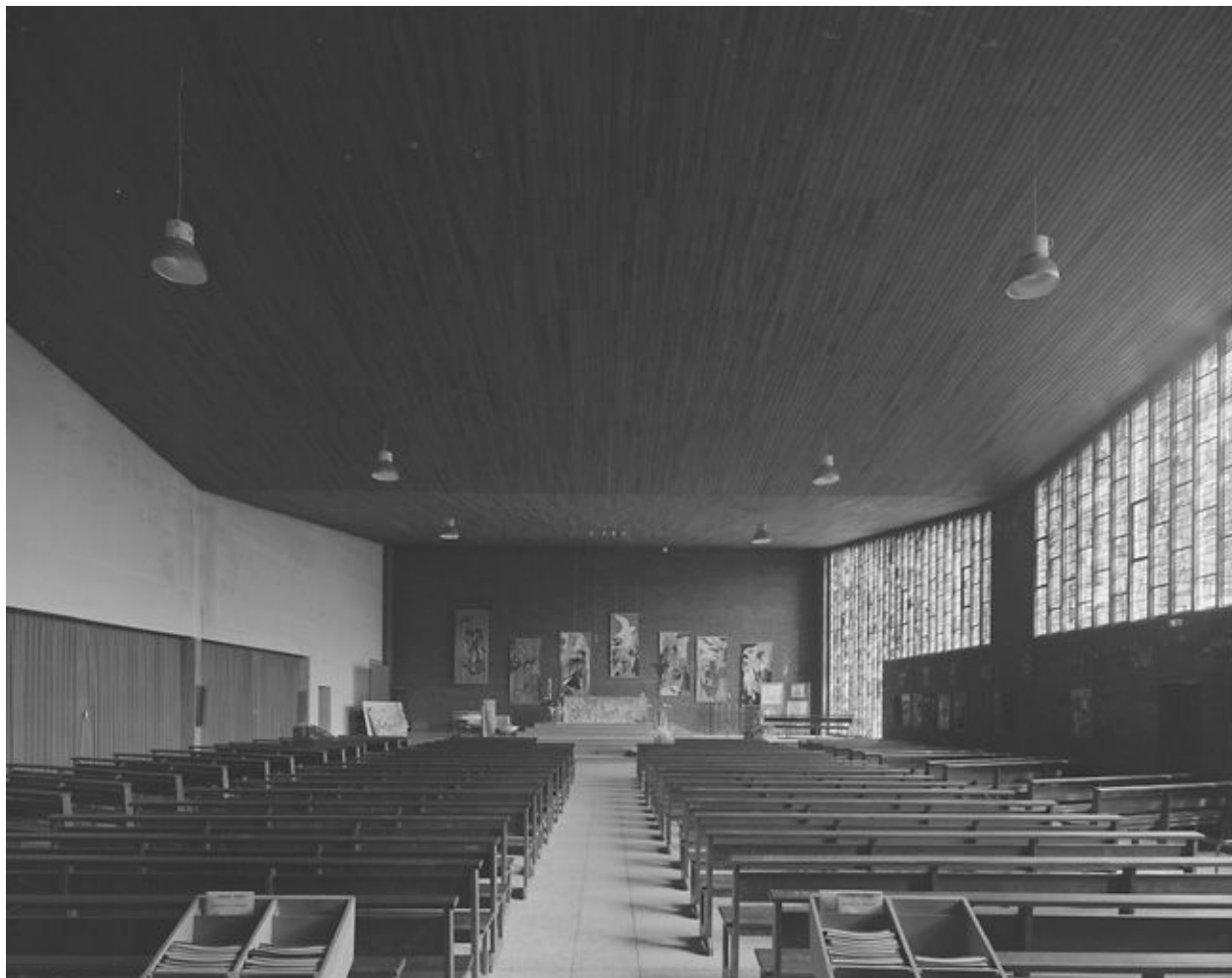
Vue intérieure vers le chœur.