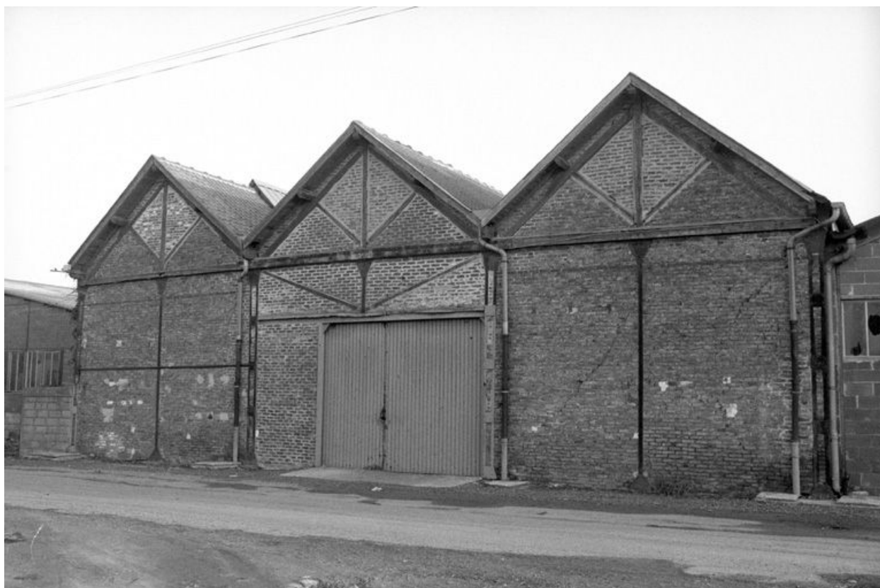
Entrepôt industriel sud, flanc ouest.