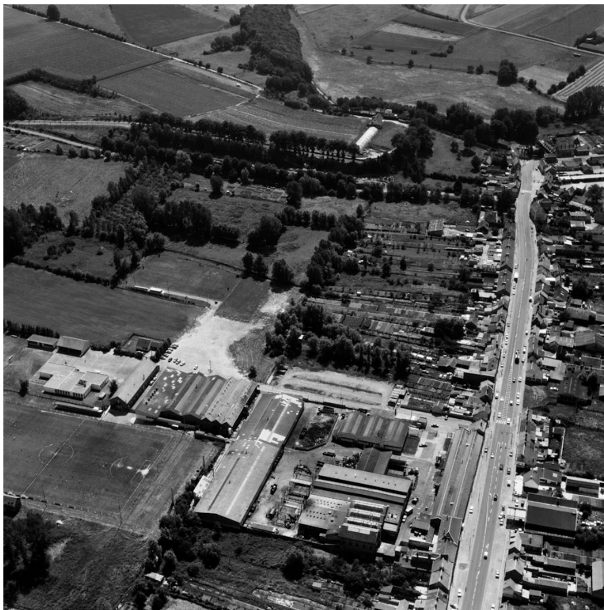
Vue aérienne de 1990, flanc nord-est.