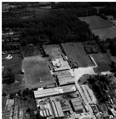
Vue aérienne de 1990. IVR22_19908001651P