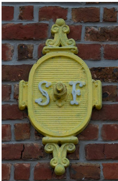
Fer d'ancrage du bâtiment subsistant en fond de parcelle.