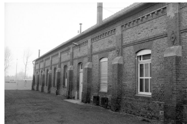
Vue du bâtiment sud. IVR22_19908001481Z