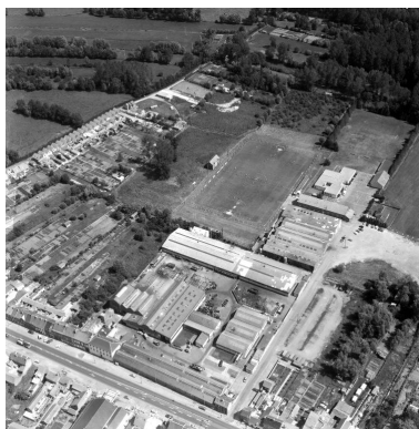
Vue aérienne de 1990, flanc nord-ouest.