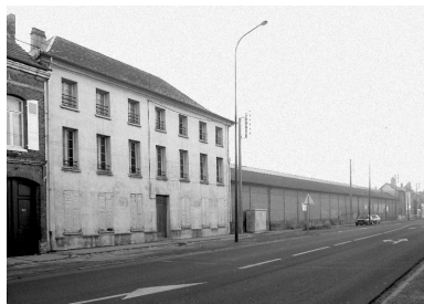
Vue partielle depuis la chaussée de Rouvroy.