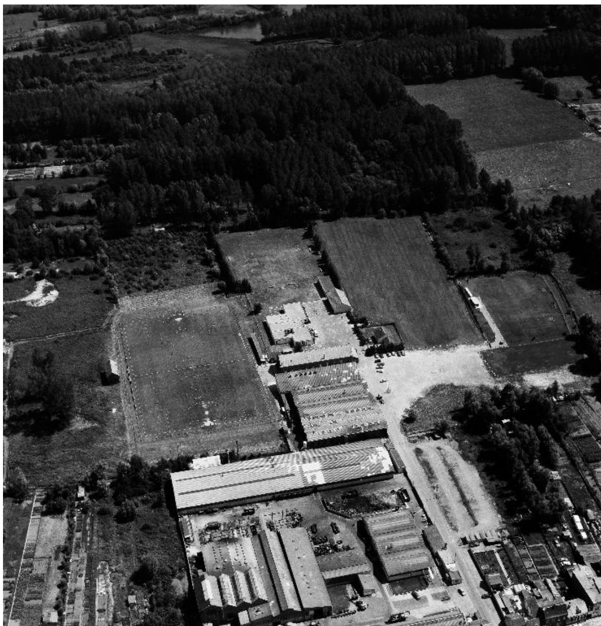
Vue aérienne de 1990.