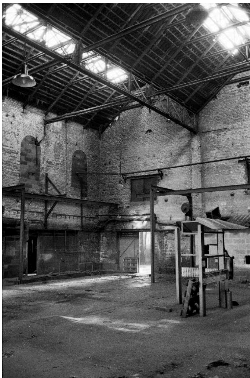
Salle des machines, vue intérieure.