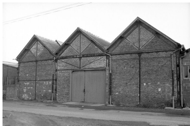
Entrepôt industriel sud, flanc ouest. IVR22_19908001480Z