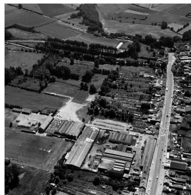
Vue aérienne de 1990, flanc nord-est.