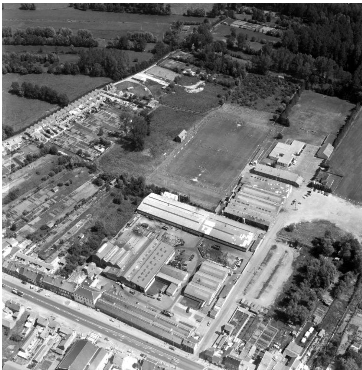
Vue aérienne de 1990, flanc nord-ouest.