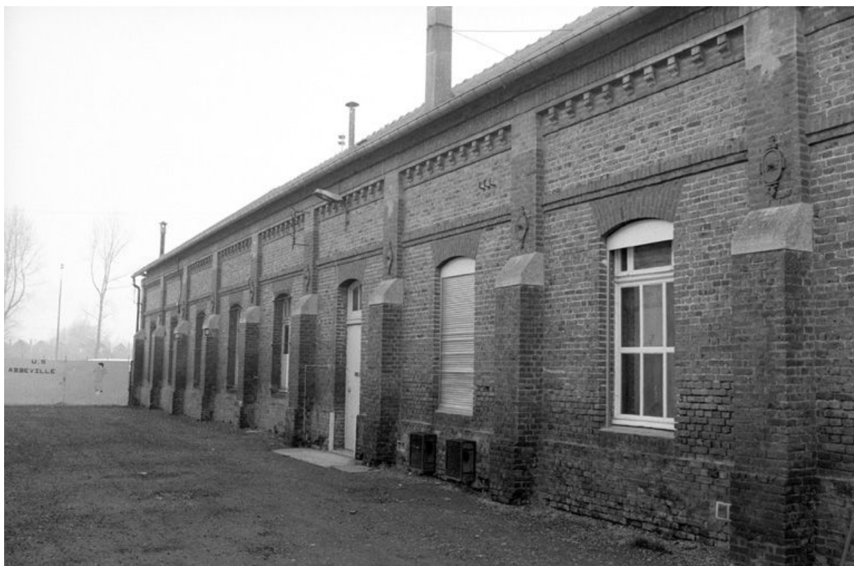
Vue du bâtiment sud.