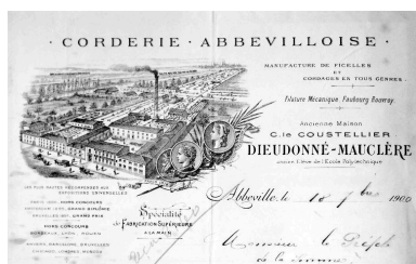
Vue cavalière de la Corderie Abbeilloise, en-tête de papier à lettre, vers 1900 (AD Somme ; M 96855). IVR22_19888001596XB