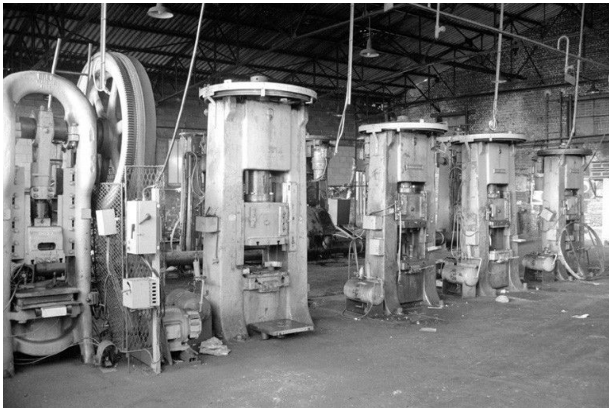
Salle des machines, vue intérieure.