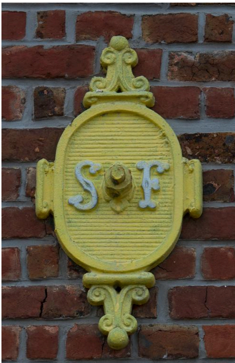
Fer d'ancrage du bâtiment subsistant en fond de parcelle.