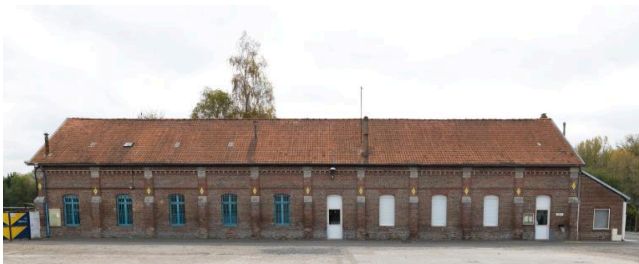
Bâtiment subsistant en fond de parcelle.