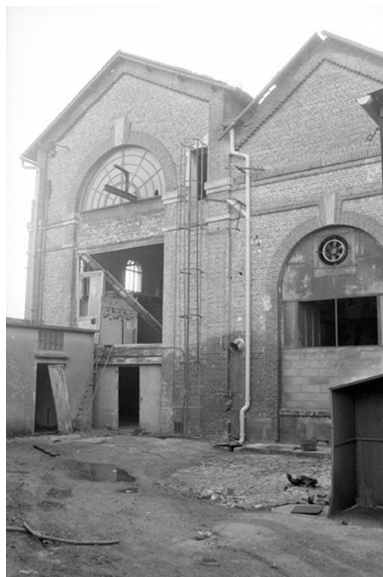
Vue de la façade nord de la salle des machines.