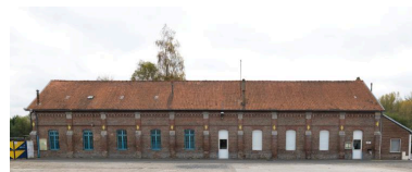
Bâtiment subsistant en fond de parcelle. IVR32_20188000595NUC2A