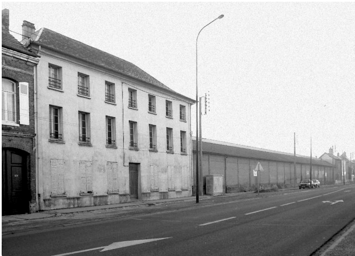
Vue partielle depuis la chaussée de Rouvroy.