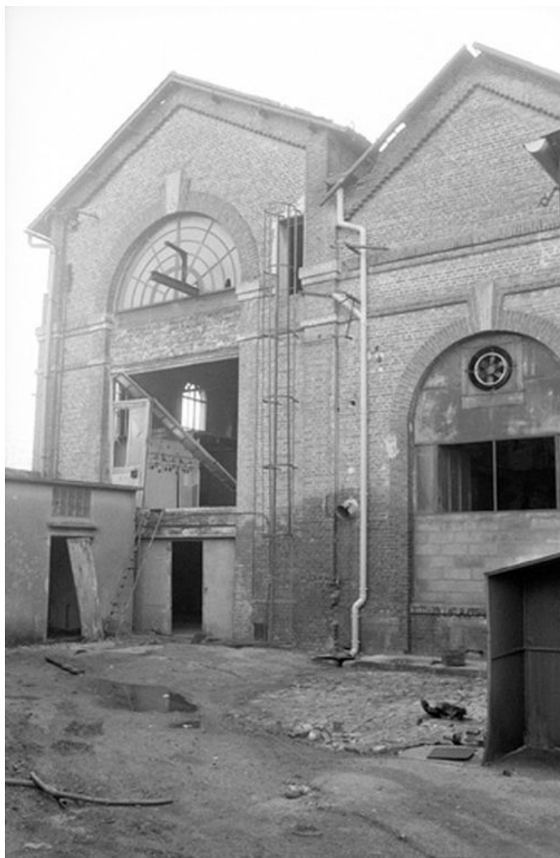
Vue de la façade nord de la salle des machines.