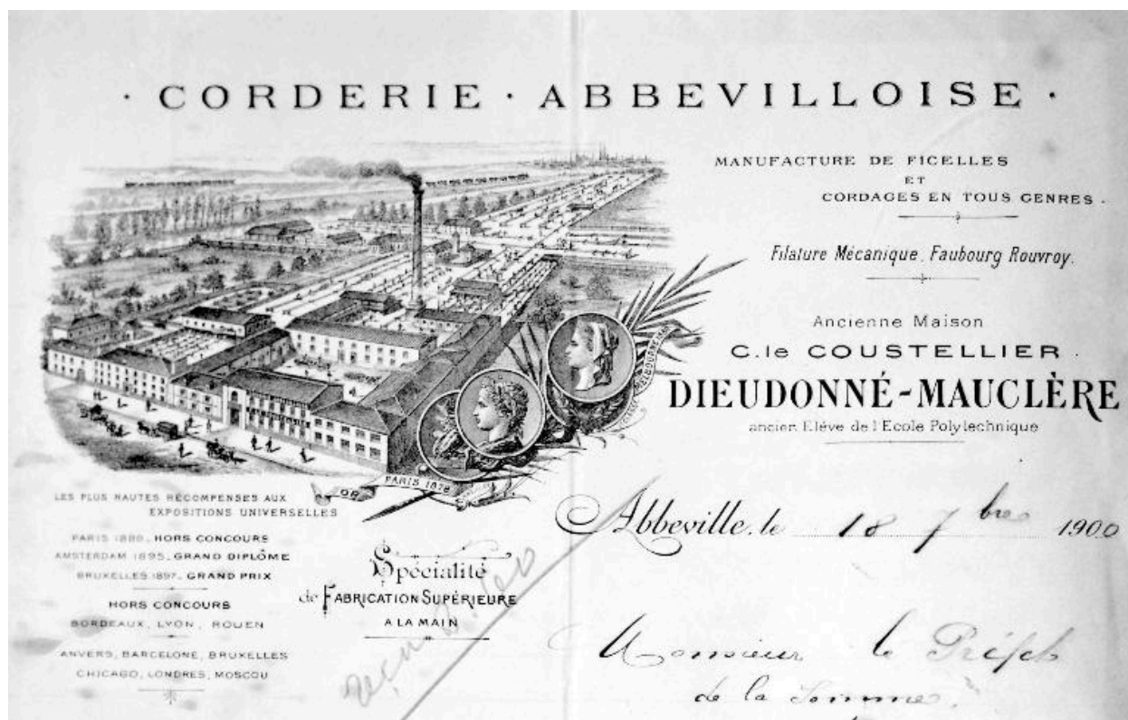
Vue cavalière de la Corderie Abbeilloise, en-tête de papier à lettre, vers 1900 (AD Somme ; M 96855).