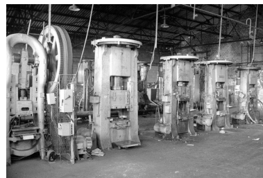
Salle des machines, vue intérieure.