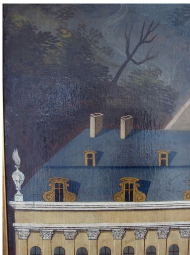
Vue de détail, toit IVR31_20106201759NUCA