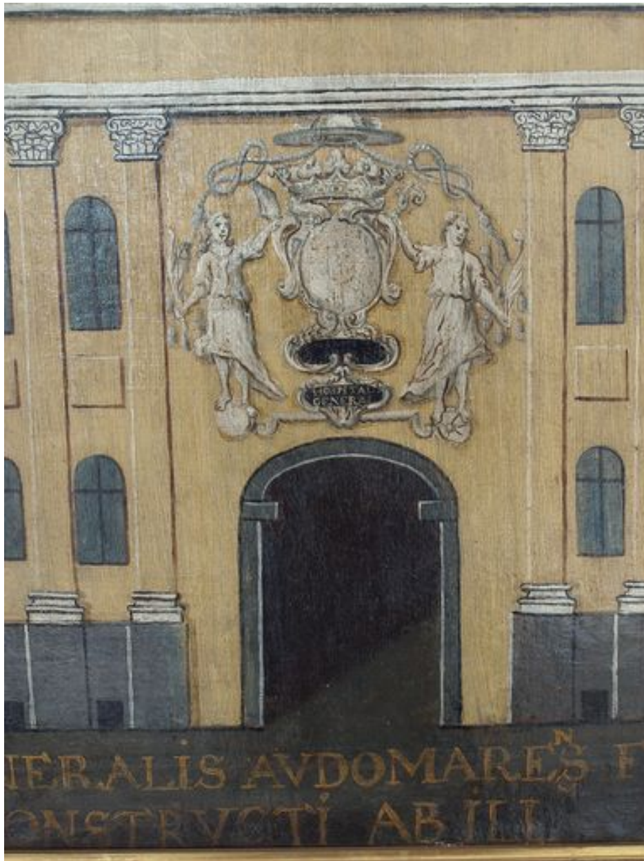
Vue de détail, entrée armoiriée