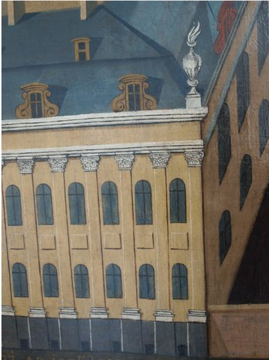
Vue de détail, bâtiment