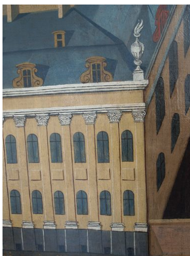
Vue de détail, bâtiment