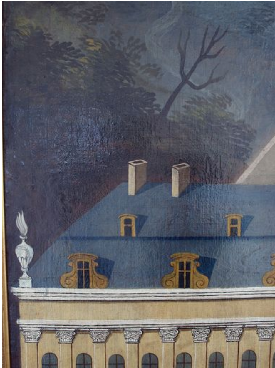
Vue de détail, toit