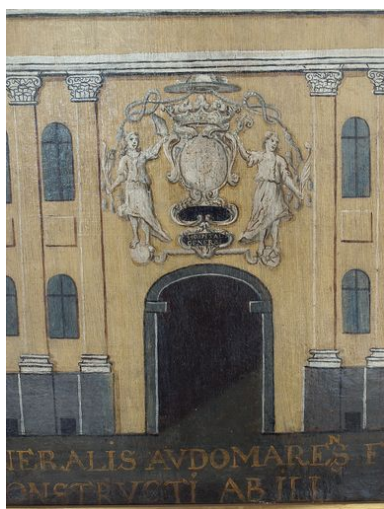
Vue de détail, entrée armoiriée IVR31_20106201756NUCA