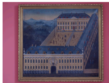
Vue générale IVR31_20106201755NUCA