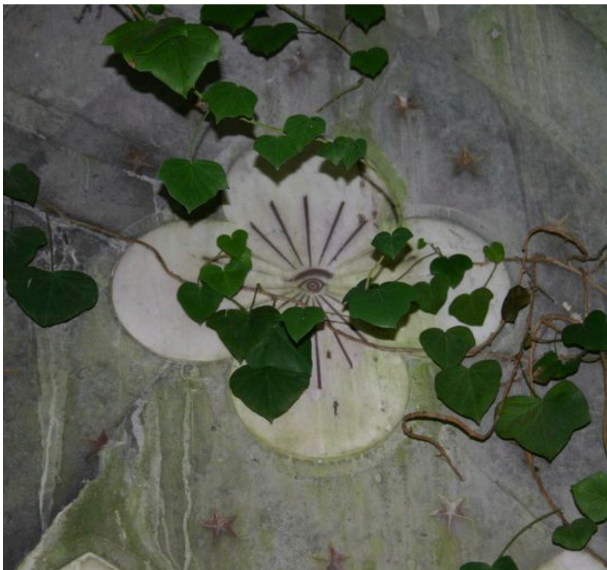
Détail du quadrilobe, ornant le mur postérieur du tombeau.