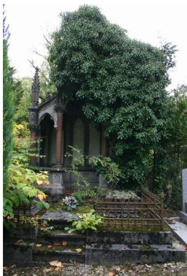
Vue générale. IVR22_20098001626NUCA