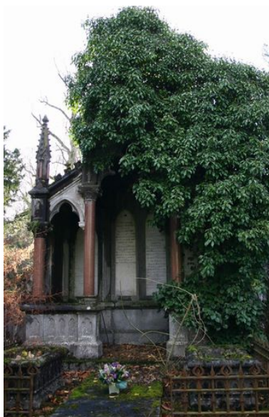
Tombeau en forme de niche monumentale, de style néogothique. IVR22_20098001627NUCA