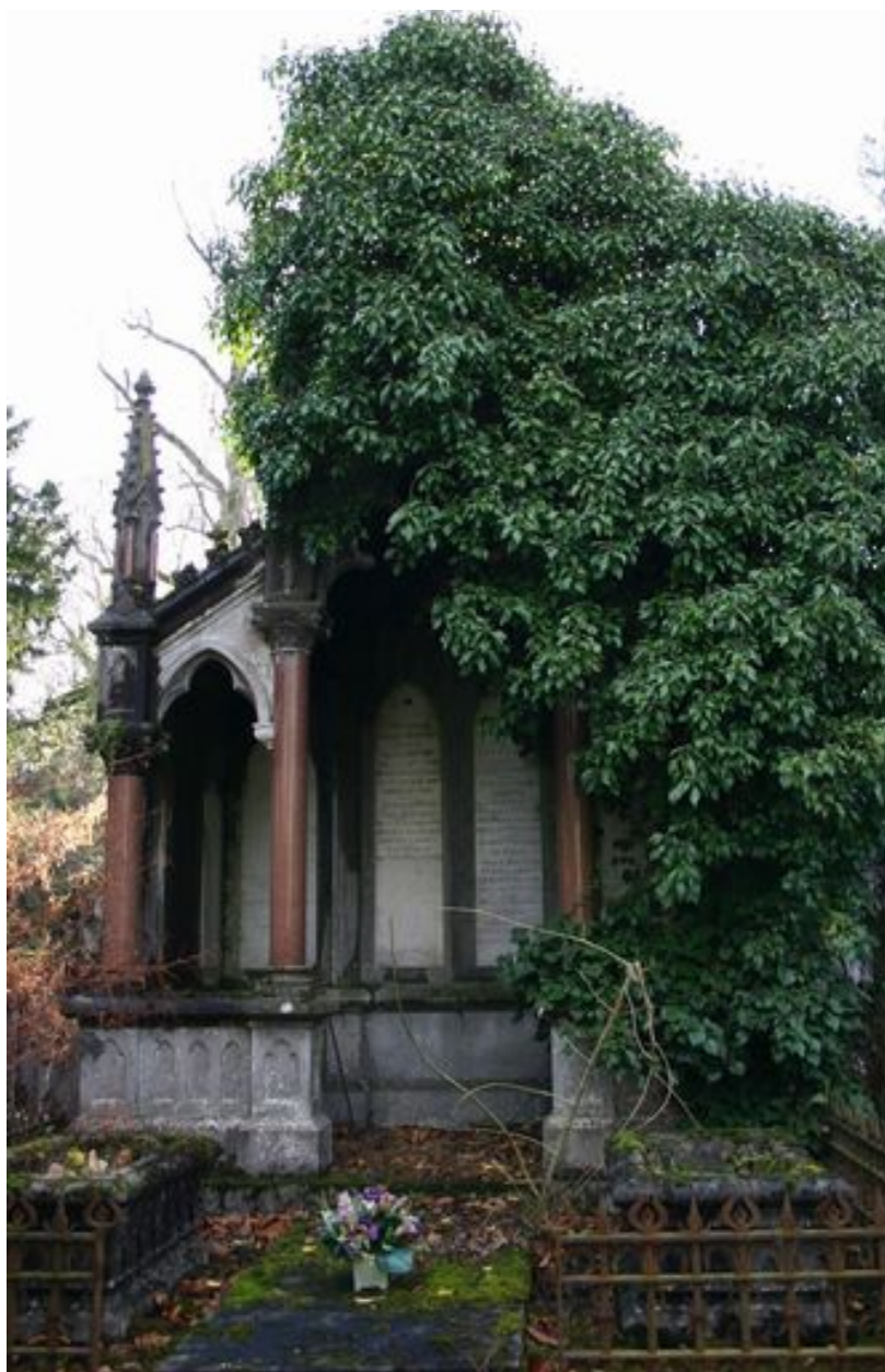
Tombeau en forme de niche monumentale, de style néogothique.