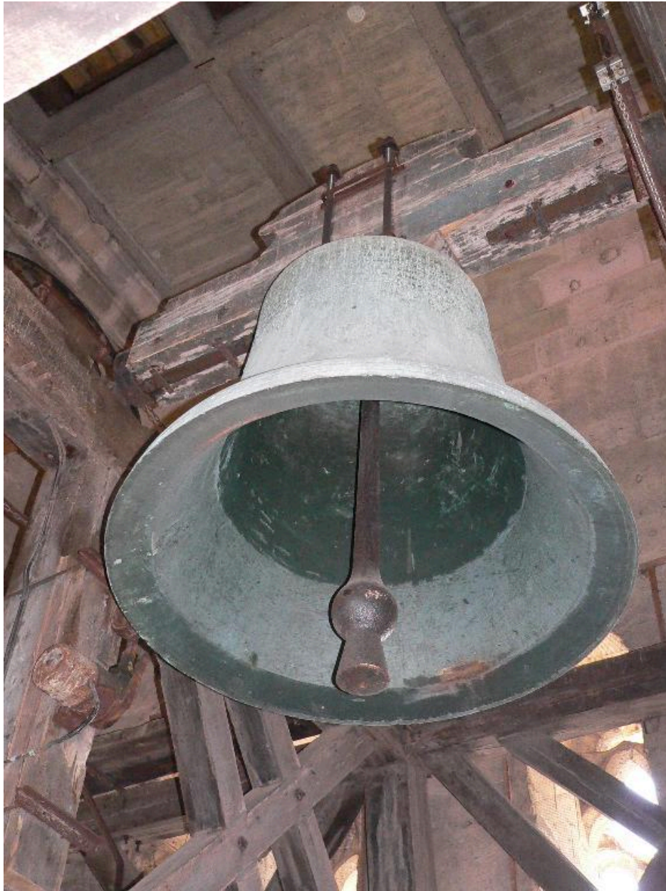
Vue du bourdon Julie-Paule-Simone.