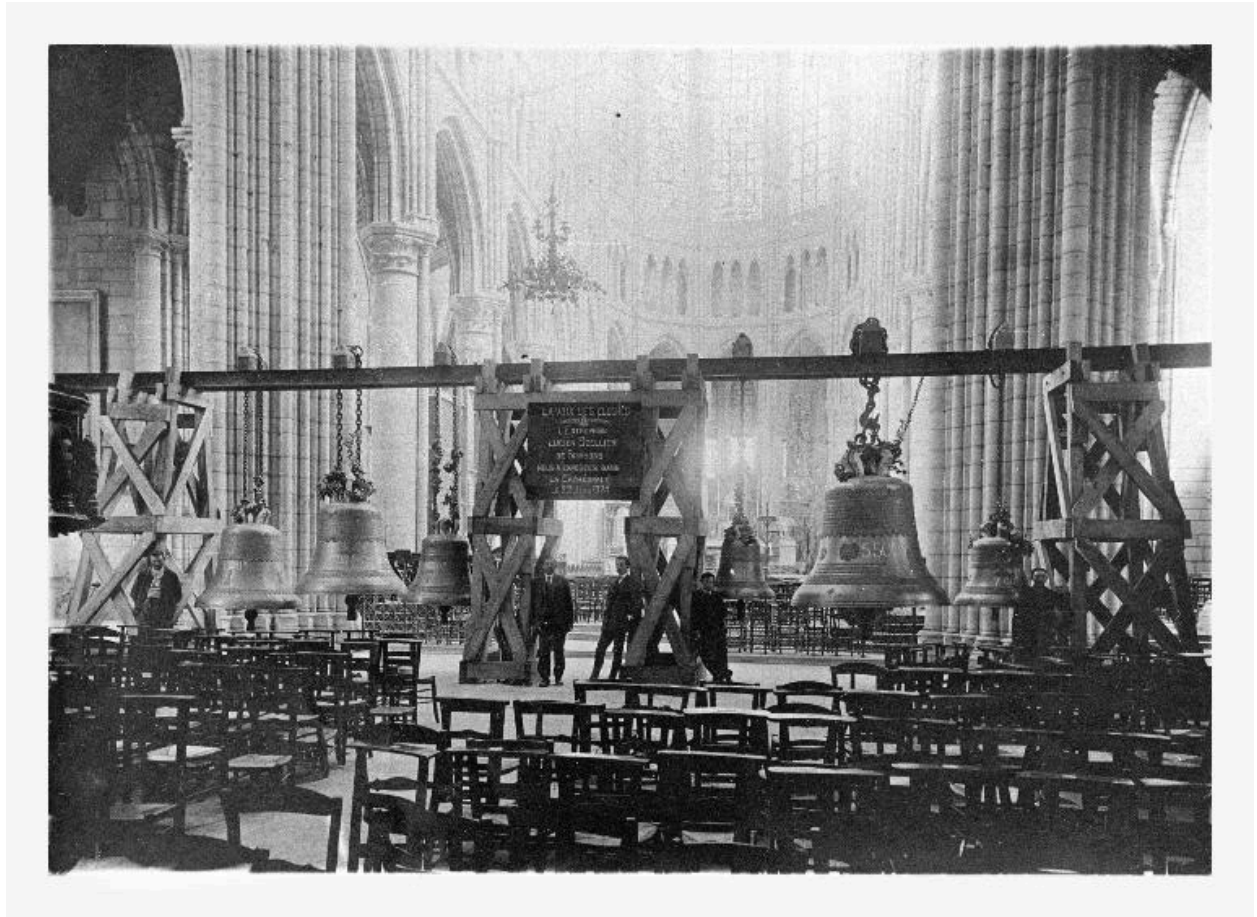
Photographie des six cloches (Marie-Henriette-Amérique-France-Victoire, Gervaise, Crépine, Crépinienne, Sixtine et Juliette) fondues en 1924 par Armand Blanchet, suspendues dans la cathédrale pour leur baptême le 22 juin 1924.