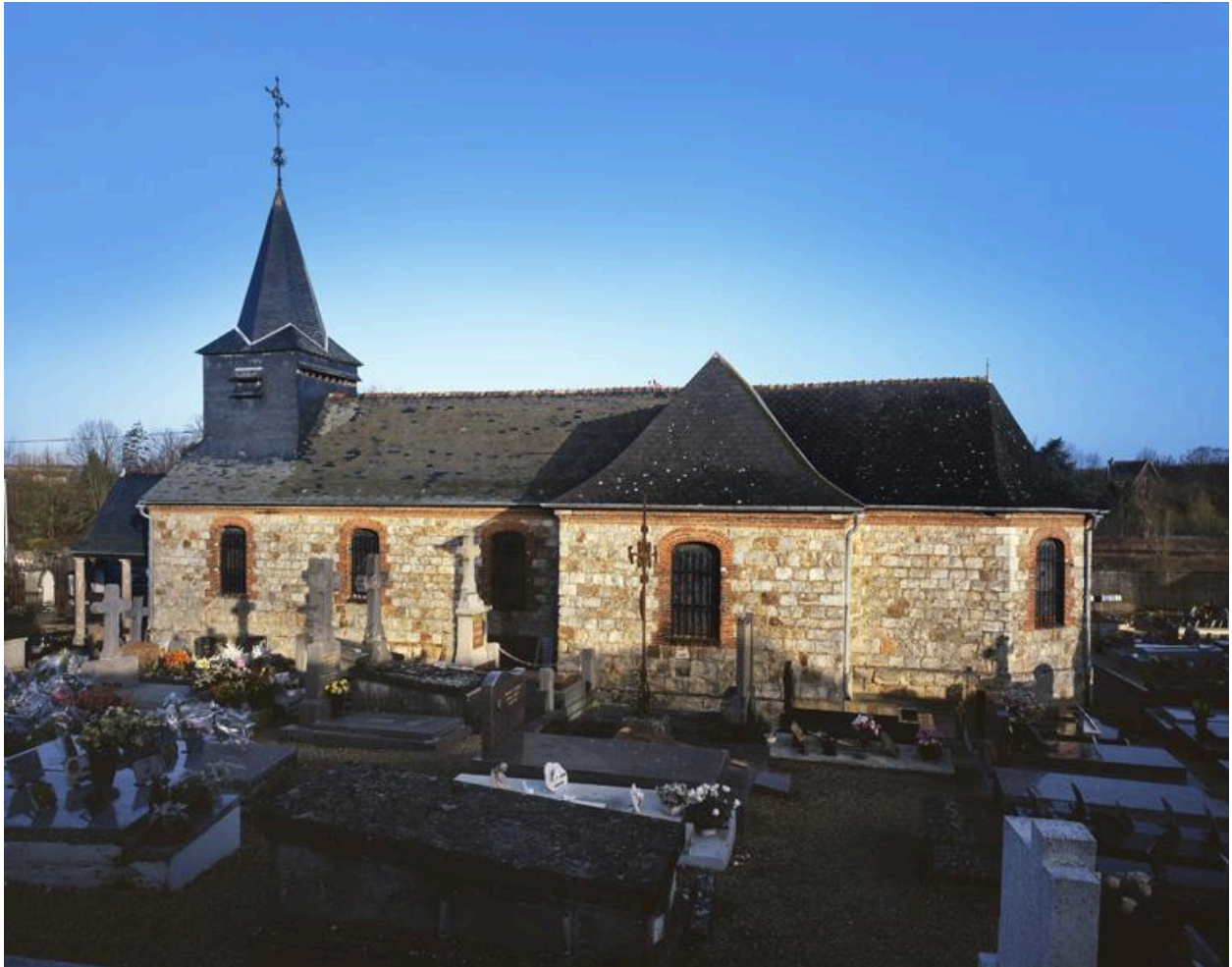
Vue de l'élévation sud.