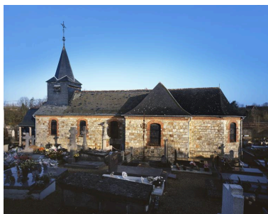
Vue de l'élévation sud. IVR22_20000200758VA