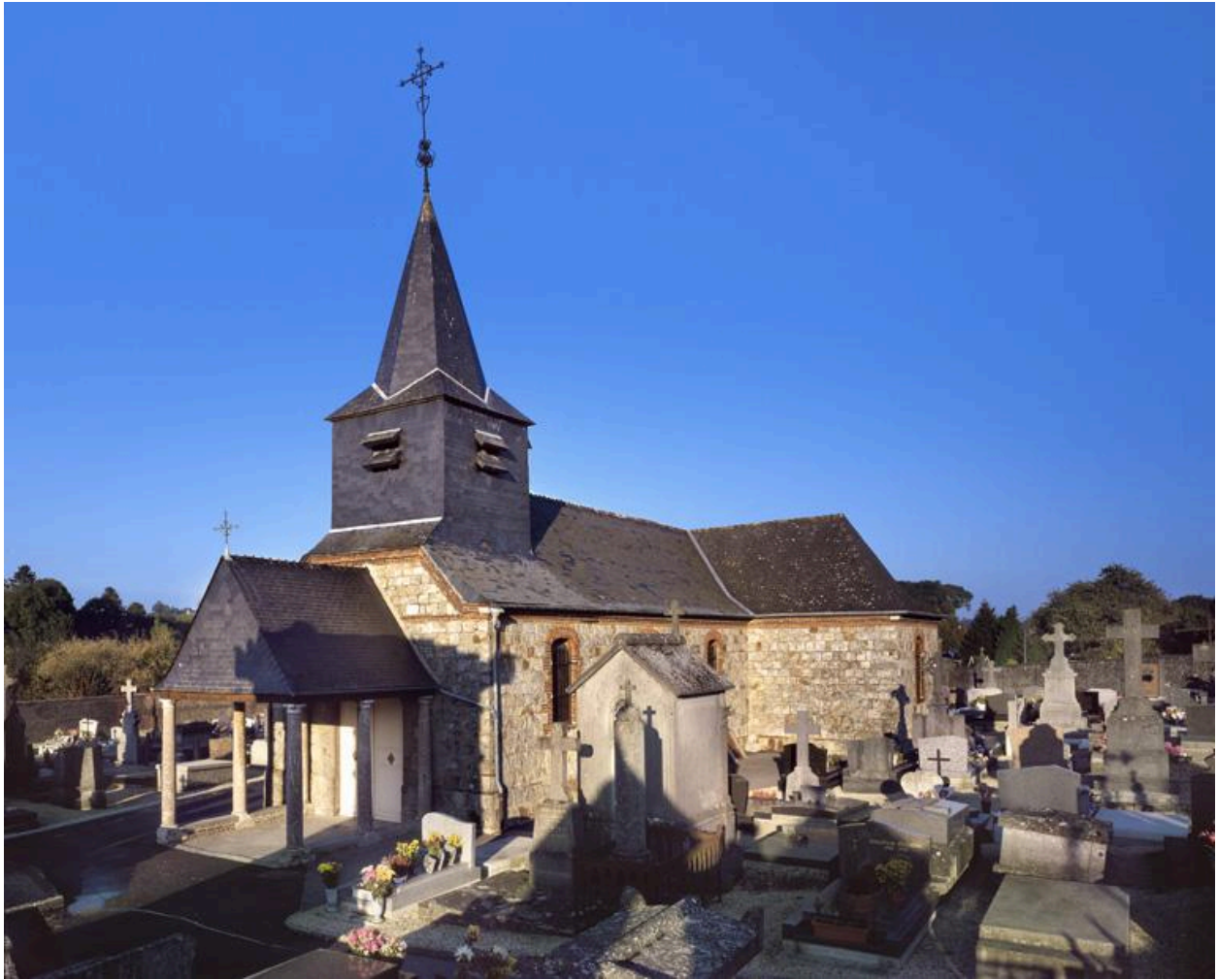
Vue générale de la chapelle, depuis l'Ouest.