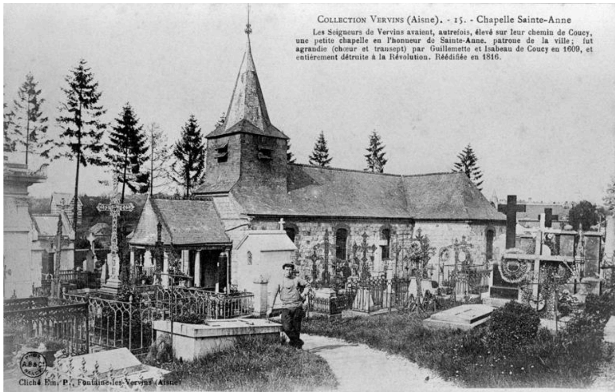
Vue générale de la chapelle, depuis l'ouest, avec le cimetière.