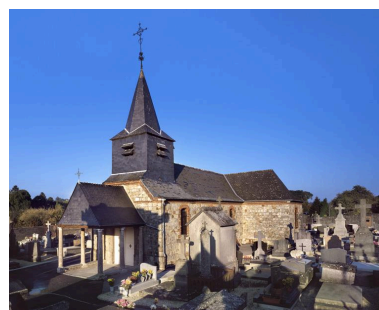
Vue générale de la chapelle, depuis l'Ouest.