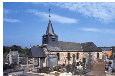
Vue d'un côté, et du porche. IVR22_19980205529ZA