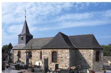
Vue latérale.