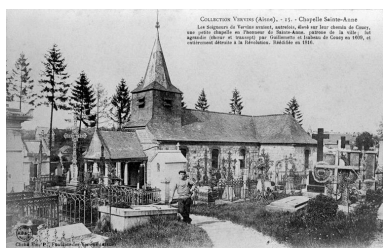
Vue générale de la chapelle, depuis l'ouest, avec le cimetière.