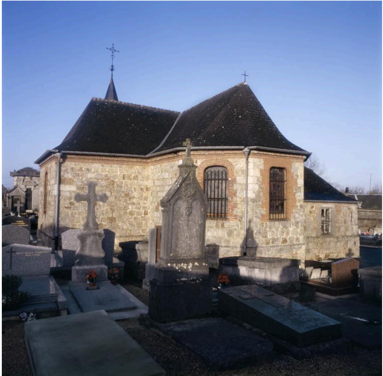
Vue du chevet.