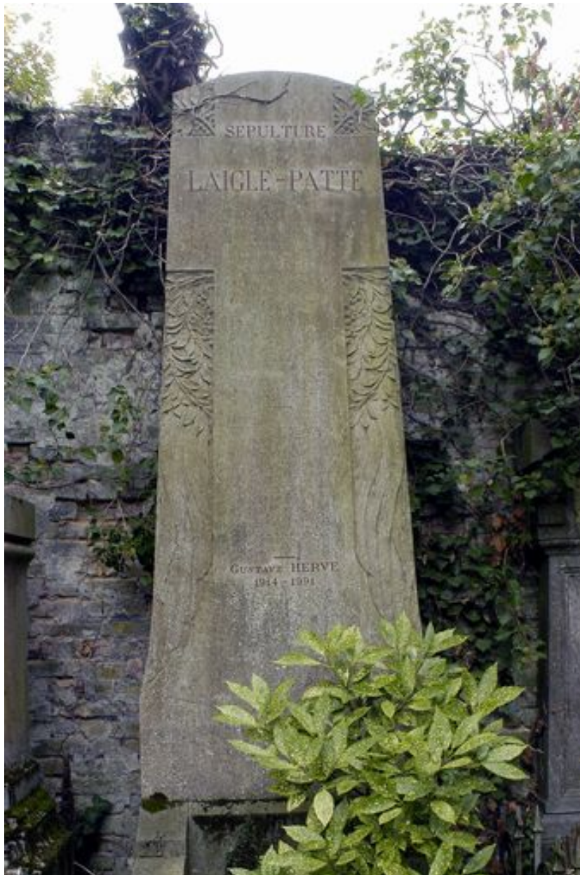
Vue de la stèle.