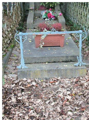
Vue du porte-couronne antérieur. IVR22_20048001328NUCA