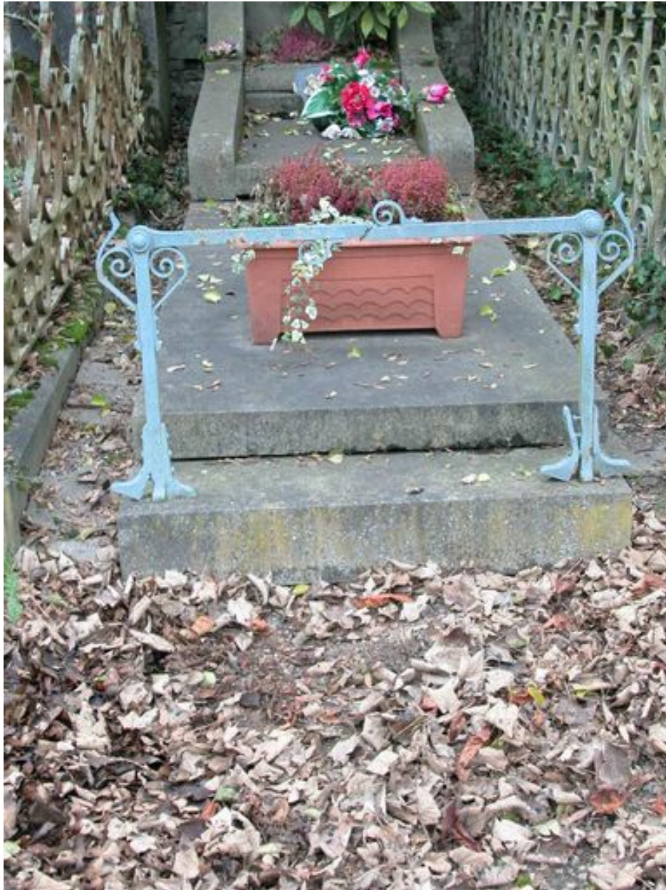
Vue du porte-couronne antérieur.