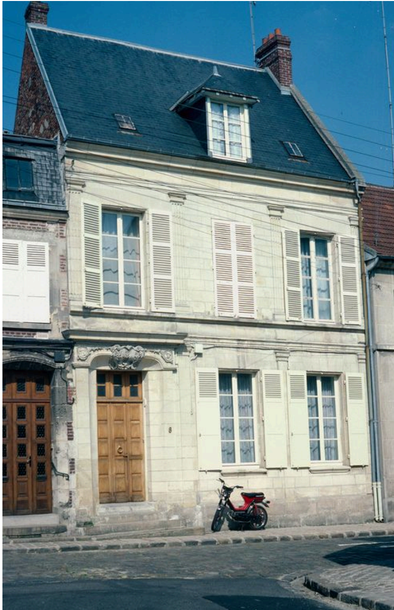
Elévation sur rue, de léger trois-quarts.