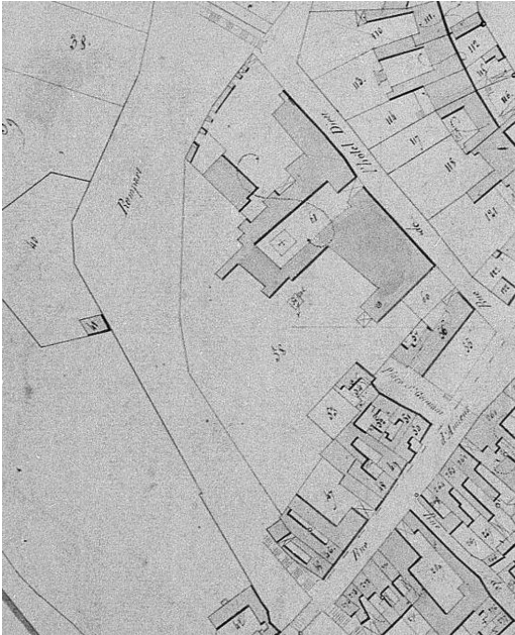
Extrait du cadastre napoléonien (DGI).