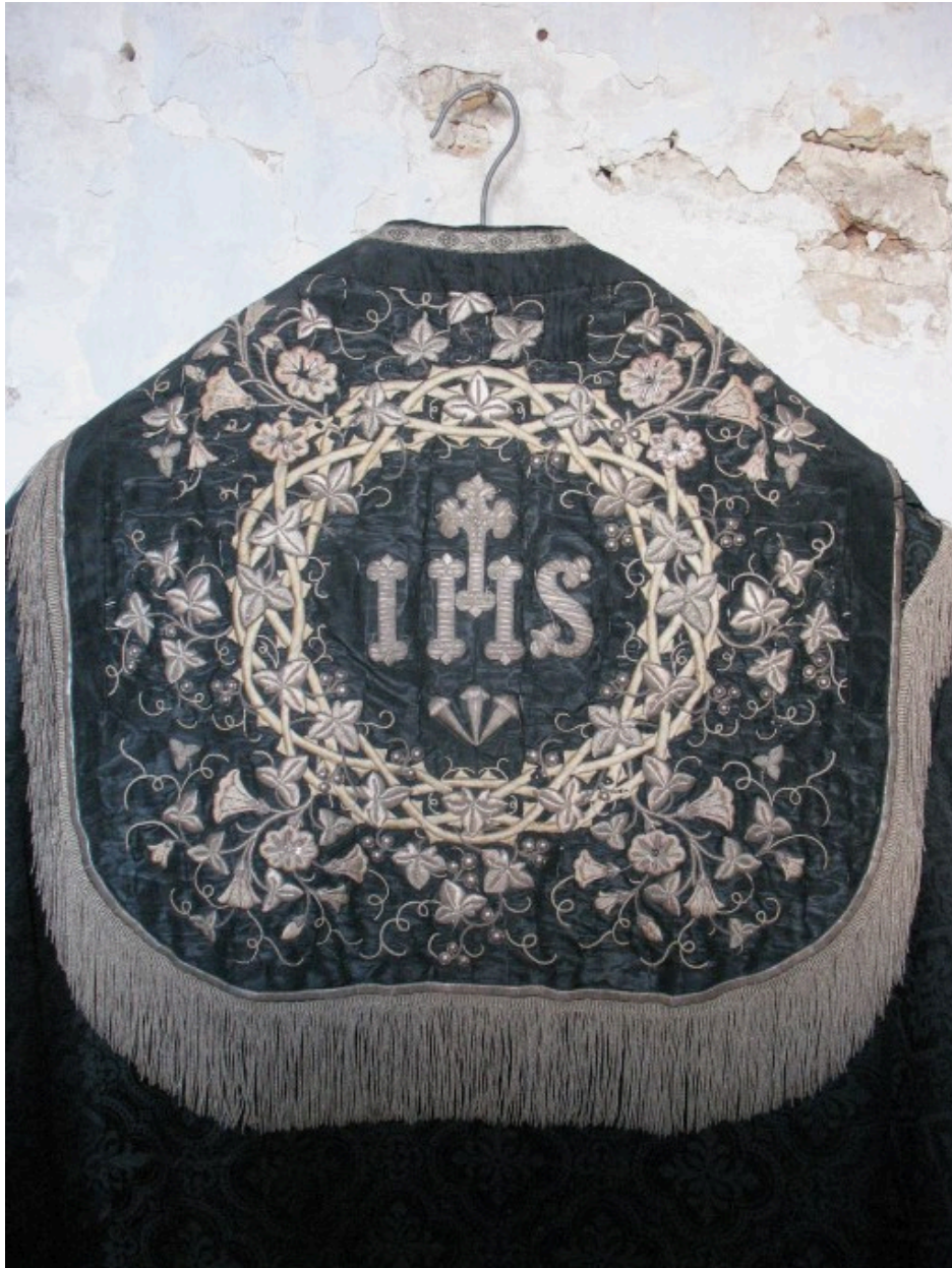
Vue de détail : chaperon