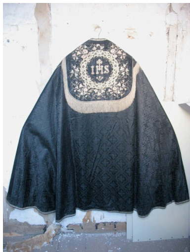
Vue générale : dos IVR31_20106204114NUCA