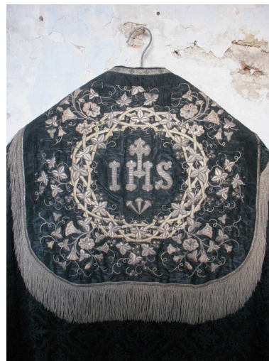
Vue de détail : chaperon IVR31_20106204116NUCA