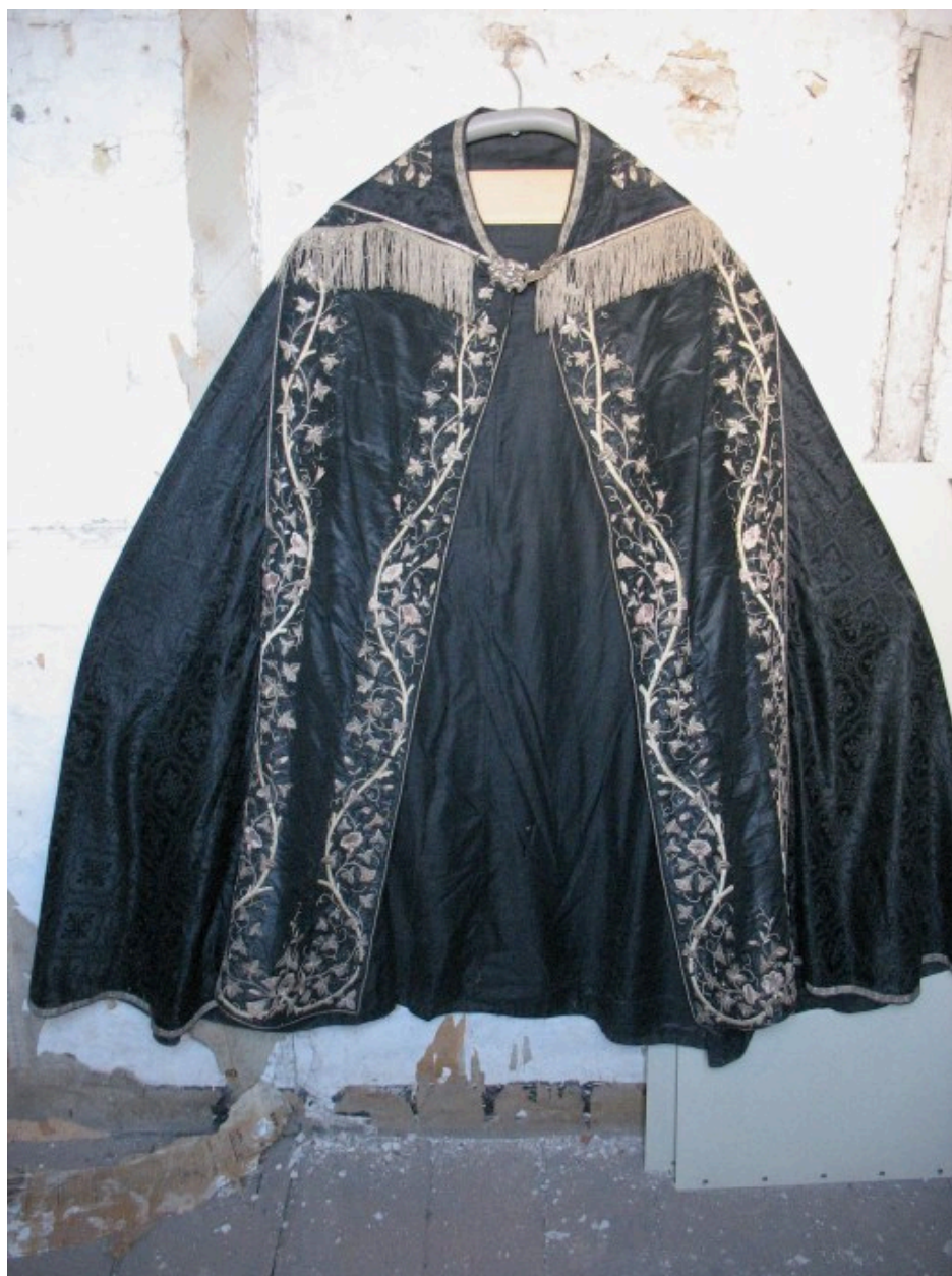
Vue générale : devant