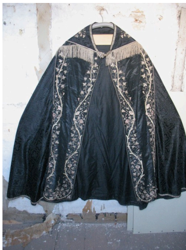
Vue générale : devant IVR31_20106204113NUCA