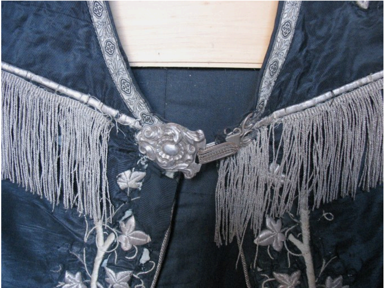
Vue de détail : fermail