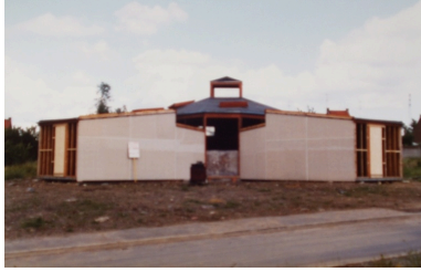
Vue générale IVR31_20055907199NUC