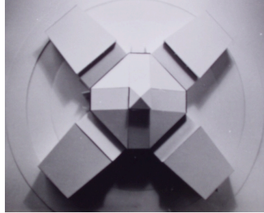
Maquette de la chapelle IVR31_20055907200NUC