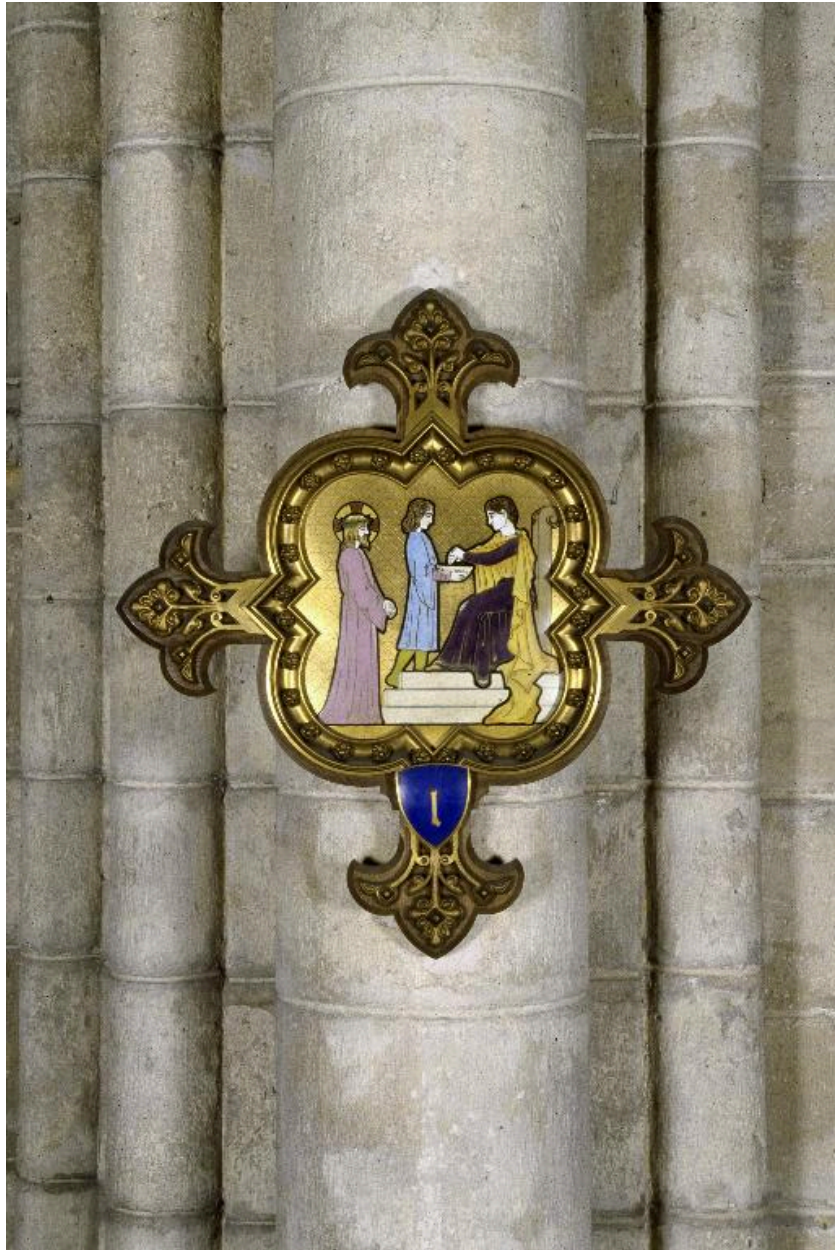
Vue de la 1ère station : Jésus est condamné à mort.