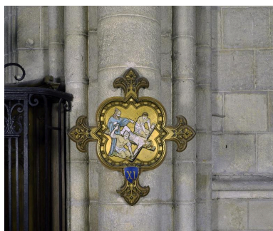
Vue de la 11e station : Jésus est cloué sur la croix.