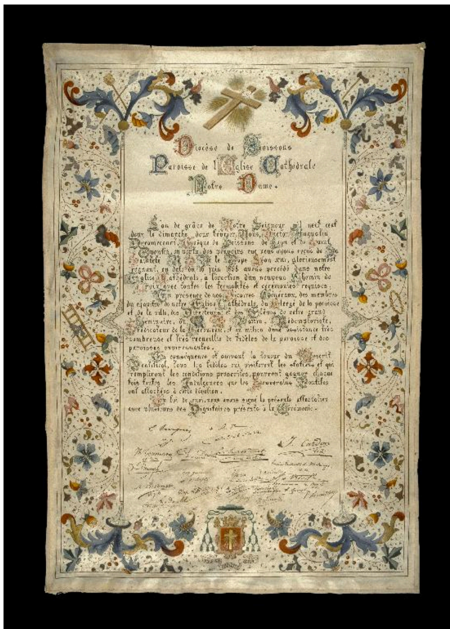
Procès-verbal de l'érection du chemin de croix le 2 février 1902 (A Évêché Soissons : non coté).