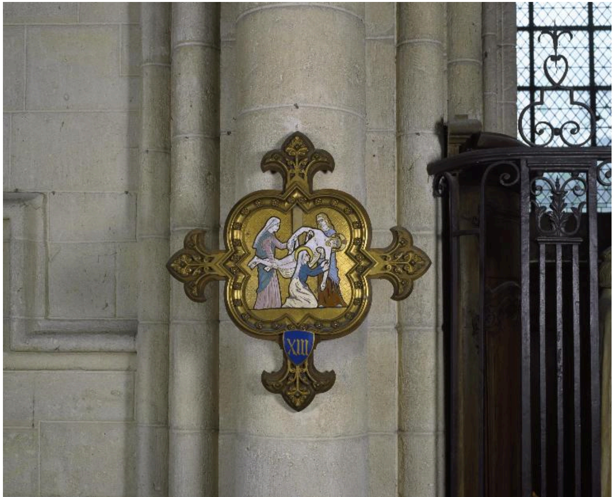
Vue de la 13e station : Jésus est descendu de la croix et remis à sa mère.