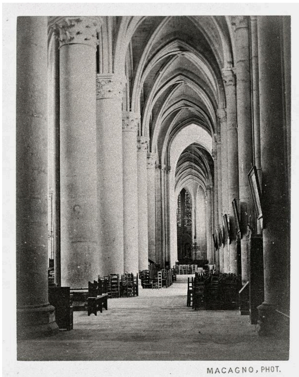
Photographie d'Eugène Macagno, montrant le collatéral sud de la cathédrale dans la seconde moitié du 19e siècle, avec le précédent chemin de croix (A Évêché Soissons : 2 Y, Soissons-Cathédrale).