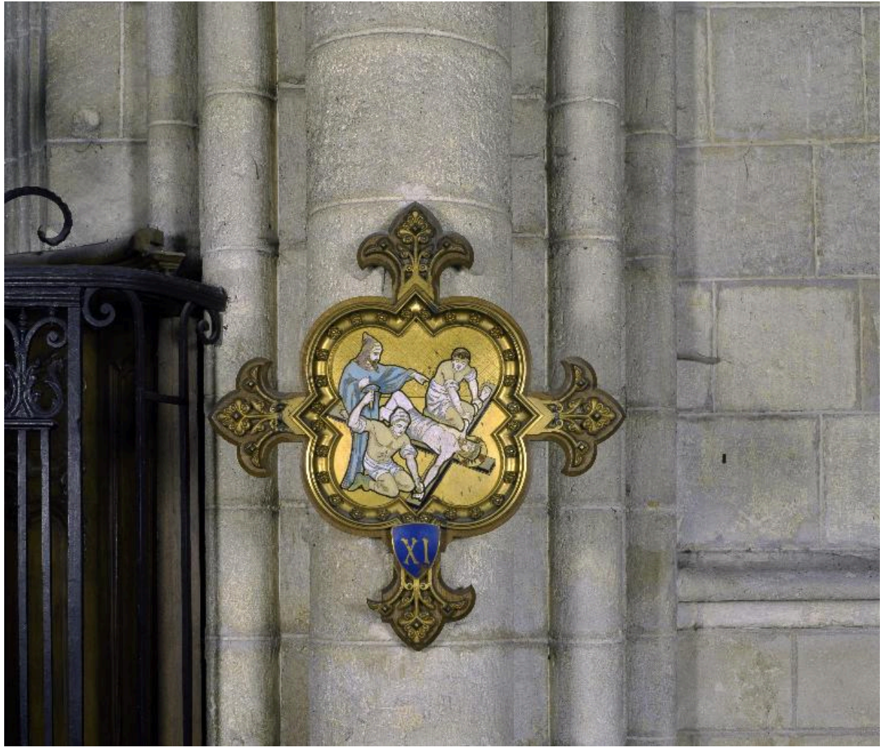
Vue de la 11e station : Jésus est cloué sur la croix.