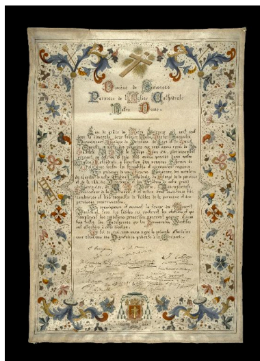
Procès-verbal de l'érection du chemin de croix le 2 février 1902 (A Évêché Soissons : non coté). IVR22_20020200534XA