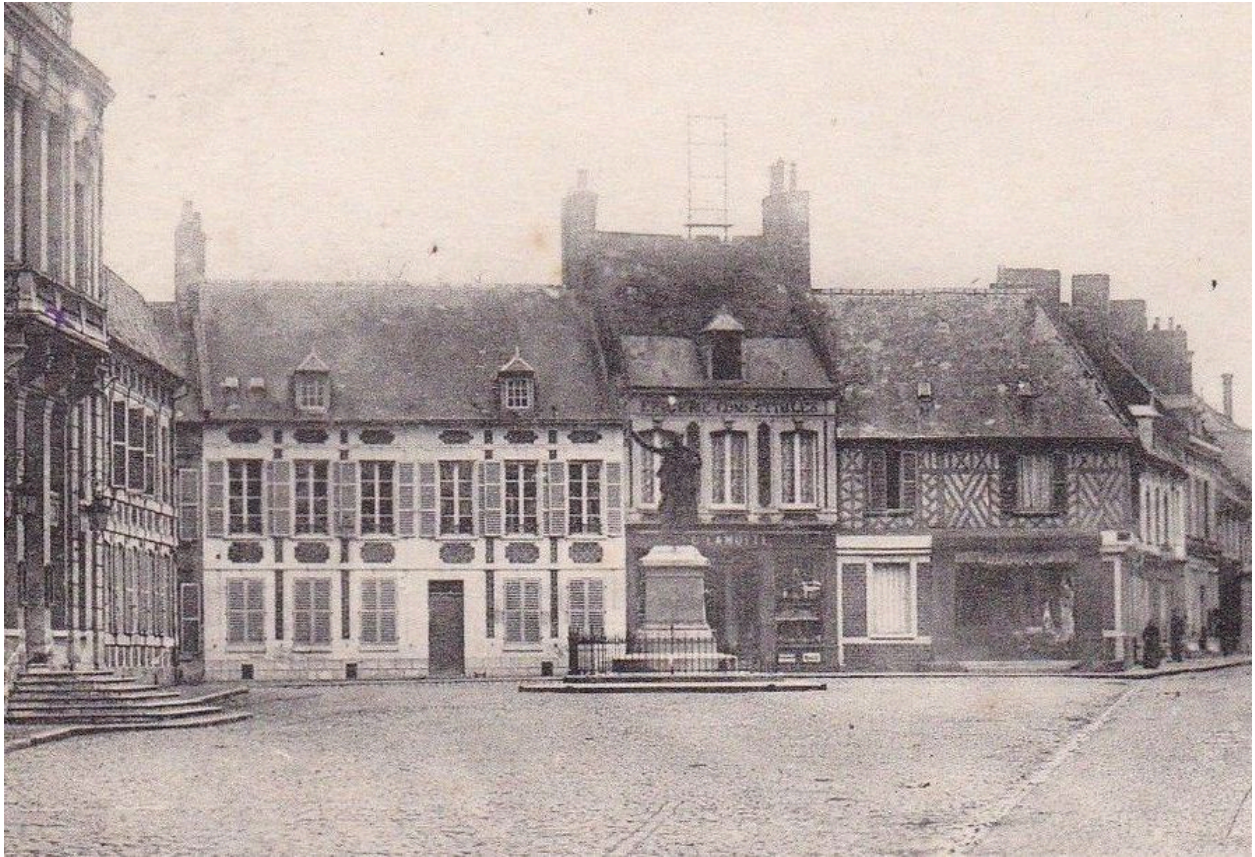
L'ancienne boucherie, à l'angle de la place de l'Hôtel-de-Ville et de la rue du Général-Foy. Carte postale, 1er quart 20e siècle.