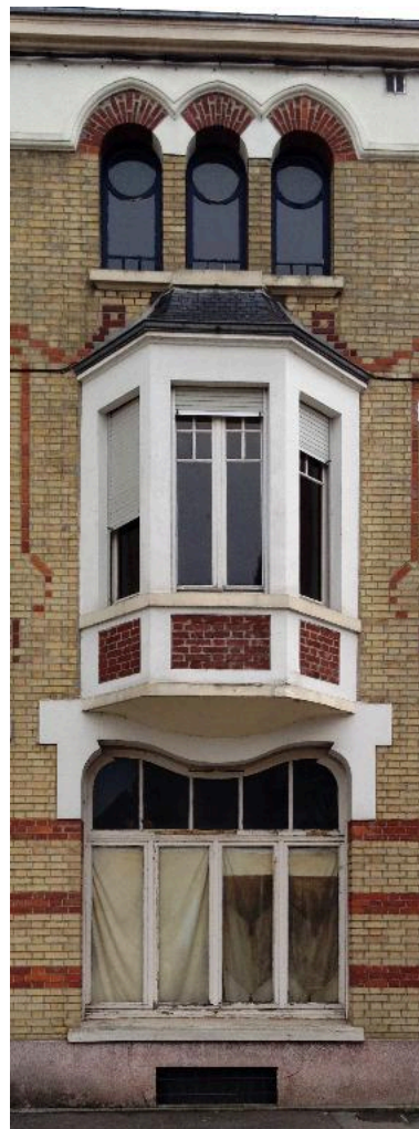
Détail d'une travée.