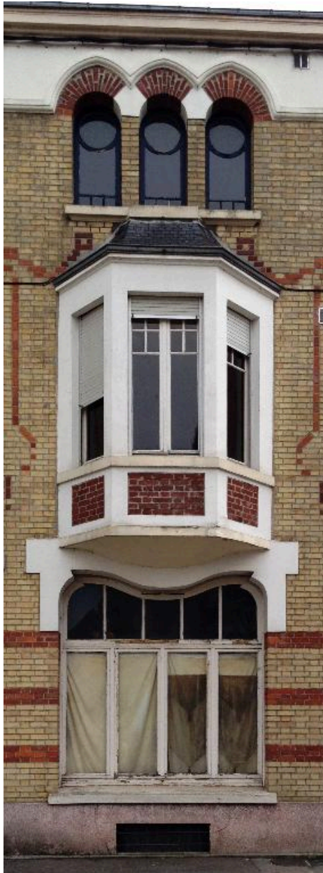
Détail d'une travée.