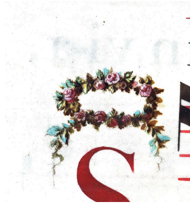
Détail de la page 91 : lettre S surmontée d'une couronne de roses.