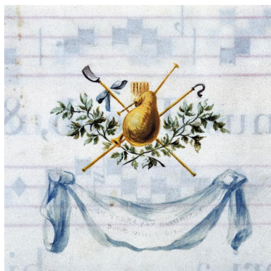
Vue de la page 16 : instruments de bergers, houlette et cornemuse.