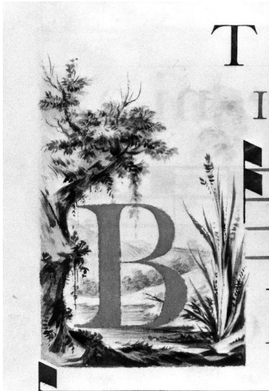
Détail de la page 70 : la lettre B enluminée. IVR22_19966003902X