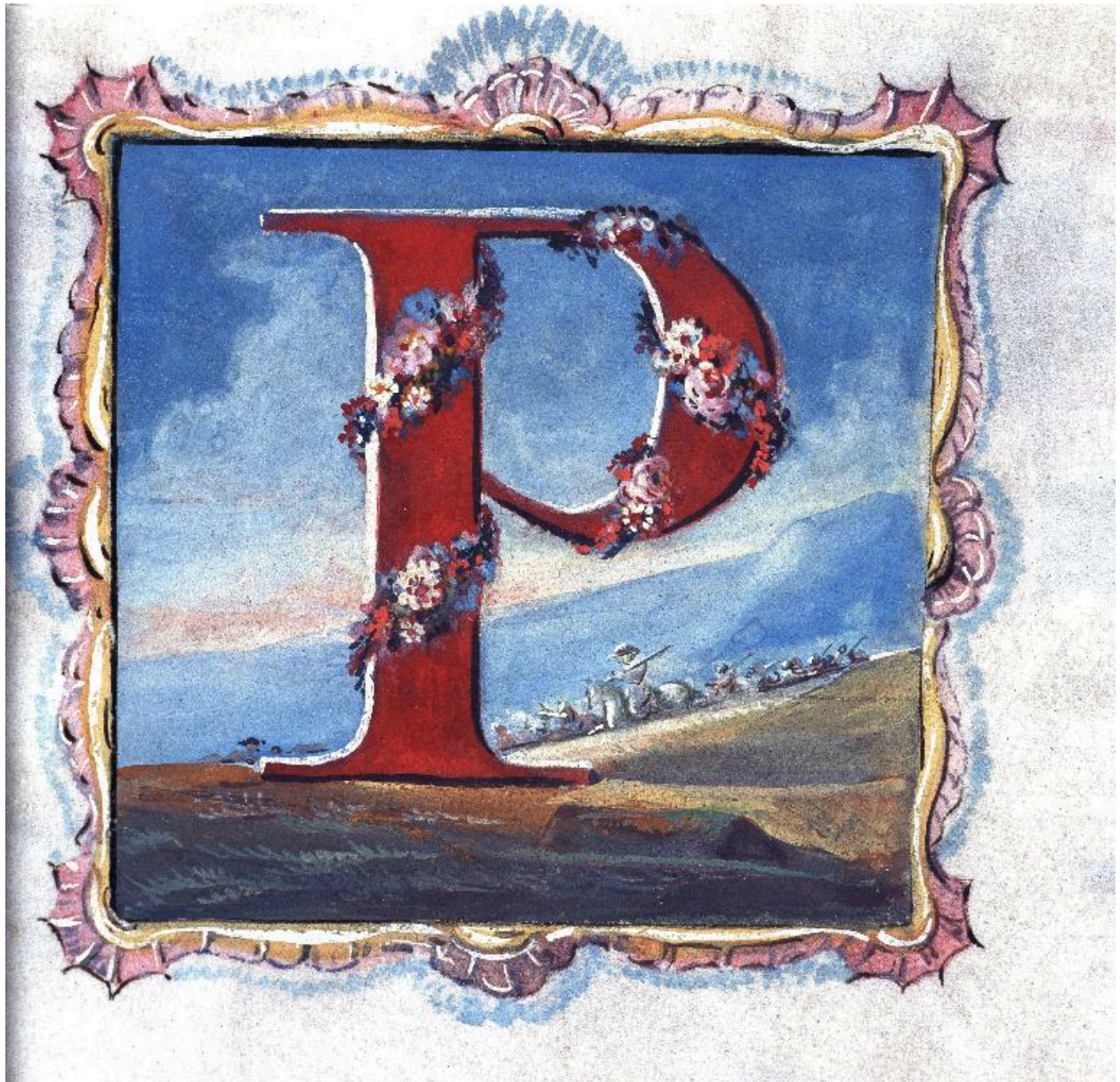
Vue de la page 62 : lettre P ornée de roses.