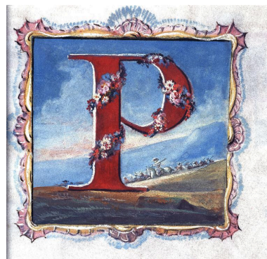
Vue de la page 62 : lettre P ornée de roses.