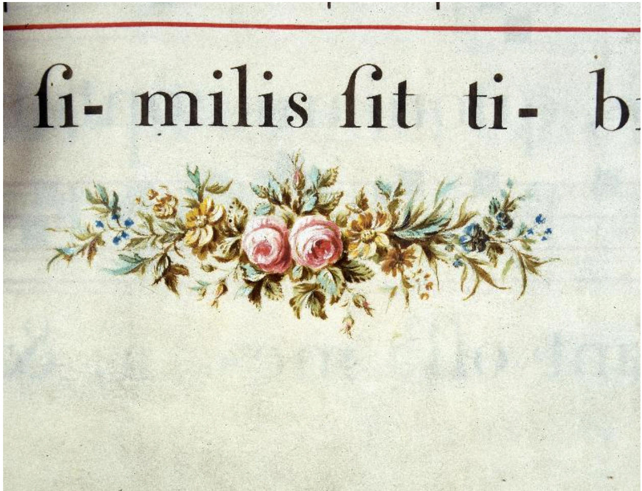
Détail du bas de la page 171 : petite guirlande de fleurs.