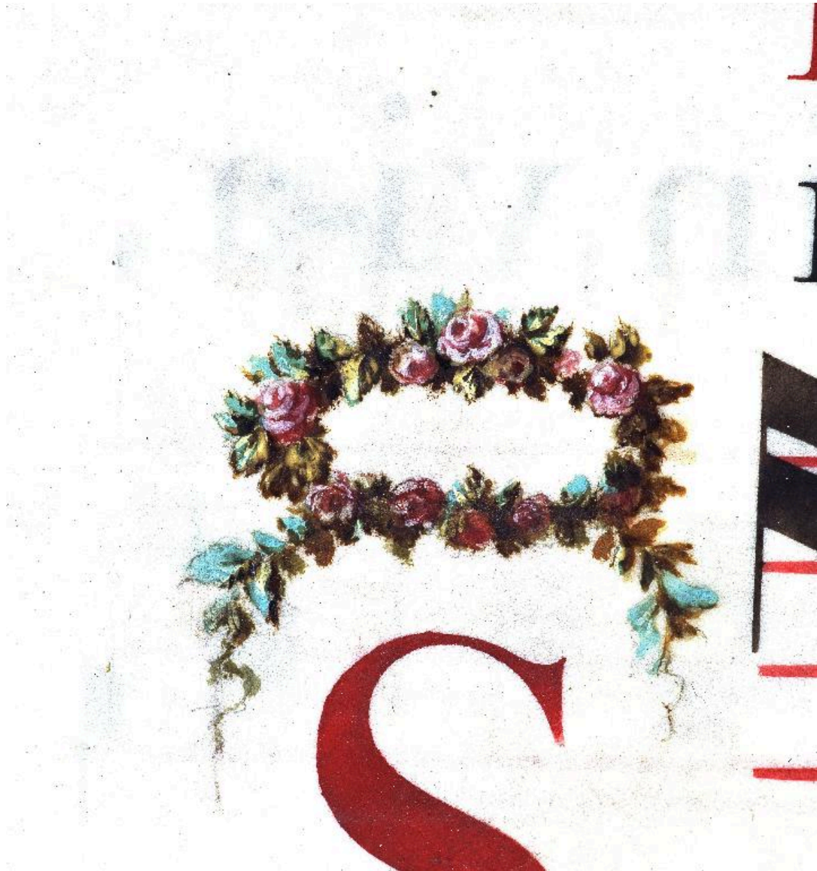
Détail de la page 91 : lettre S surmontée d'une couronne de roses.