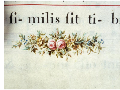
Détail du bas de la page 171 : petite guirlande de fleurs. IVR22_19966003626XA