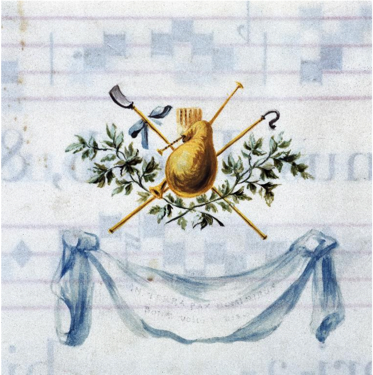
Vue de la page 16 : instruments de bergers, houlette et cornemuse.