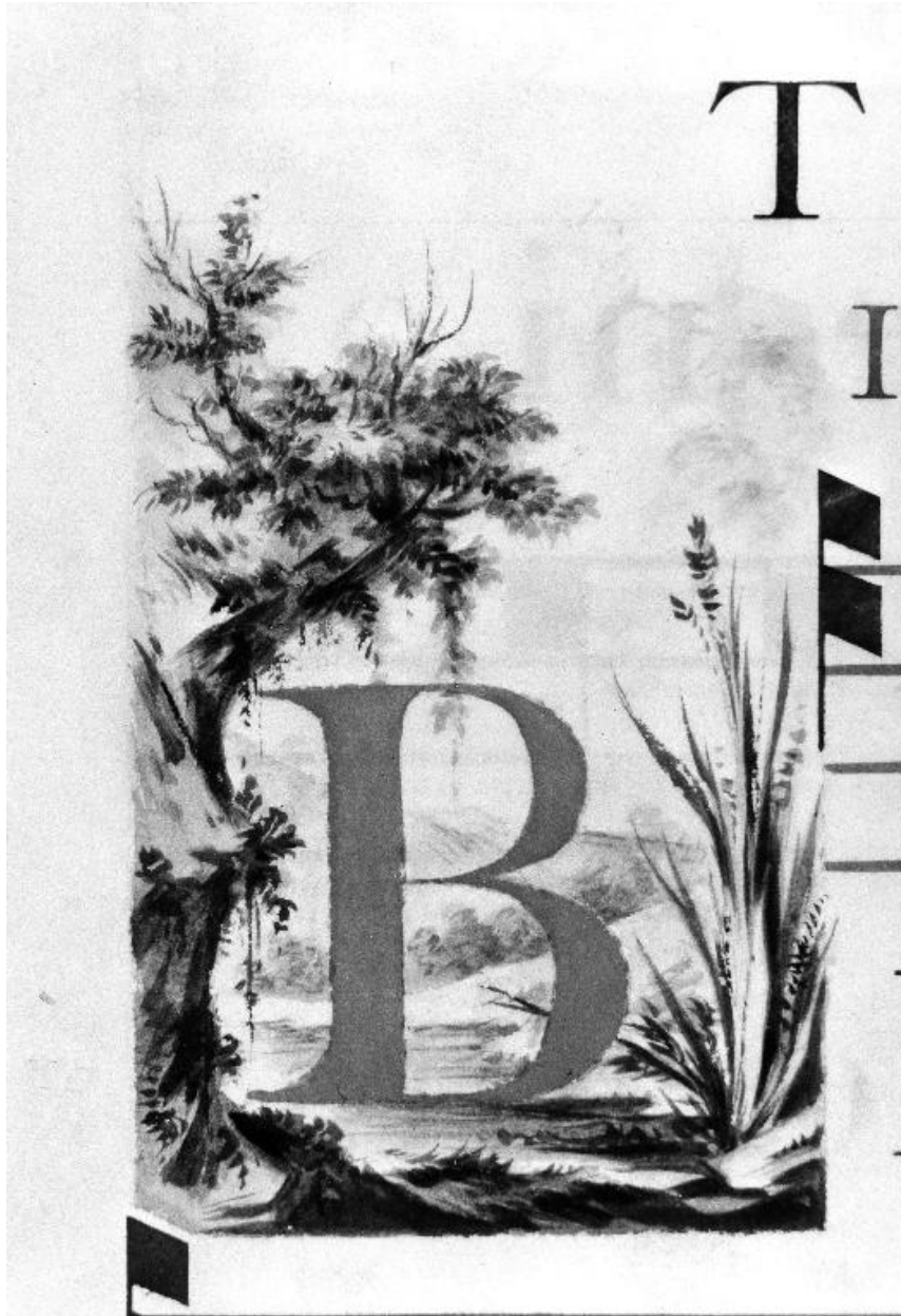
Détail de la page 70 : la lettre B enluminée.