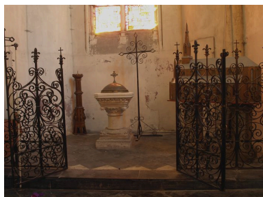
Accès vers les fonts baptismaux