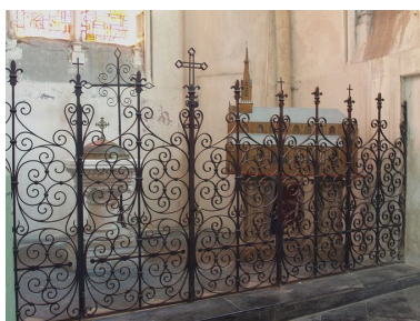
Vue générale IVR31_20106202769NUCA