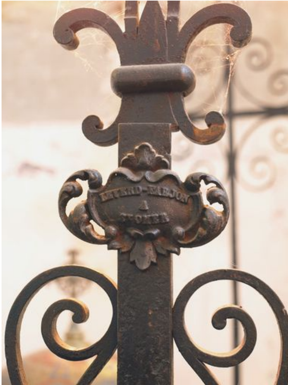
Marque de fabricant