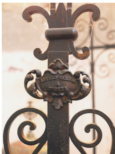
Marque de fabricant IVR31_20106202771NUCA