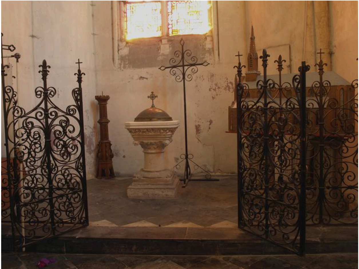
Accès vers les fonts baptismaux