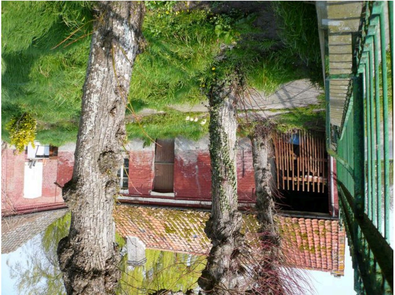
Vue de l'atelier et de la charretterie à l'ouest.