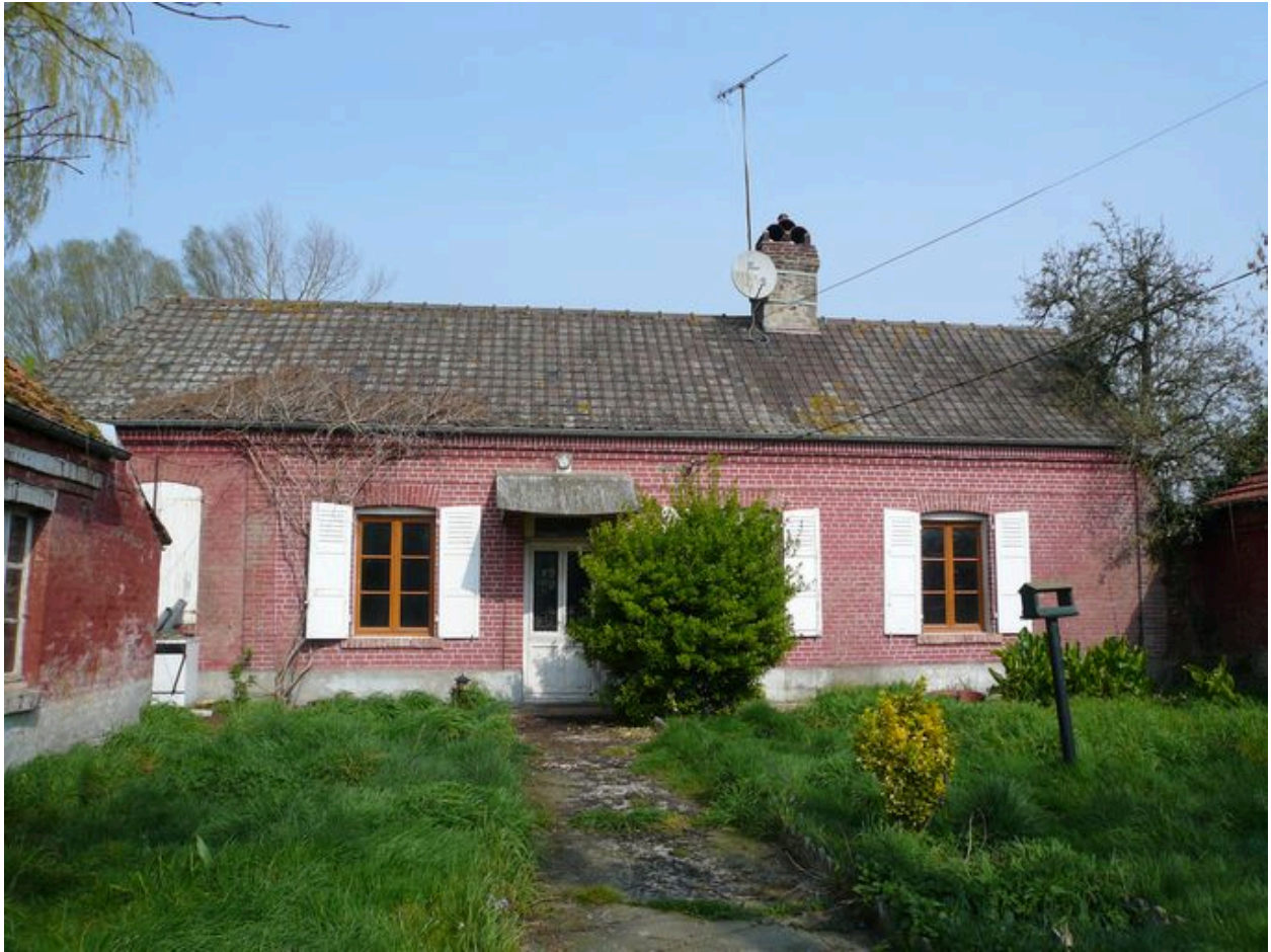
Vue du logis en fond de cour.