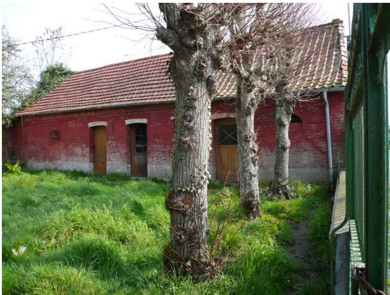
Vue des étables à l'est de la cour.