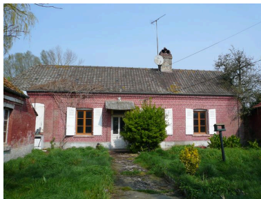
Vue du logis en fond de cour. IVR22_20078005702NUCA