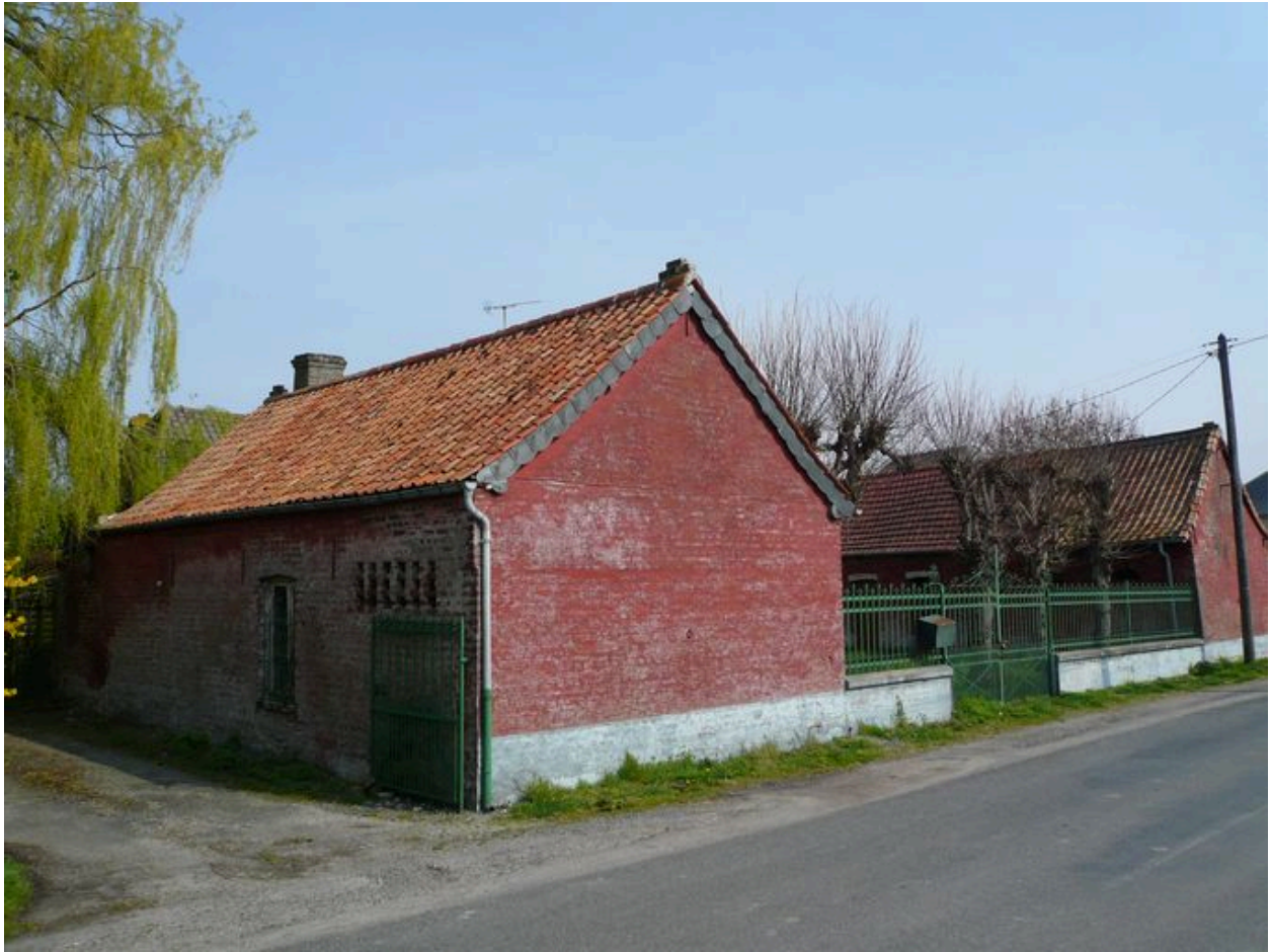
Vue générale depuis l'ouest.