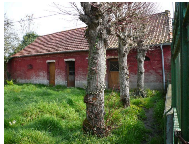
Vue des étables à l'est de la cour.