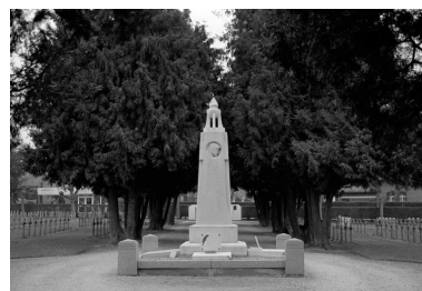
Vue postérieure. IVR22_19968000098Z