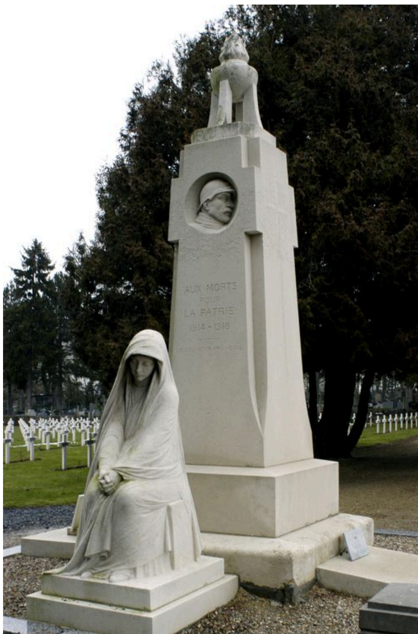
Détail de trois-quarts.