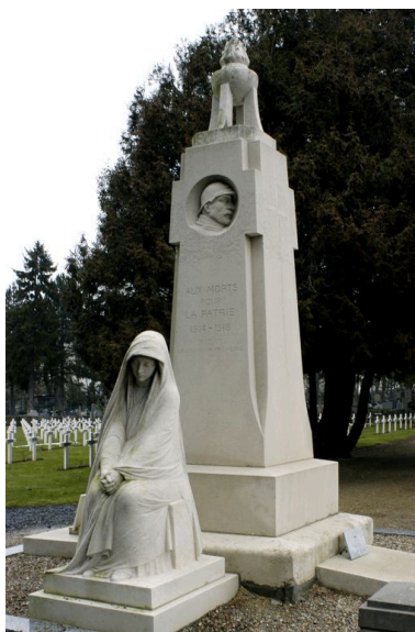
Détail de trois-quarts. IVR22_20058000349NUCA