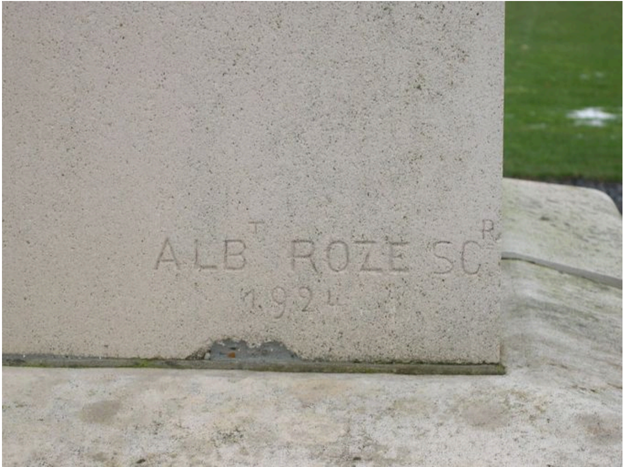
Vue de détail sur la signature et la date portées : Albert Roze, 1924.