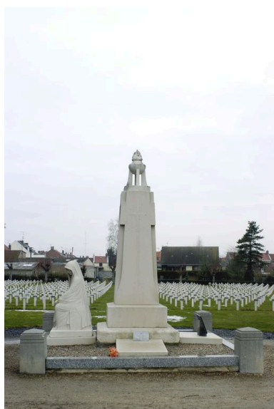
Vue latérale.