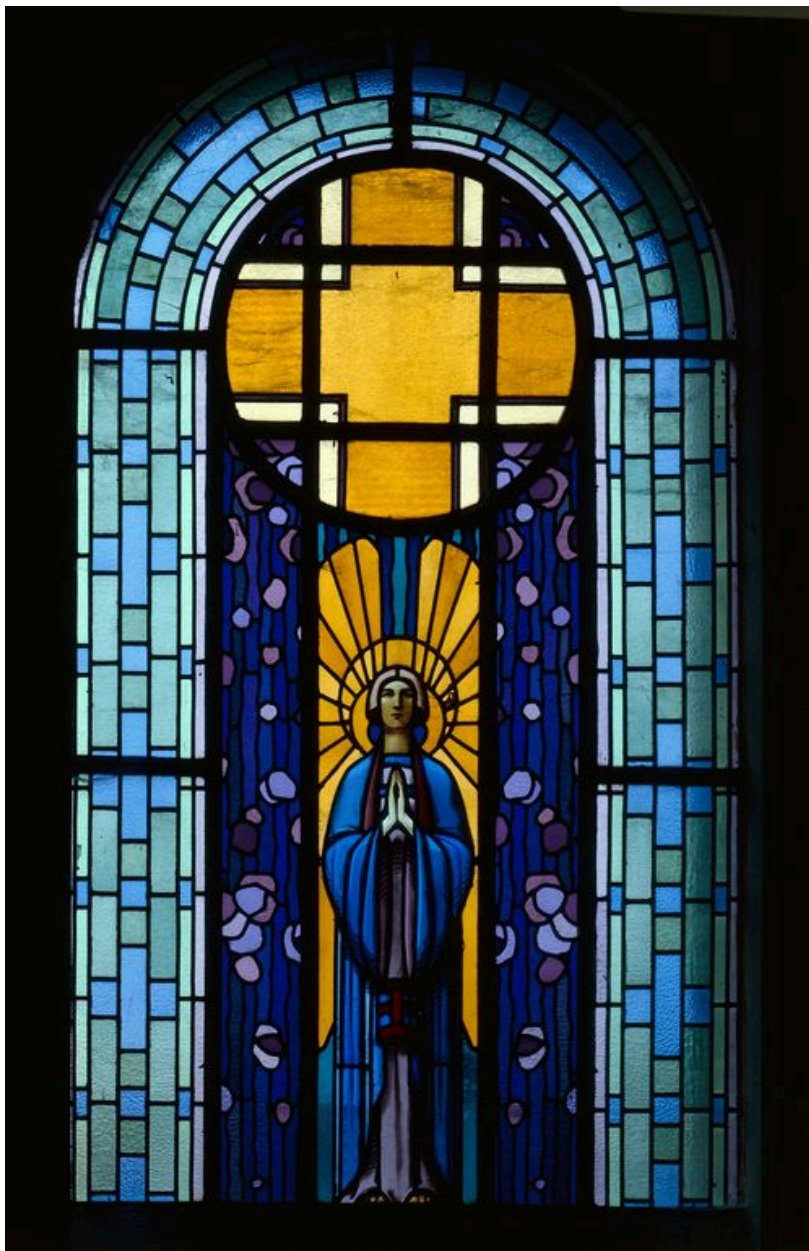
Verrière de la dernière travée du bas-côté sud, vers 1924-1926.