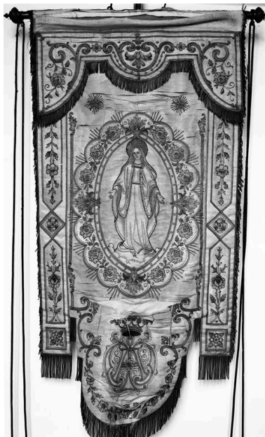
Bannière de procession : Immaculée Conception, 19 e siècle. IVR22_19846001165V