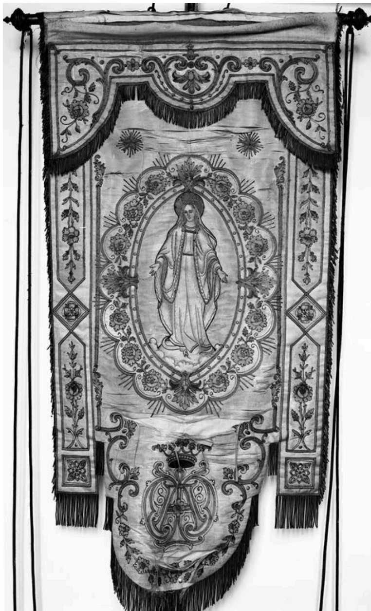
Bannière de procession : Immaculée Conception, 19e siècle.