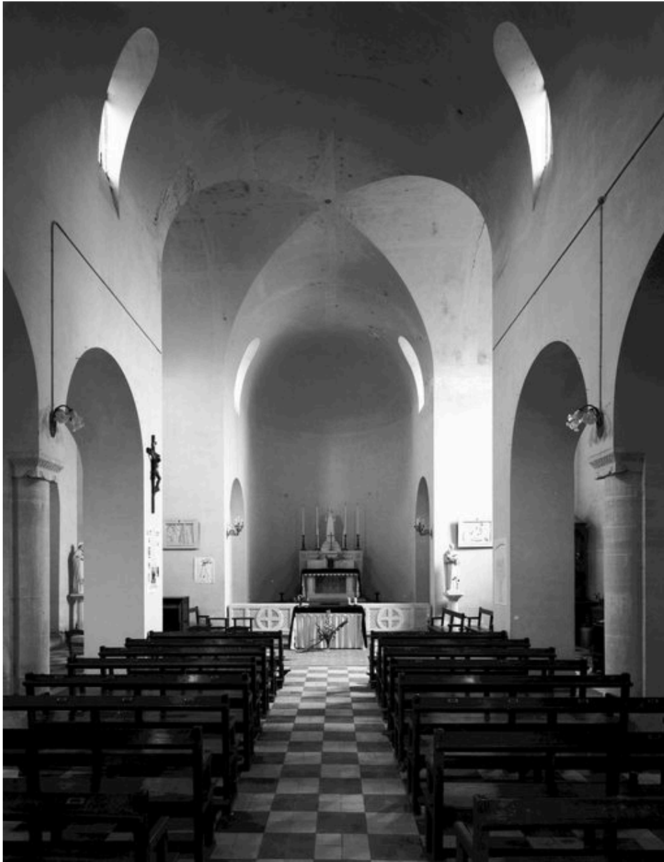
Vue intérieure vers le choeur.