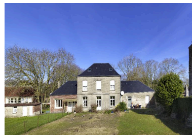
Façade postérieure. IVR22_20158000089NUC2A