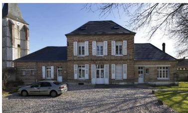
Vue générale. IVR22_20158000108NUC2A