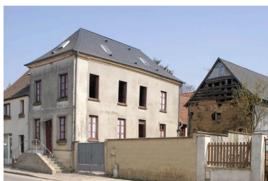
Vue générale. IVR22_20038000270NUCA