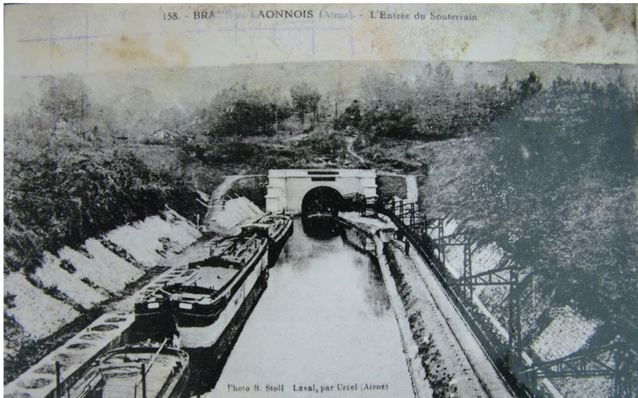
Vue ancienne du canal (coll. part).