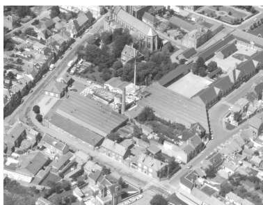
Vue aérienne, flanc sud-est.