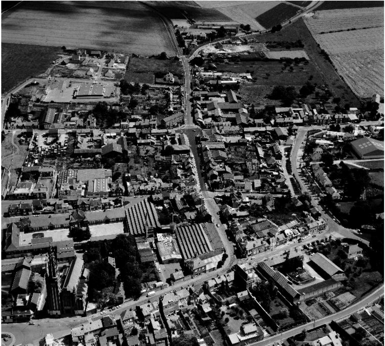
Vue aérienne, flanc ouest.