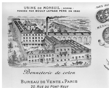
En-tête commercial figuré (AD Somme ; M 96850). IVR22_19888001588XB