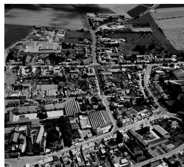
Vue aérienne, flanc ouest. IVR22_19888001345P