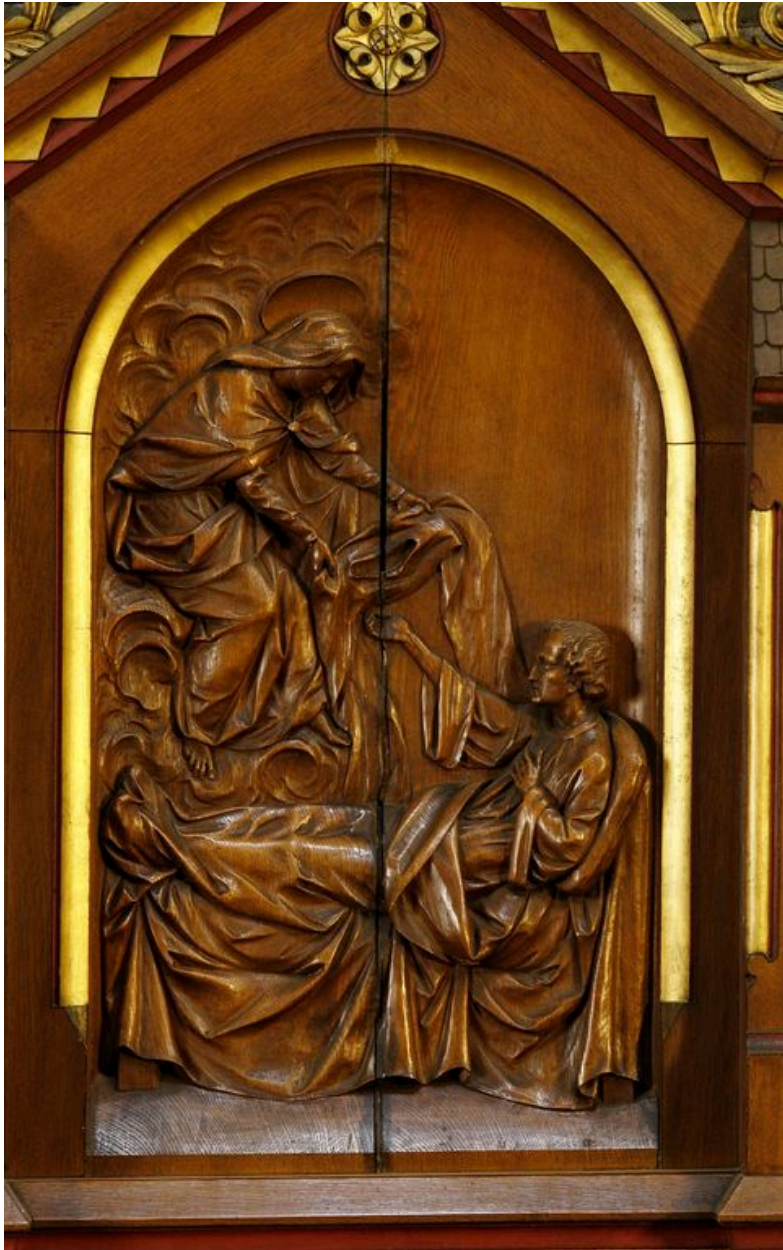
La remise du scapulaire au carmelite Simon Stock.