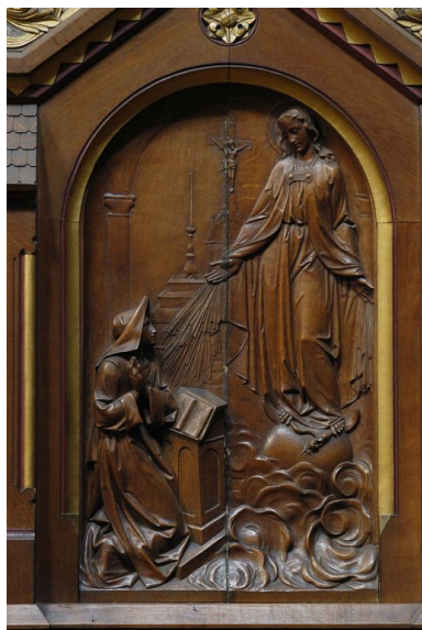
Apparition de la Vierge à Catherine Labouré. IVR22_20058001852NUCA