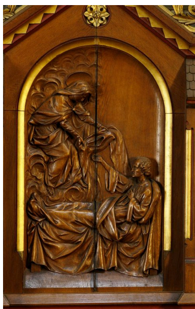
La remise du scapulaire au carmelite Simon Stock.