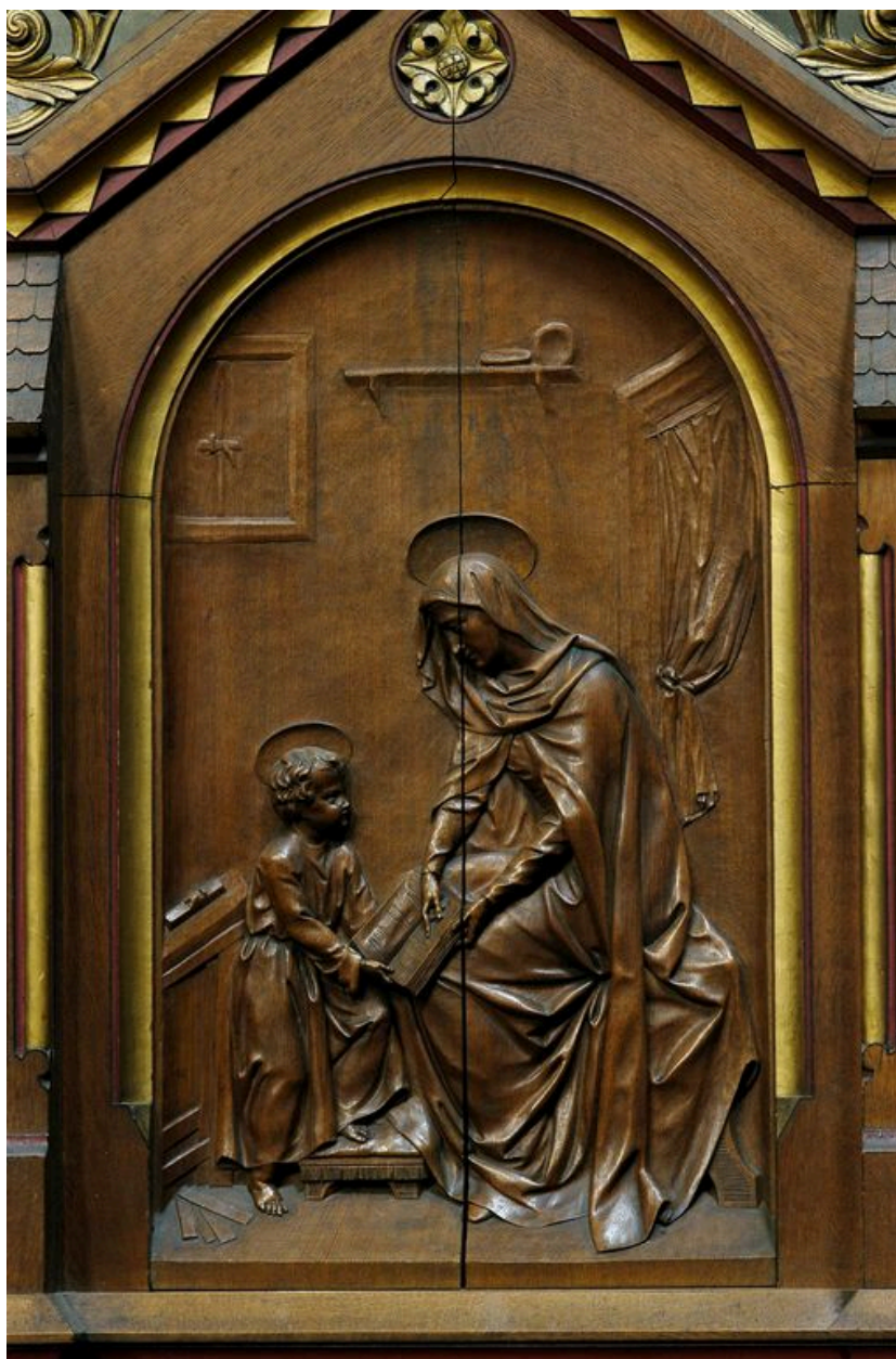
La Vierge éduquant Jésus.