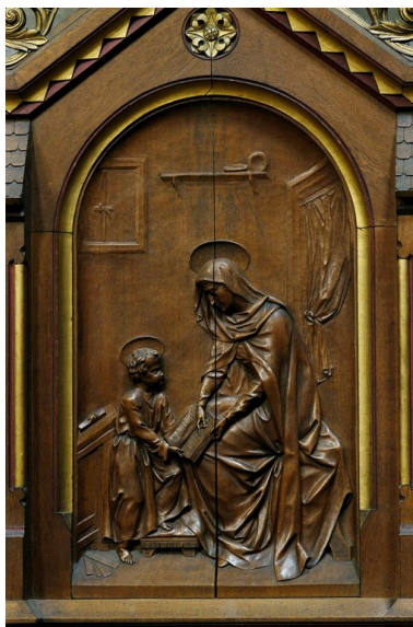
La Vierge éduquant Jésus. IVR22_20058001853NUCA