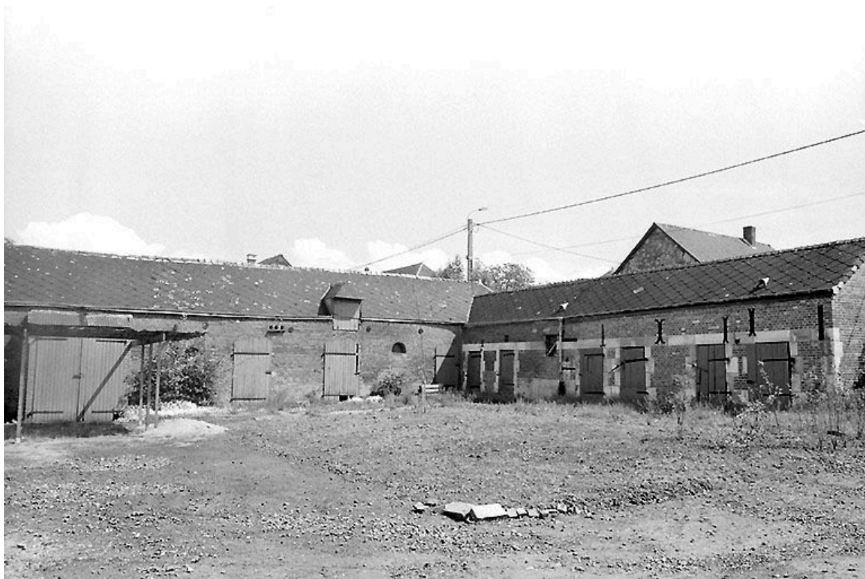
Vue des étables et de la porcherie.