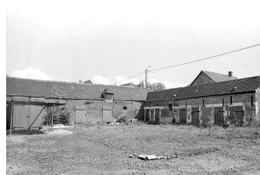
Vue des étables et de la porcherie. IVR22_19980201228Z