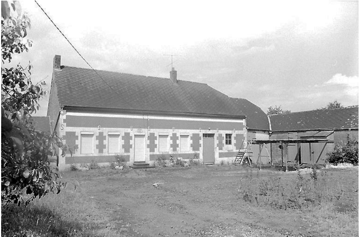
Vue depuis le sud-ouest.