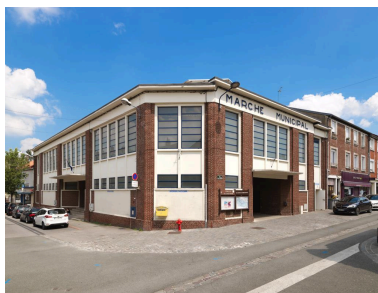
Vue générale. IVR32_20218000069NUCA