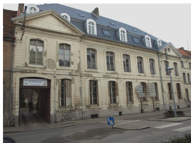
Façade sur rue IVR31_20106202969NUCA