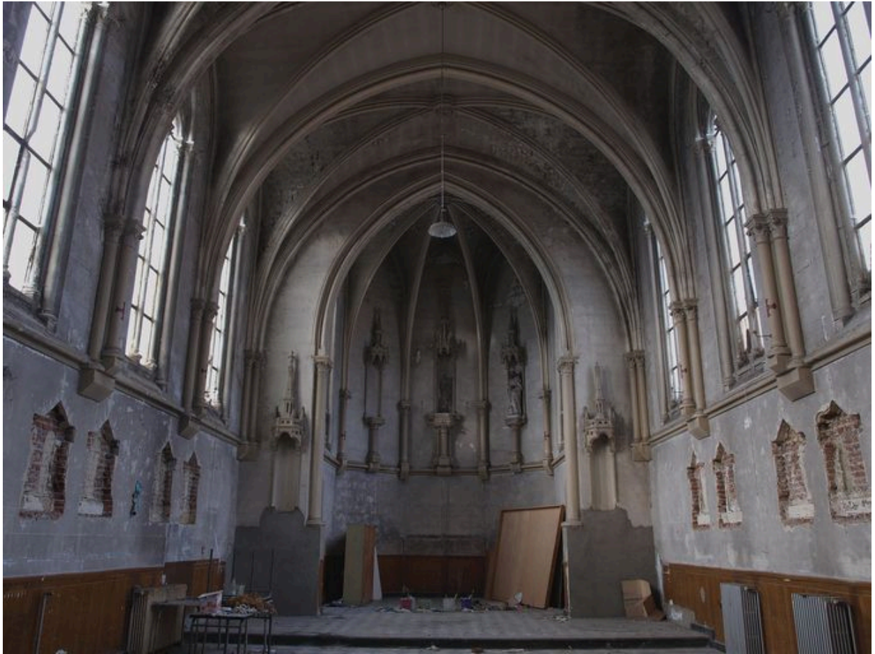
Chapelle, intérieur : vue d'ensemble du chœur (intérieur)