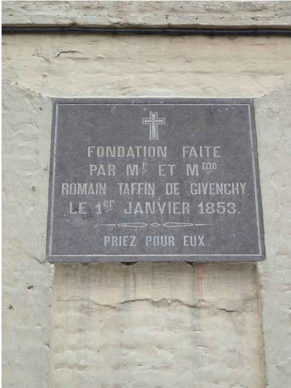
Inscription de fondation (façade arrière du bâtiment sur rue)