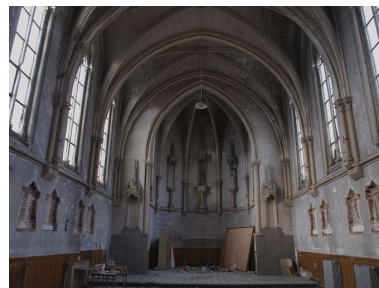
Chapelle, intérieur : vue d'ensemble du chœur (intérieur) IVR31_20106202974NUCA