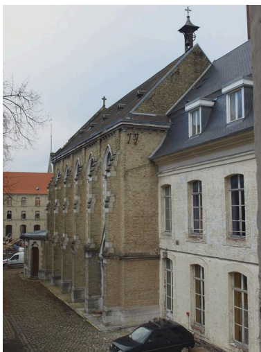
Bâtiment administratif et chapelle IVR31_20106202971NUCA