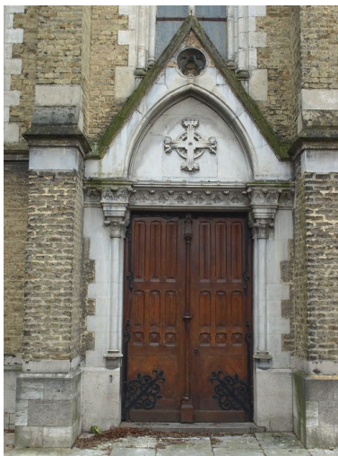
Chapelle : portail latéral