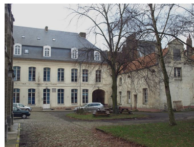
Façade arrière, et bâtiment annexe en retour d'angle IVR31_20106202970NUCA