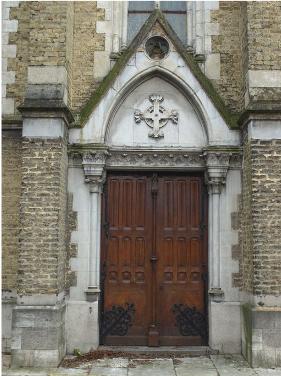
Chapelle : portail latéral