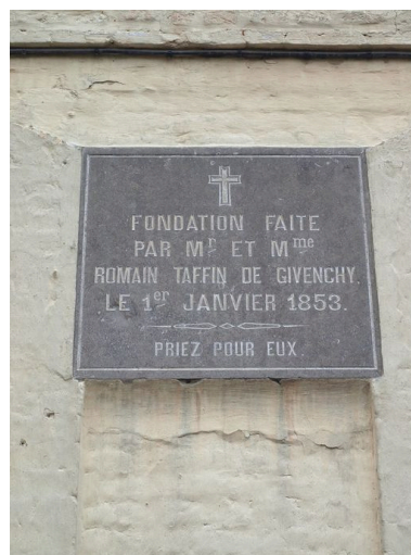
Inscription de fondation (façade arrière du bâtiment sur rue) IVR31_20106202977NUCA