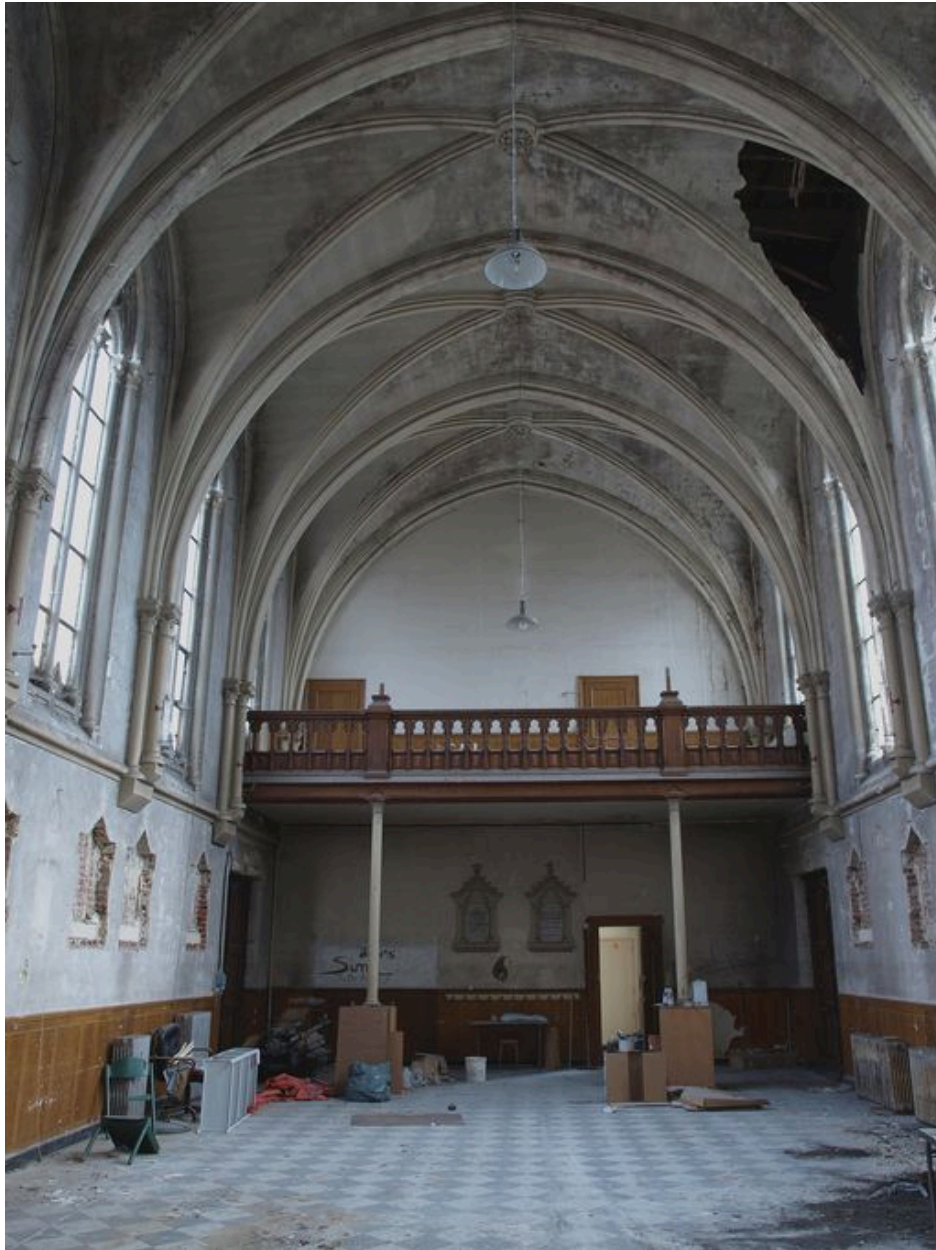
Chapelle, intérieur : nef, vue vers le mur ouest, plaques de consécration sous la tribune.