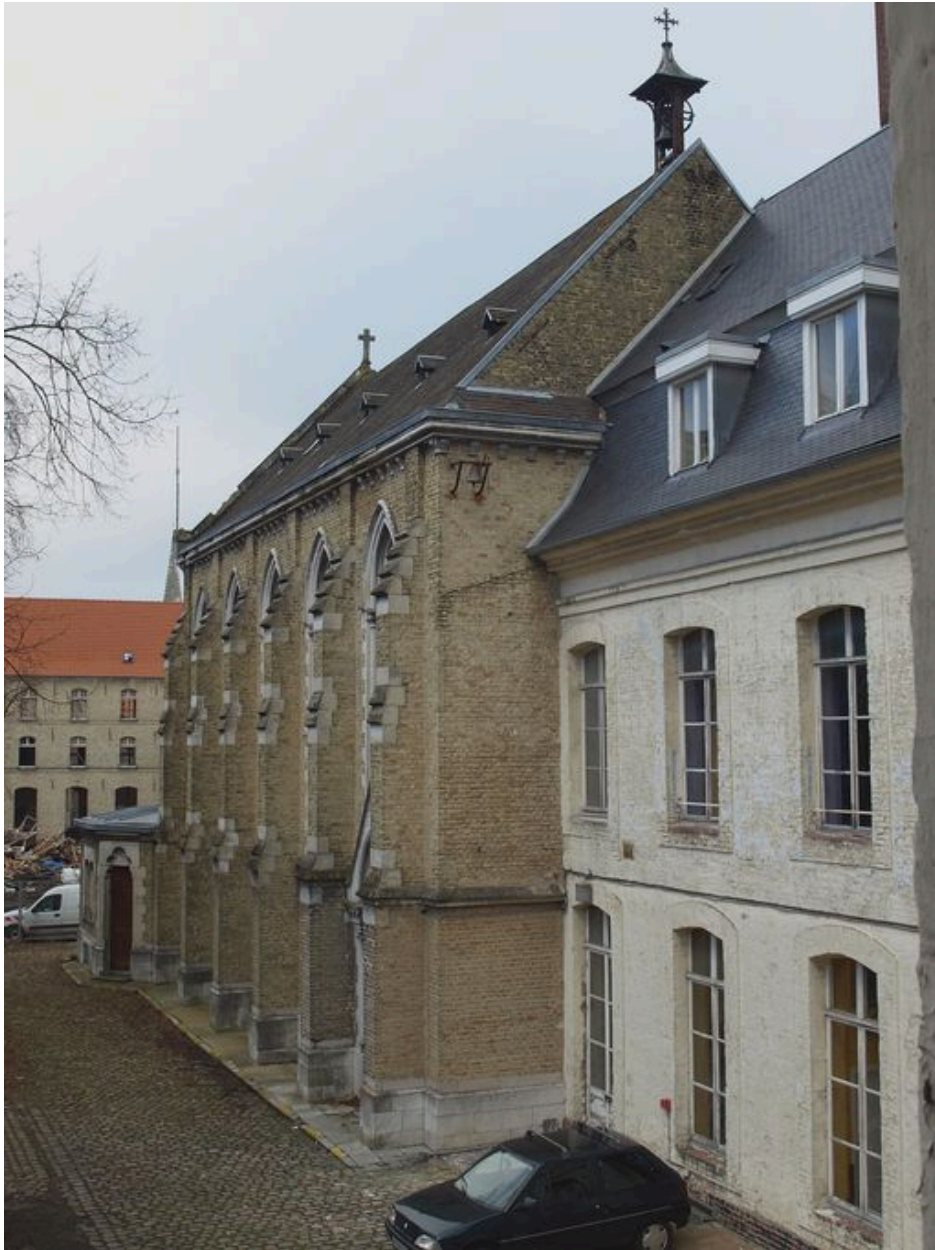
Bâtiment administratif et chapelle