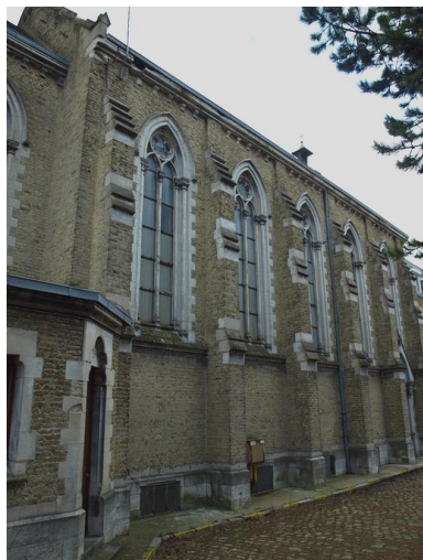
Chapelle : murs latéraux IVR31_20106202972NUCA