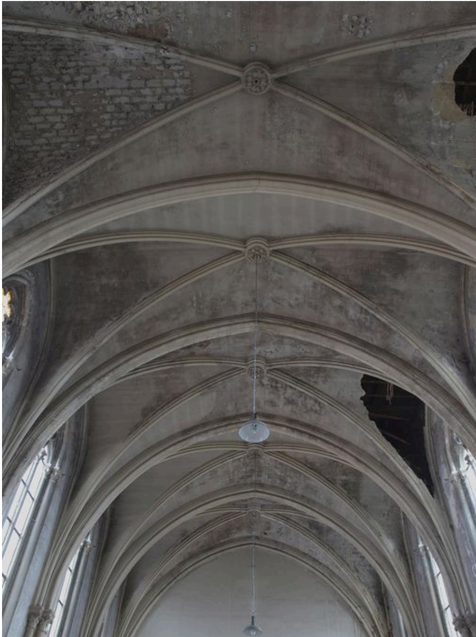
Chapelle, intérieur : fausses voûtes de la nef, en bois et plâtre (mauvais état).