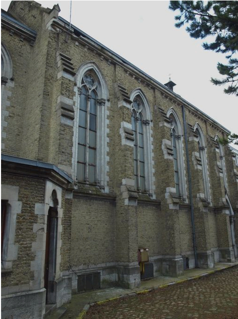
Chapelle : murs latéraux