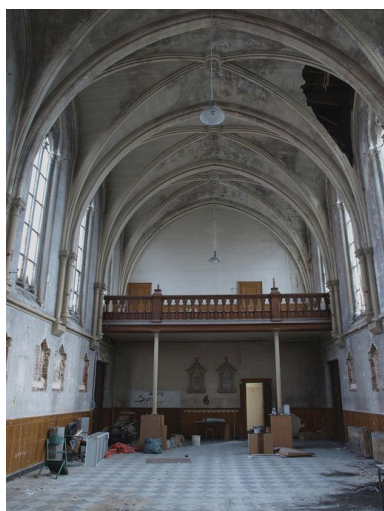
Chapelle, intérieur : nef, vue vers le mur ouest, plaques de consécration sous la tribune. IVR31_20106202975NUCA