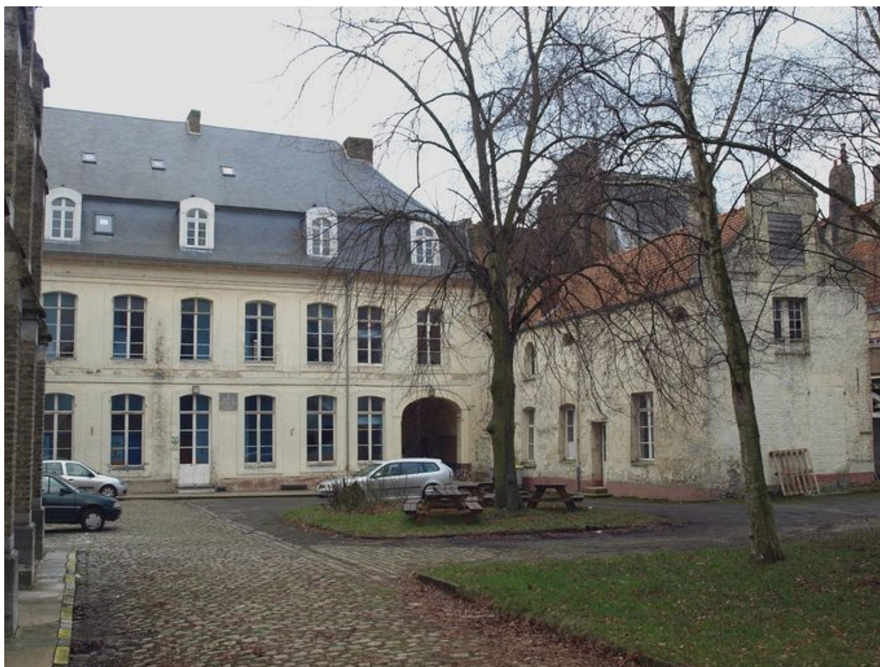
Façade arrière, et bâtiment annexe en retour d'angle