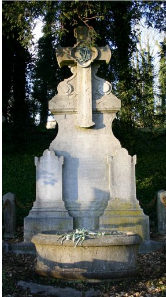
Stèle à croix monumentale, agrémentée de deux stèles d'applique.