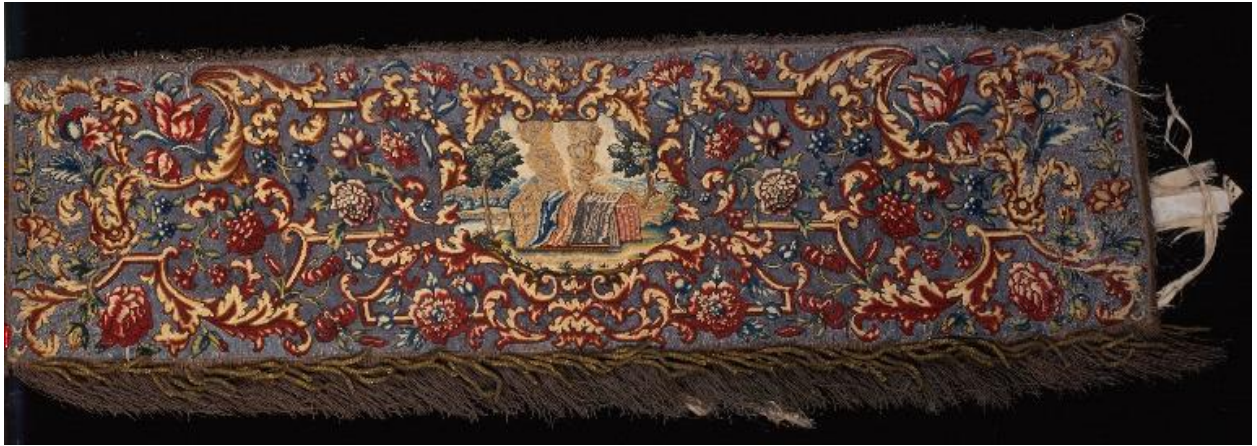
Vue d'ensemble d'une des quatre pentes de dais illustrant la tente du Témoignage ou la tente de la Rencontre.