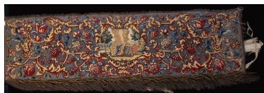
Vue d'ensemble d'une des quatre pentes de dais illustrant la tente du Témoignage ou la tente de la Rencontre.