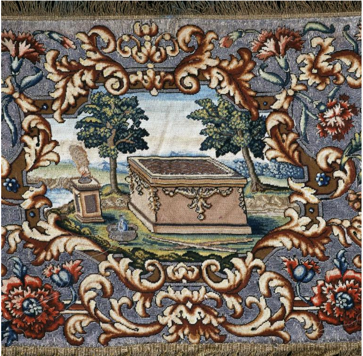
Détail du motif central d'une des quatre pentes de dais : l'Autel des parfums.