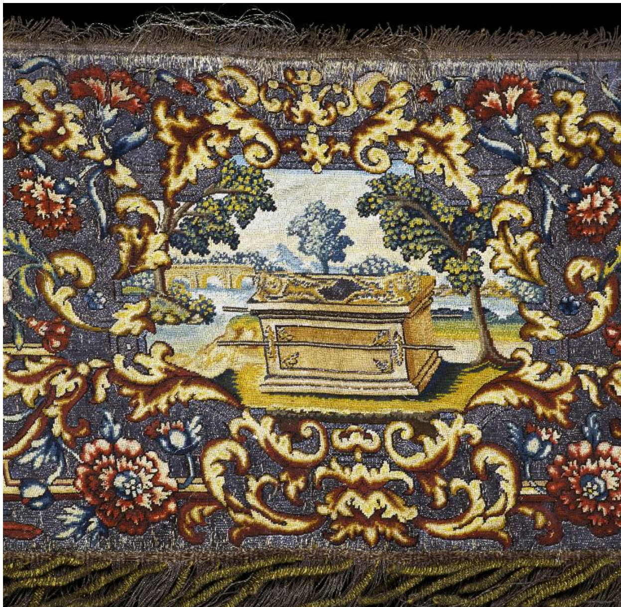
Détail du motif central d'une des quatre pentes de dais : l'Arche d'Alliance.