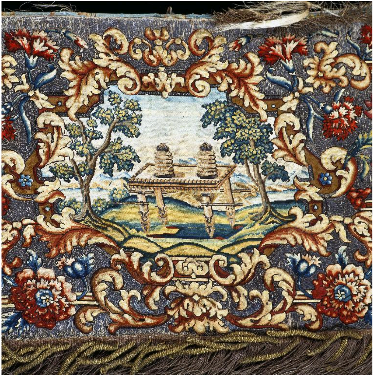
Détail du motif central d'une des quatre pentes de dais : les douze pains de proposition.