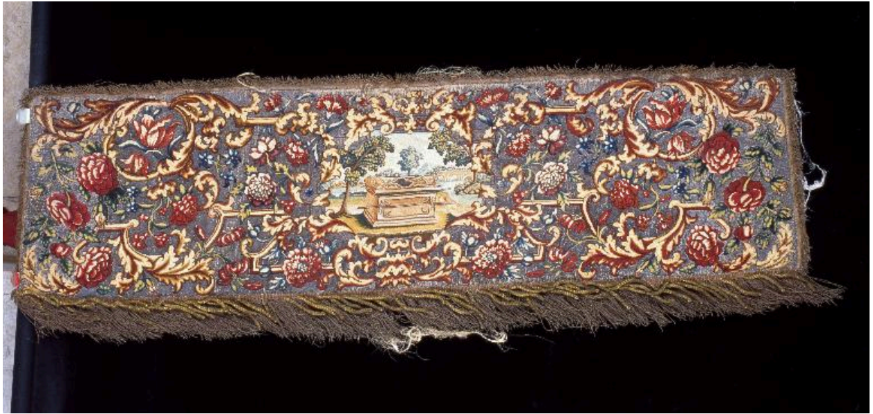
Vue d'ensemble d'une des quatre pentes de dais illustrant l'Arche d'Alliance.