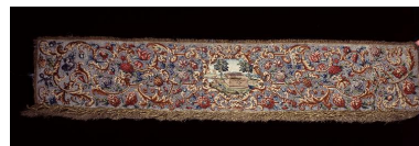
Vue d'ensemble de l'une des quatre pentes de dais illustrant l'autel des parfums. IVR22_19966002377VA