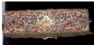
Vue d'ensemble d'une des quatre pentes de dais illustrant l'Arche d'Alliance.