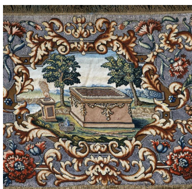
Détail du motif central d'une des quatre pentes de dais : l'Autel des parfums. IVR22_19966002379XA