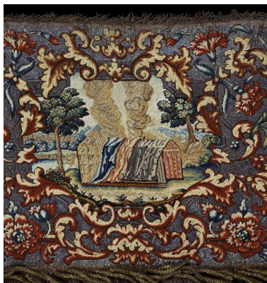
Détail du motif central d'une des quatre pentes de dais : la tente du Témoignage ou tente de la Rencontre.