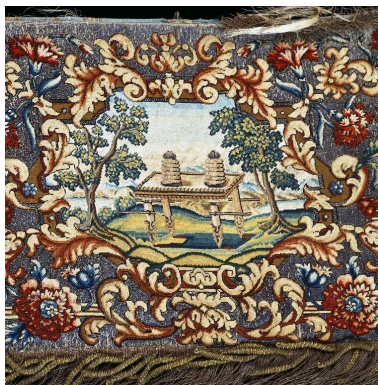
Détail du motif central d'une des quatre pentes de dais : les douze pains de proposition.