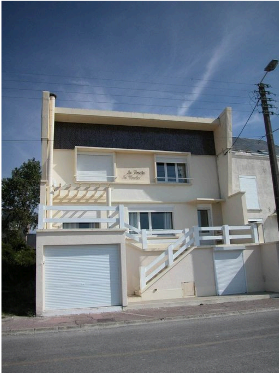
Le style Bungalow, les Mouettes, promenade Jules-Noiret (1985 AW 324).