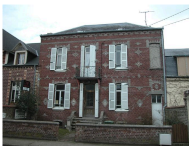
Maison avec couloir latéral pour accéder en fond de parcelle, Papillon bleu, 38 rue Carnot (1985 AV 130). IVR22_20058003728NUCA