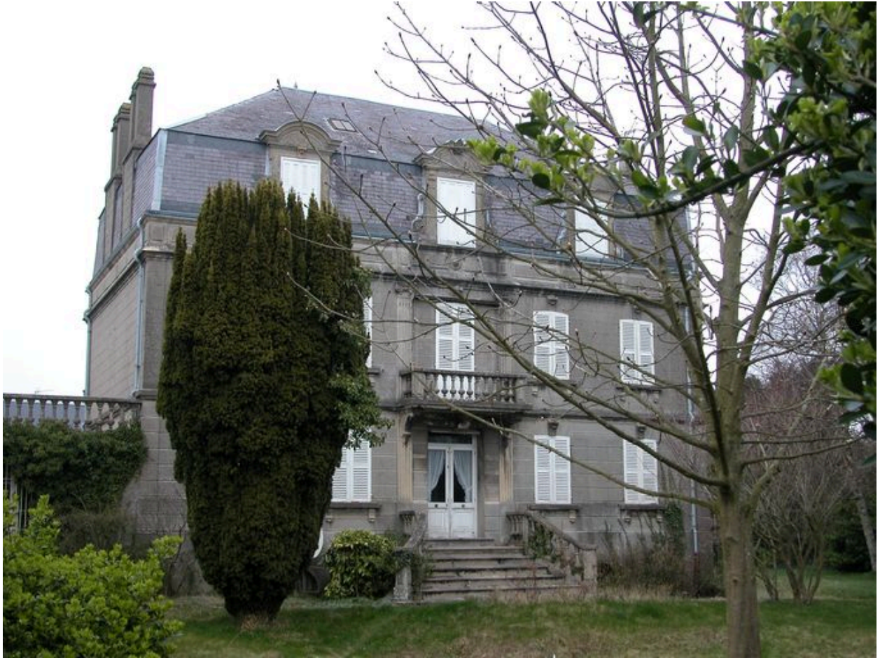
Maison Florentin Lefils, 2 rue Florentin-Lefils (1985 AP 93).