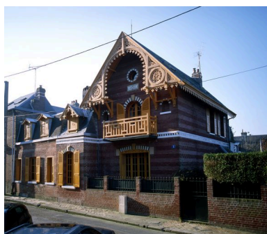
Influence du chalet colonial, maison dite Irène, rue Eudel (1985 AS 20).