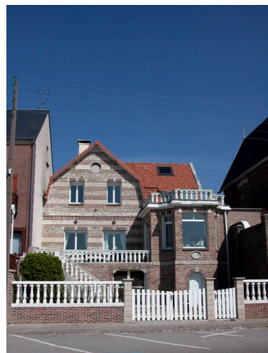
Appareil mixte de brique et de galets de silex équarris, Promenade Jules Noiret, 1985 AV 265. IVR22_20058003767NUCA