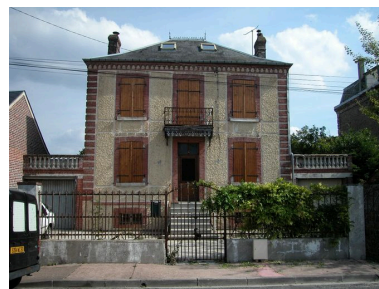
Garages accolés, 16 rue Florentin-Lefils (1985 AP 80). IVR22_20058002589NUCA