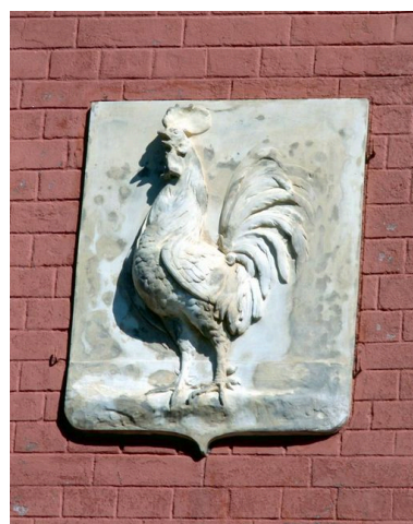
Coq sculpté, maison dite Le Souvenir, rue Pierre-Guerlain (1985 AS 119).