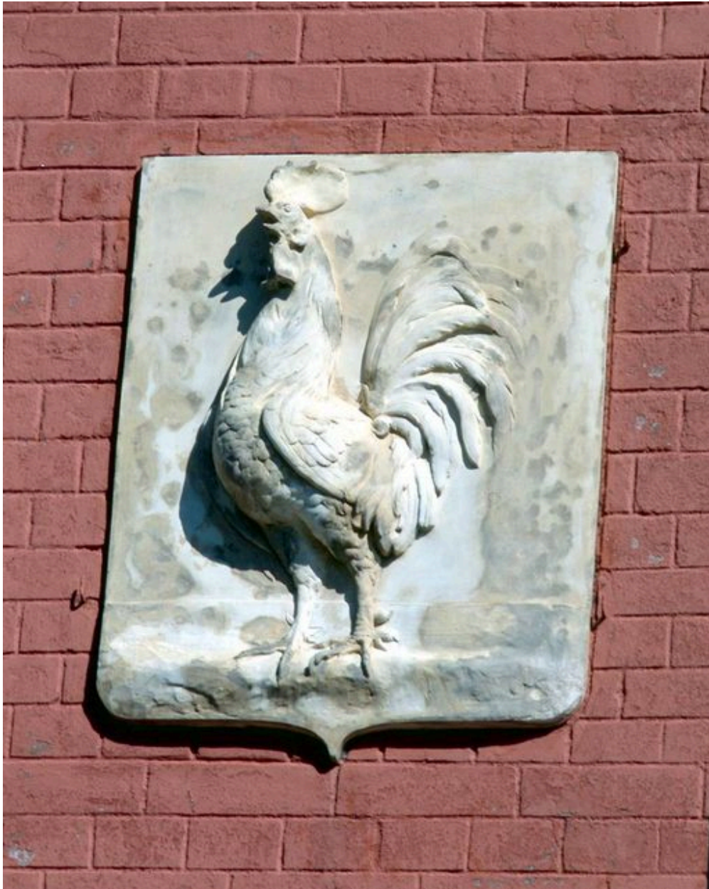
Coq sculpté, maison dite Le Souvenir, rue Pierre-Guerlain (1985 AS 119).