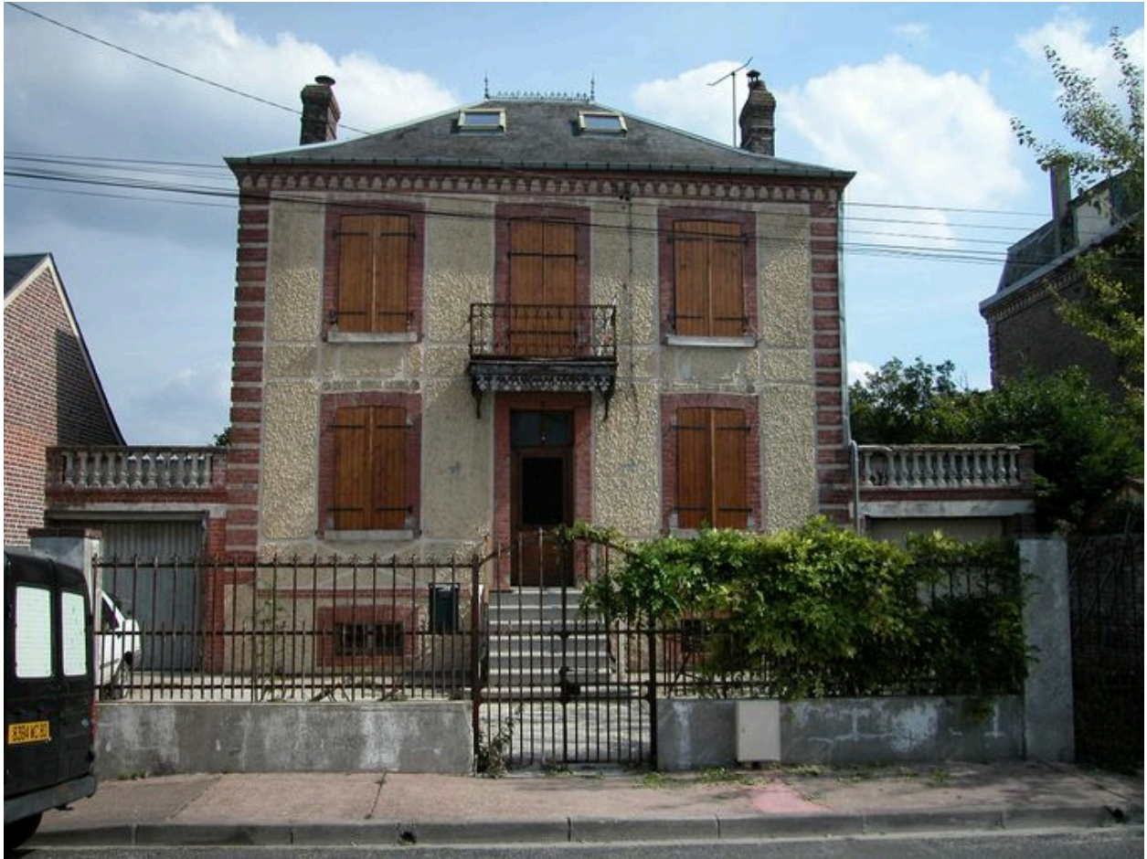
Garages accolés, 16 rue Florentin-Lefils (1985 AP 80).