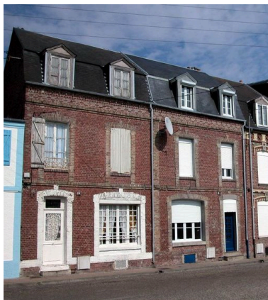
Maison de ville à deux logements accolés, Villa Maurice et Villa Mon Caprice, rue de l'Eglise (1985 AT 233, 234). IVR22_20058002591NUCA