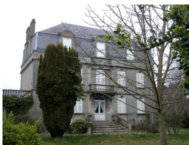
Maison Florentin Lefils, 2 rue Florentin-Lefils (1985 AP 93). IVR22_20058002583NUCA