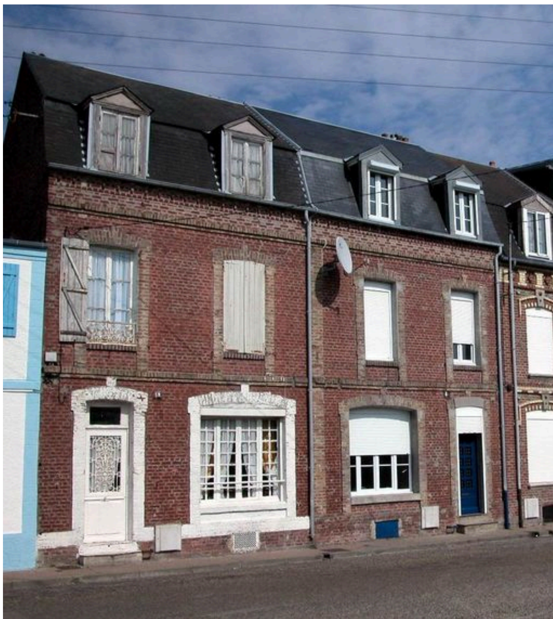
Maison de ville à deux logements accolés, Villa Maurice et Villa Mon Caprice, rue de l'Eglise (1985 AT 233, 234).