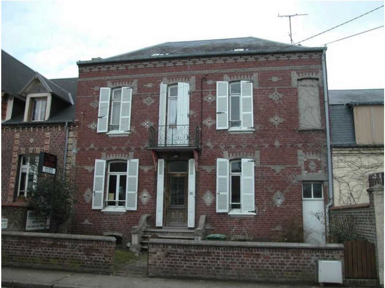
Maison avec couloir latéral pour accéder en fond de parcelle, Papillon bleu, 38 rue Carnot (1985 AV 130).