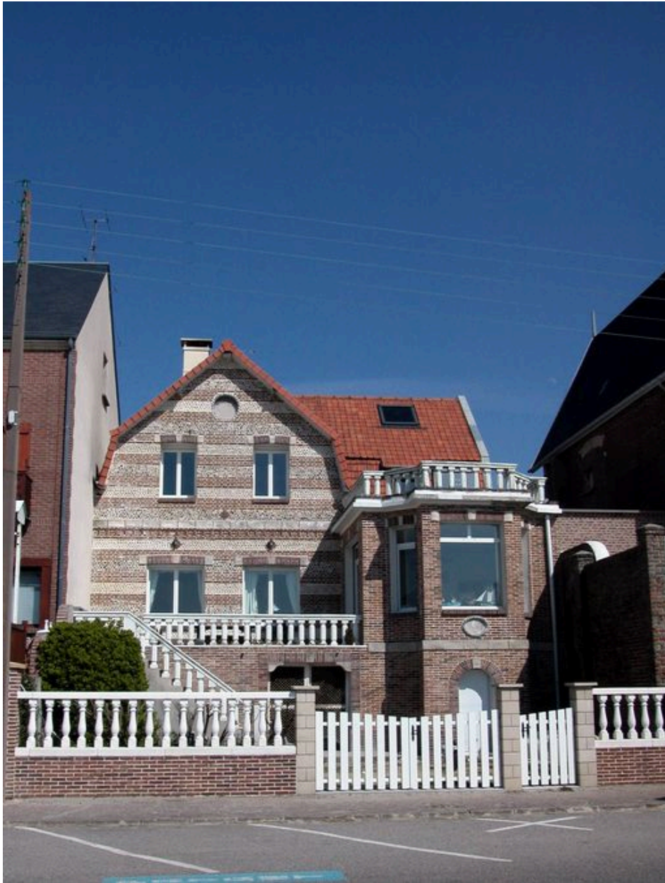
Appareil mixte de brique et de galets de silex équarris, Promenade Jules Noiret, 1985 AV 265.