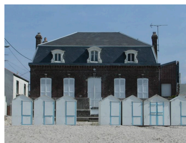
Influence du style classique, 2 rue des Bains (1985 ATT 142). IVR22_20048001612NUCA