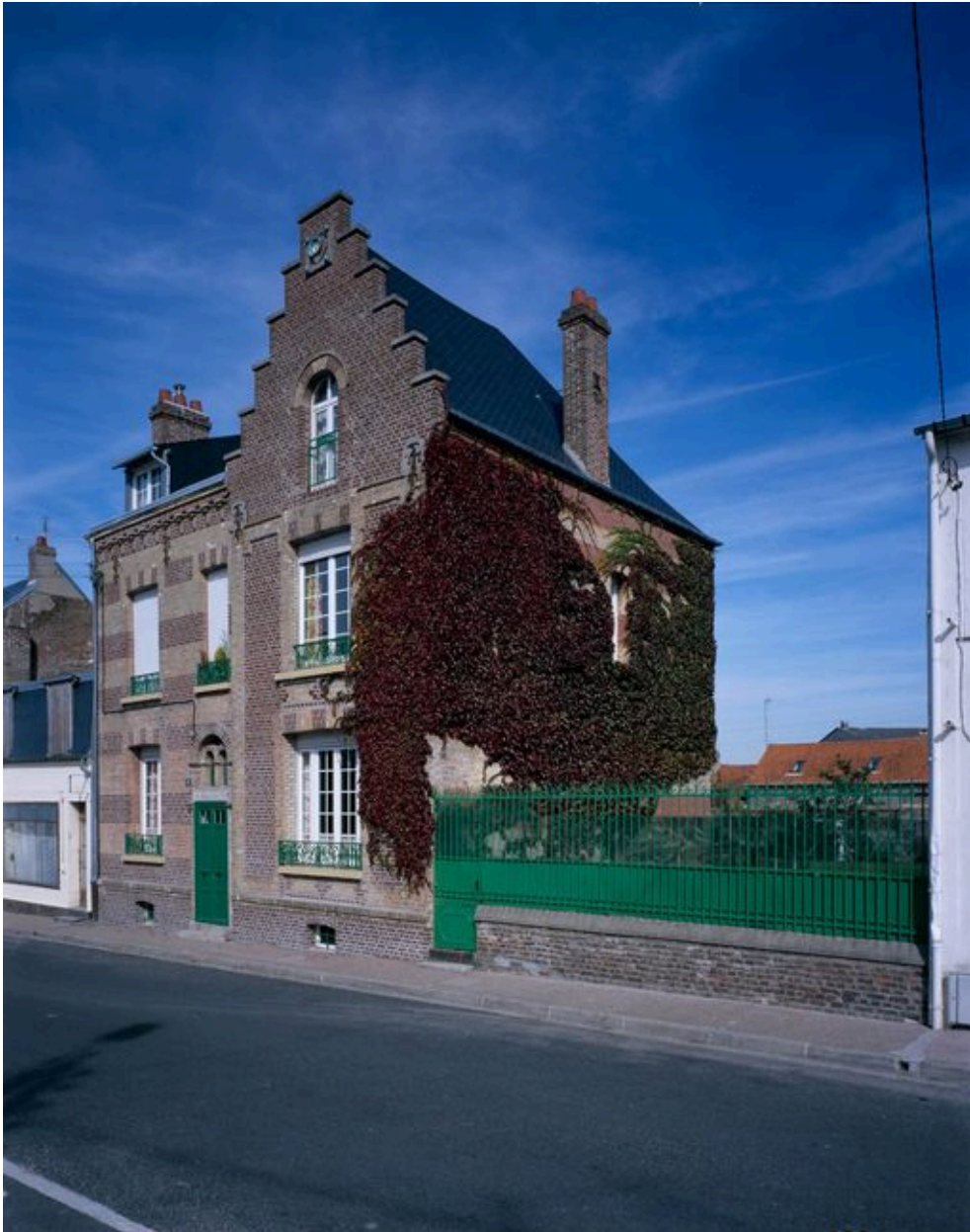
La villa entre mitoyens, villa Marguerite, 6 rue Carnot (1985 AT 77).