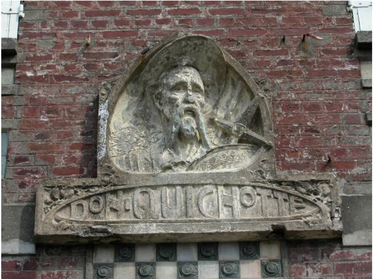
Détail sculpté, maison dite Don Quichotte, 70 rue du Capitaine Guy-Dath (1985 AW 170).