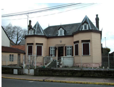
Gros-oeuvre recouvert d'un essentage de planches, villa des Roses, 16 rue Jules Verne (1985 AR 254).