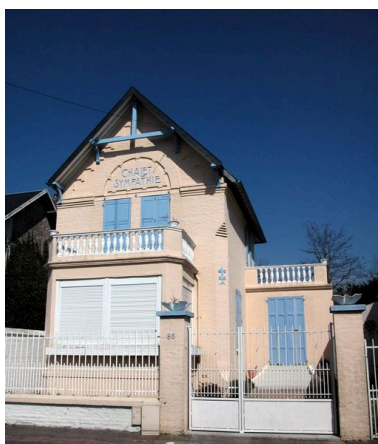
Forme épurée du style Chalet, maison dite Chalet Sympathie, 86 rue Carnot (1985 AW 122). IVR22_20058003782NUCA