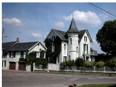
La villa Minuta, dénaturée, 2 rue du Château (1985 AS 84). IVR22_20048001610NUCA