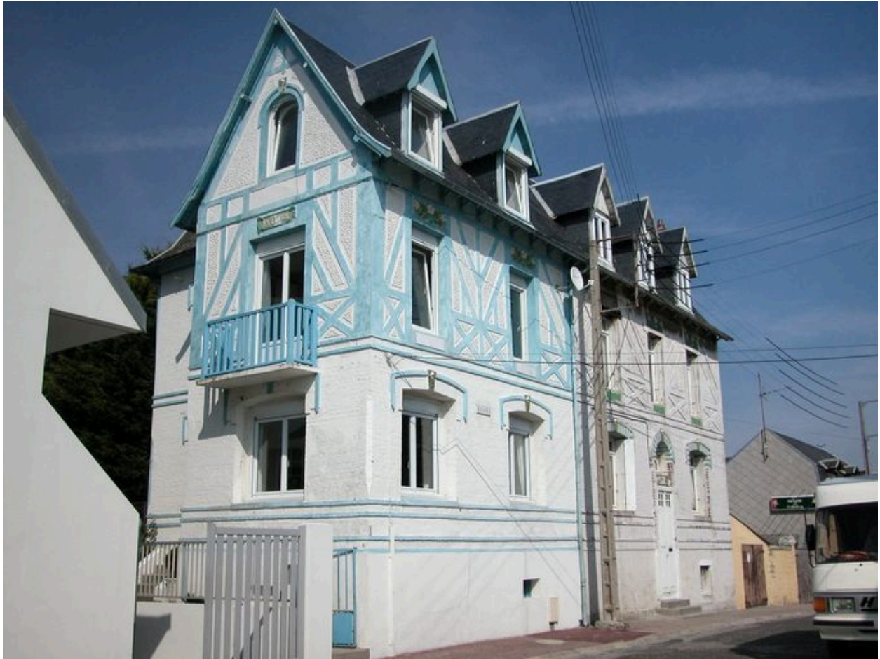
Faux pans de bois en ciment, 2 et 4 allée Beurivage (1985 AW 297, 298).