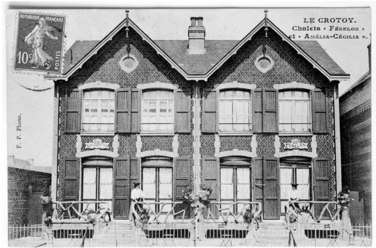
Carte postale, 1er quart 20e siècle (coll. part.).