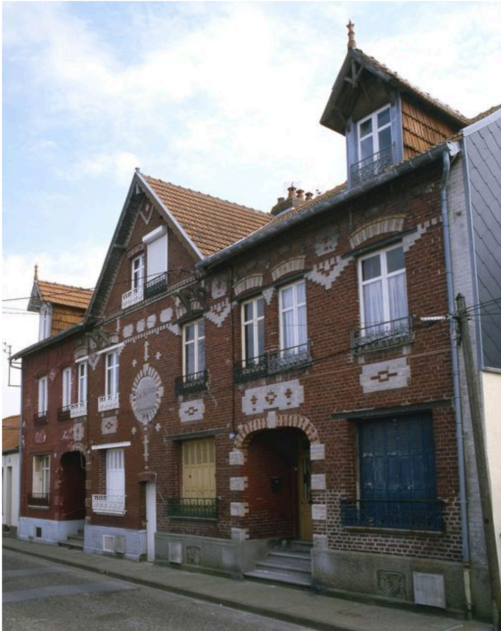
Maison à quatre logements accolés, Gai Séjour, rue Pasteur (1985 AR 39 à 42).