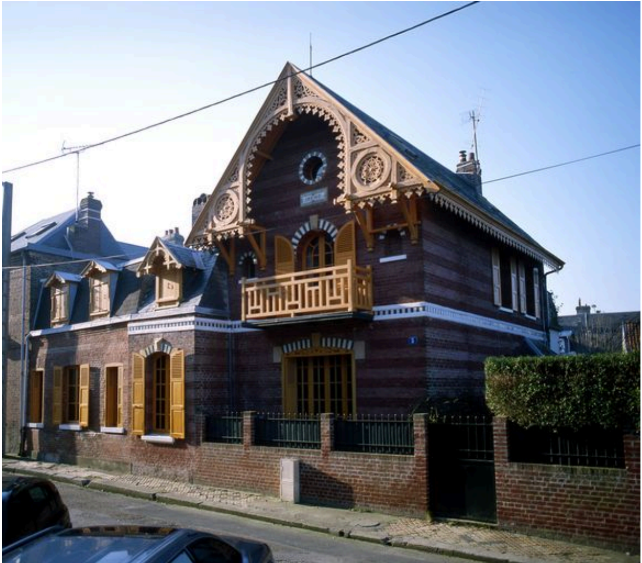
Influence du chalet colonial, maison dite Irène, rue Eudel (1985 AS 20).