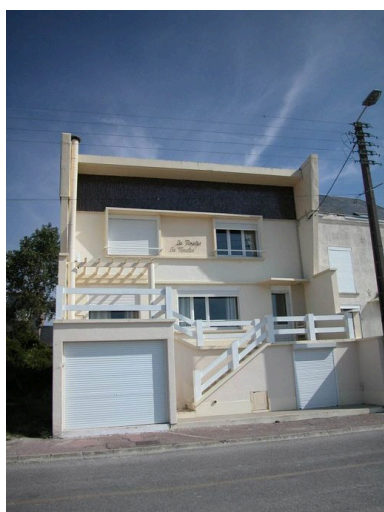
Le style Bungalow, les Mouettes, promenade Jules- Noiret (1985 AW 324).