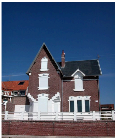
Villa dite Le Rayon vert, promenade Jules Noiret (1985 AV 266). IVR22_20058003755NUCA