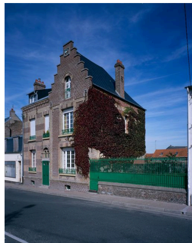
La villa entre mitoyens, villa Marguerite, 6 rue Carnot (1985 AT 77). IVR22_20028000052VA