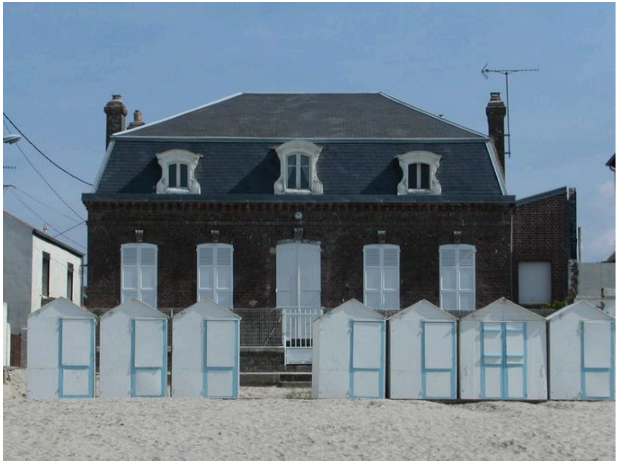
Influence du style classique, 2 rue des Bains (1985 ATT 142).