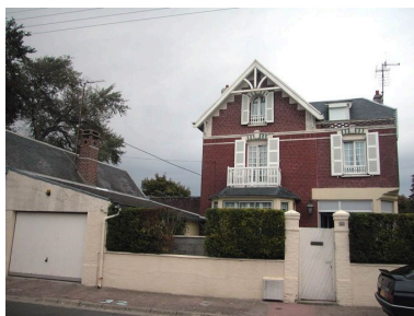
Garage à l'aplomb de la rue, 60 rue du Capitaine (1985 AW 145).