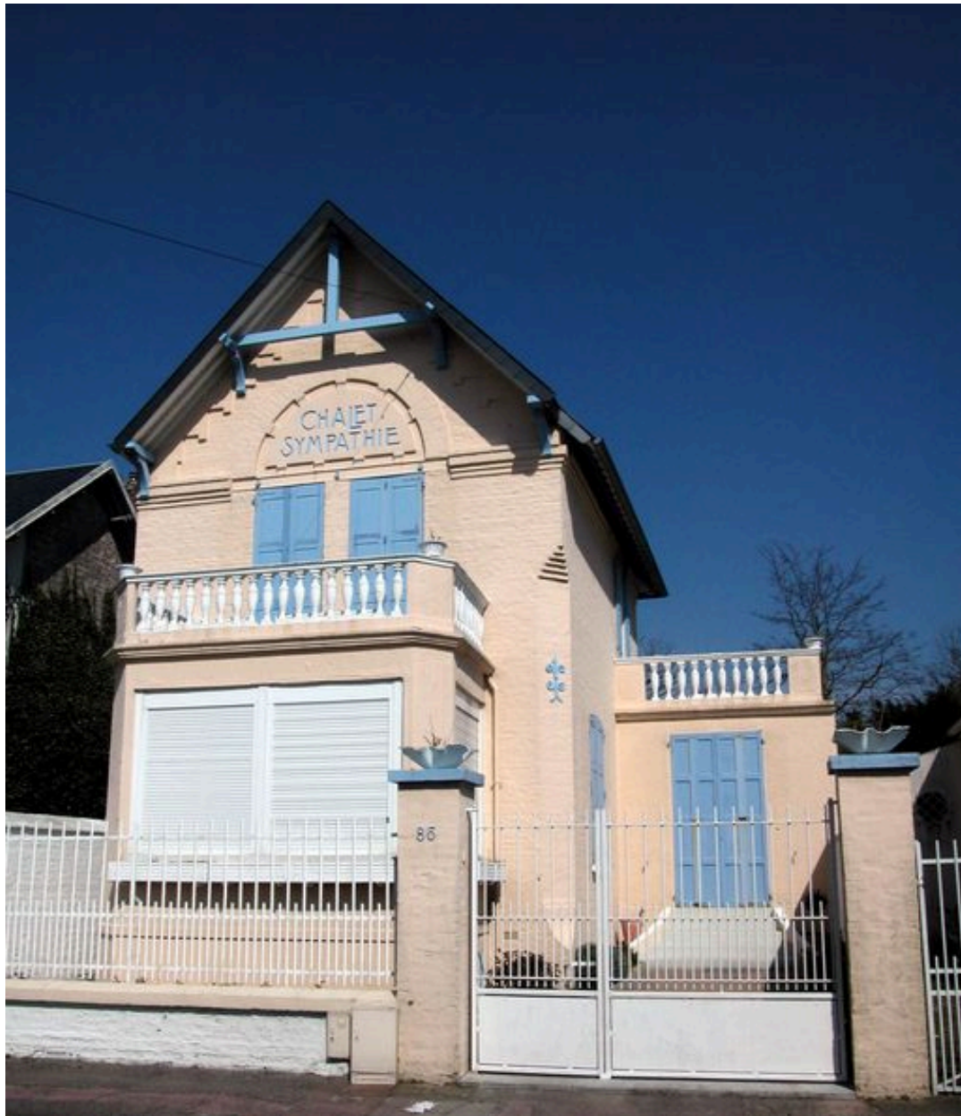
Forme épurée du style Chalet, maison dite Chalet Sympathie, 86 rue Carnot (1985 AW 122).