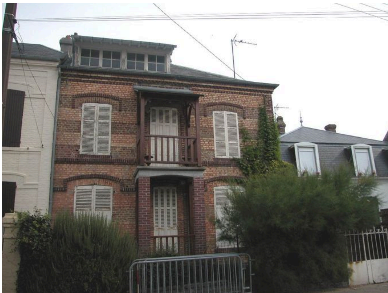
Gros-oeuvre à assises alternées, villa Picarde, 16 rue du Capitaine-Guy-Dath (1985 AV 207).