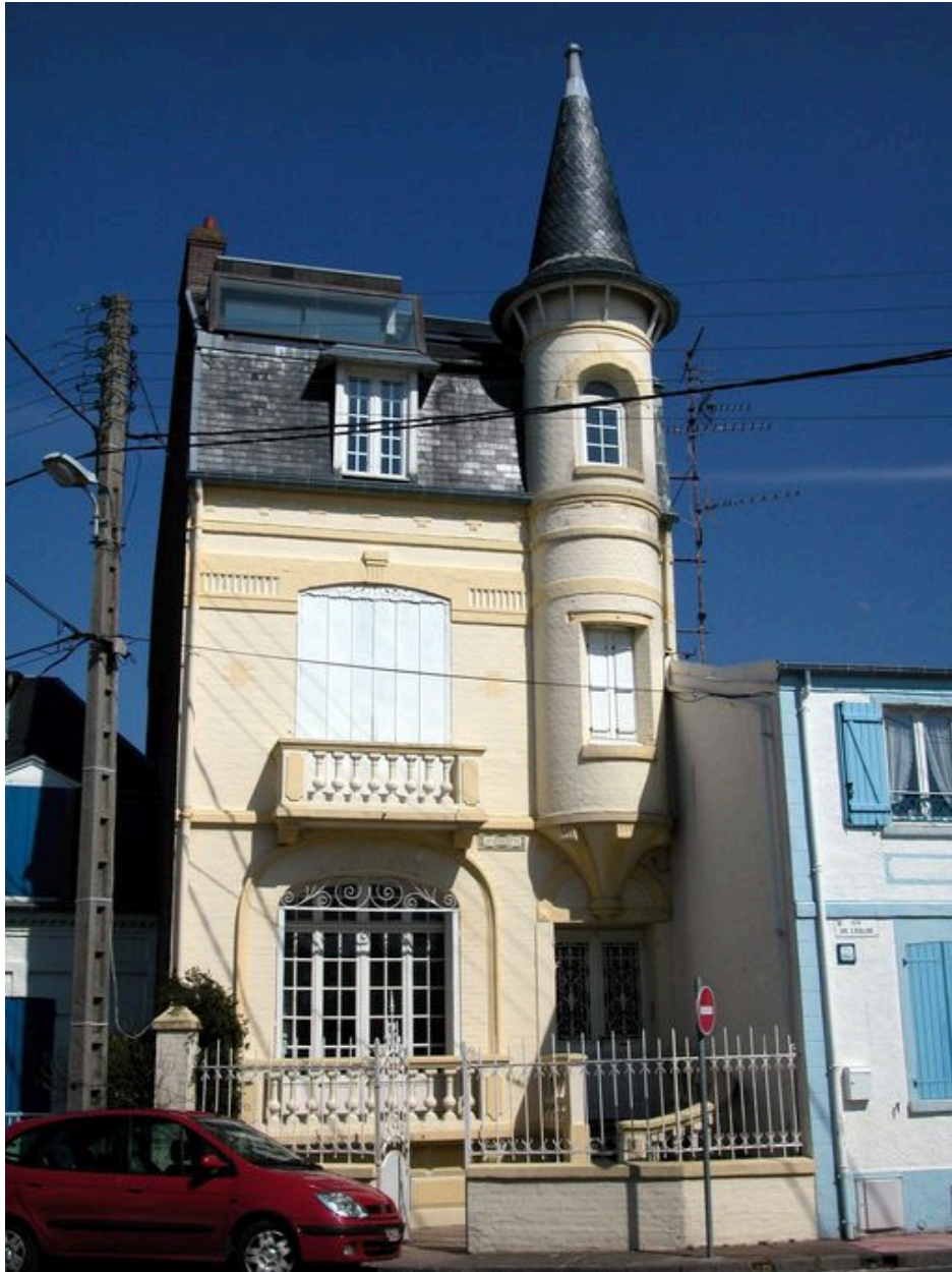
Tourelle sur l'angle en surplomb, maison dite La Coquette, 10 rue du Phare (1985 AT 236).