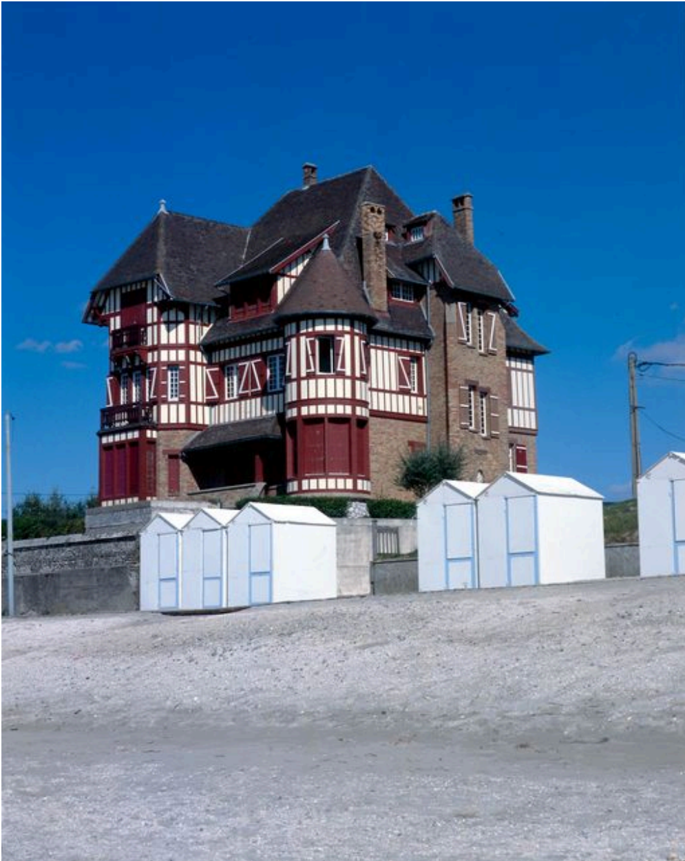
Le type de la villa, Les Ormeaux, rue de la Plage (1985 AT 248).