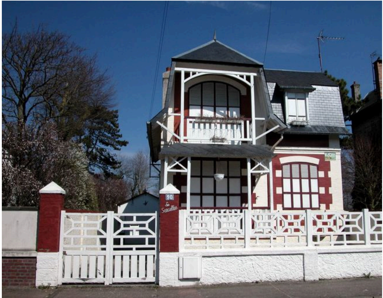
Les Sarcelles, 90 rue Carnot (1985 AW 118).