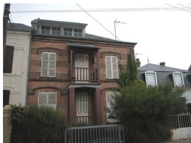
Gros-oeuvre à assises alternées, villa Picarde, 16 rue du Capitaine-Guy-Dath (1985 AV 207). IVR22_20048001628NUCA