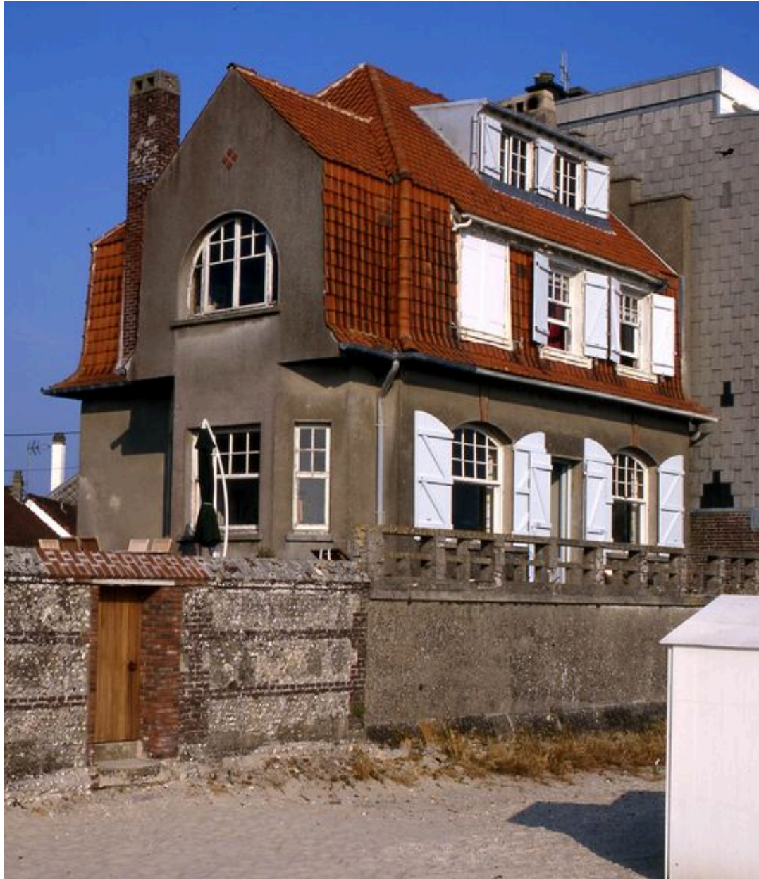
Vent Debout, de style régionaliste flamand, rue des Chalets (1985 AT 130).