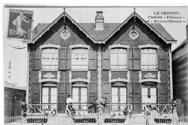
Carte postale, 1 er quart 20 e siècle (coll. part.).

Phot. Monnehay-Vulliet Marie-Laure IVR22_20038000543XB