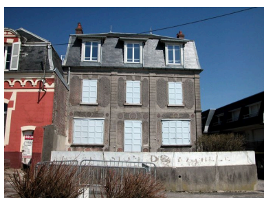
Crépi décoratif, 1 rue de la Mer (1985 AS 116). IVR22_20058003772NUCA