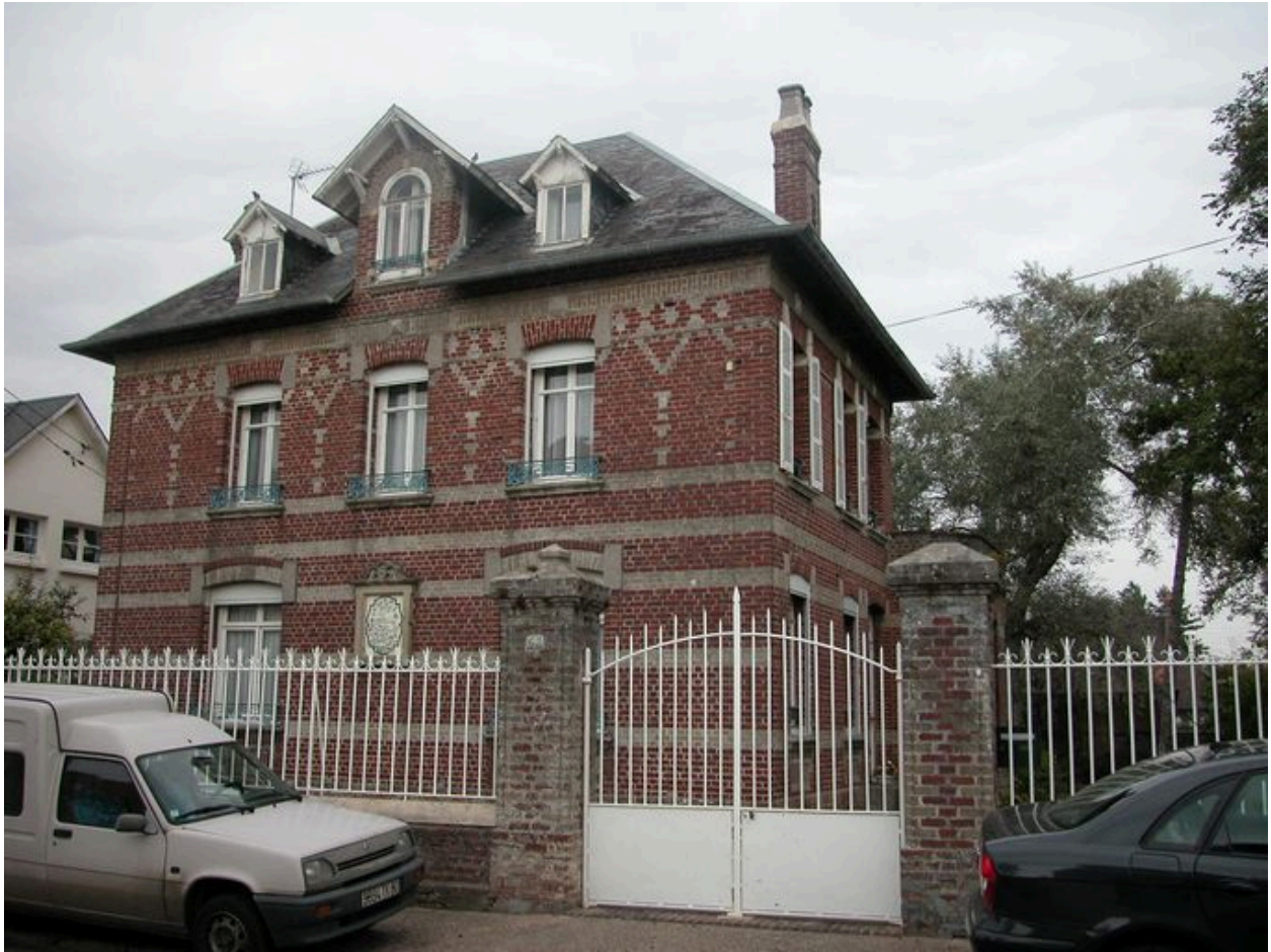
Appareil mixte formant motifs géométriques, 62 rue du Capitaine-Guy-Dath (1985 AW 149).