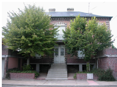
Villa à deux logements accolés, 19 rue Florentin-Lefils (1985 AP 114). IVR22_20058002577NUCA