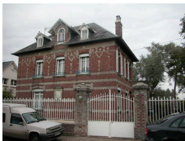
Appareil mixte formant motifs géométriques, 62 rue du Capitaine-Guy-Dath (1985 AW 149). IVR22_20048001624NUCA