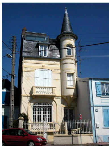
Tourelle sur l'angle en surplomb, maison dite La Coquette, 10 rue du Phare (1985 AT 236).