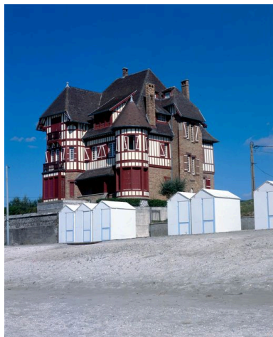
Le type de la villa, Les Ormeaux, rue de la Plage (1985 AT 248). IVR22_20038001017XA