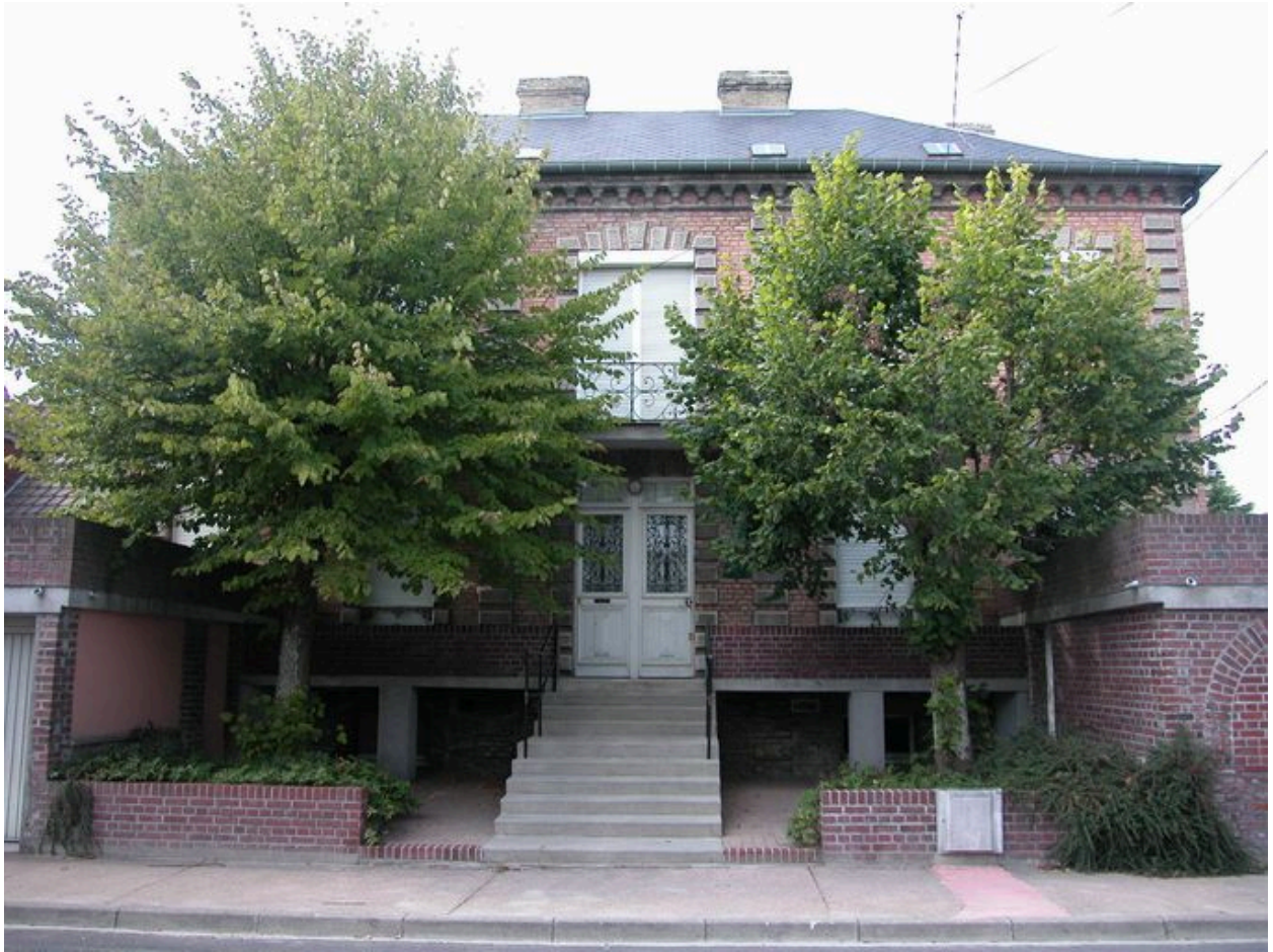
Villa à deux logements accolés, 19 rue Florentin-Lefils (1985 AP 114).