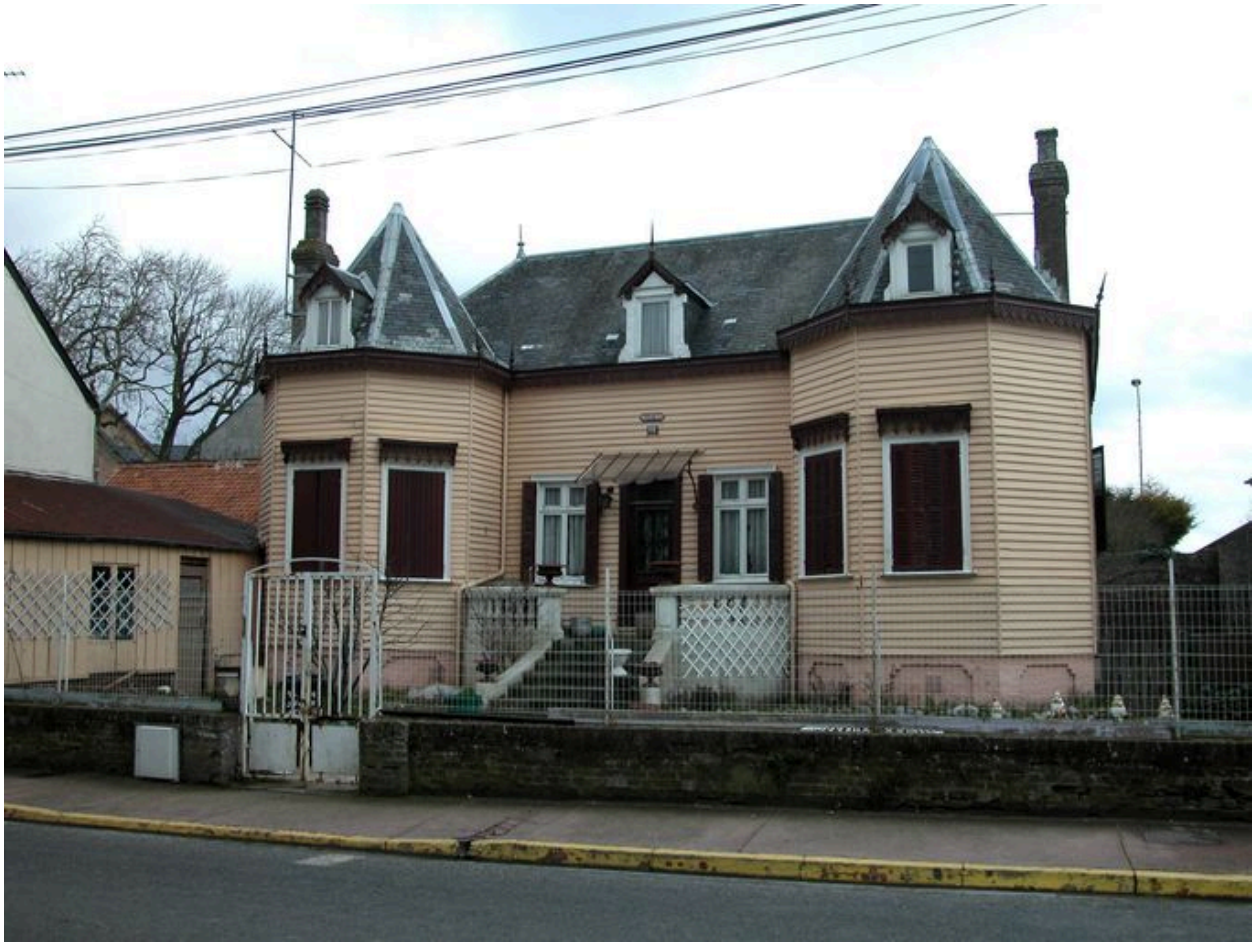
Gros-oeuvre recouvert d'un essentage de planches, villa des Roses, 16 rue Jules Verne (1985 AR 254).