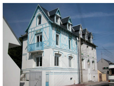
Faux pans de bois en ciment, 2 et 4 allée Beurivage (1985 AW 297, 298). IVR22_20048001622NUCA