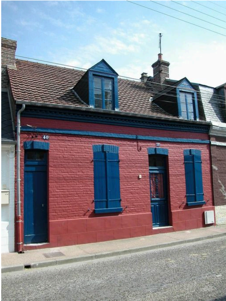
Ancienne maison avec porte latérale donnant accès à la retire en fond de parcelle, 38 et 40 rue de la Prison Jeanne-d'Arc.