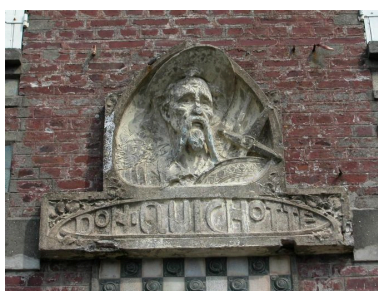
Détail sculpté, maison dite Don Quichotte, 70 rue du Capitaine Guy-Dath (1985 AW 170). IVR22_20048001617NUCA