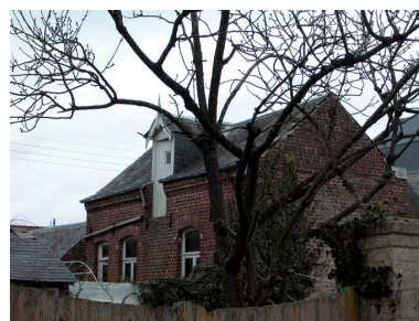
Un 'ravalé' en fond de parcelle. IVR22_20058003729NUCA