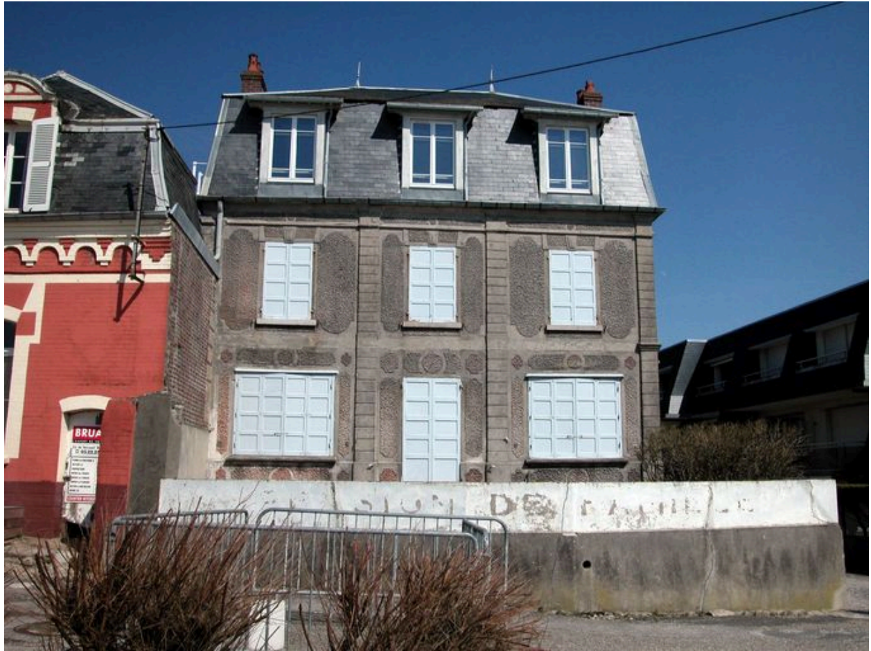
Crépi décoratif, 1 rue de la Mer (1985 AS 116).