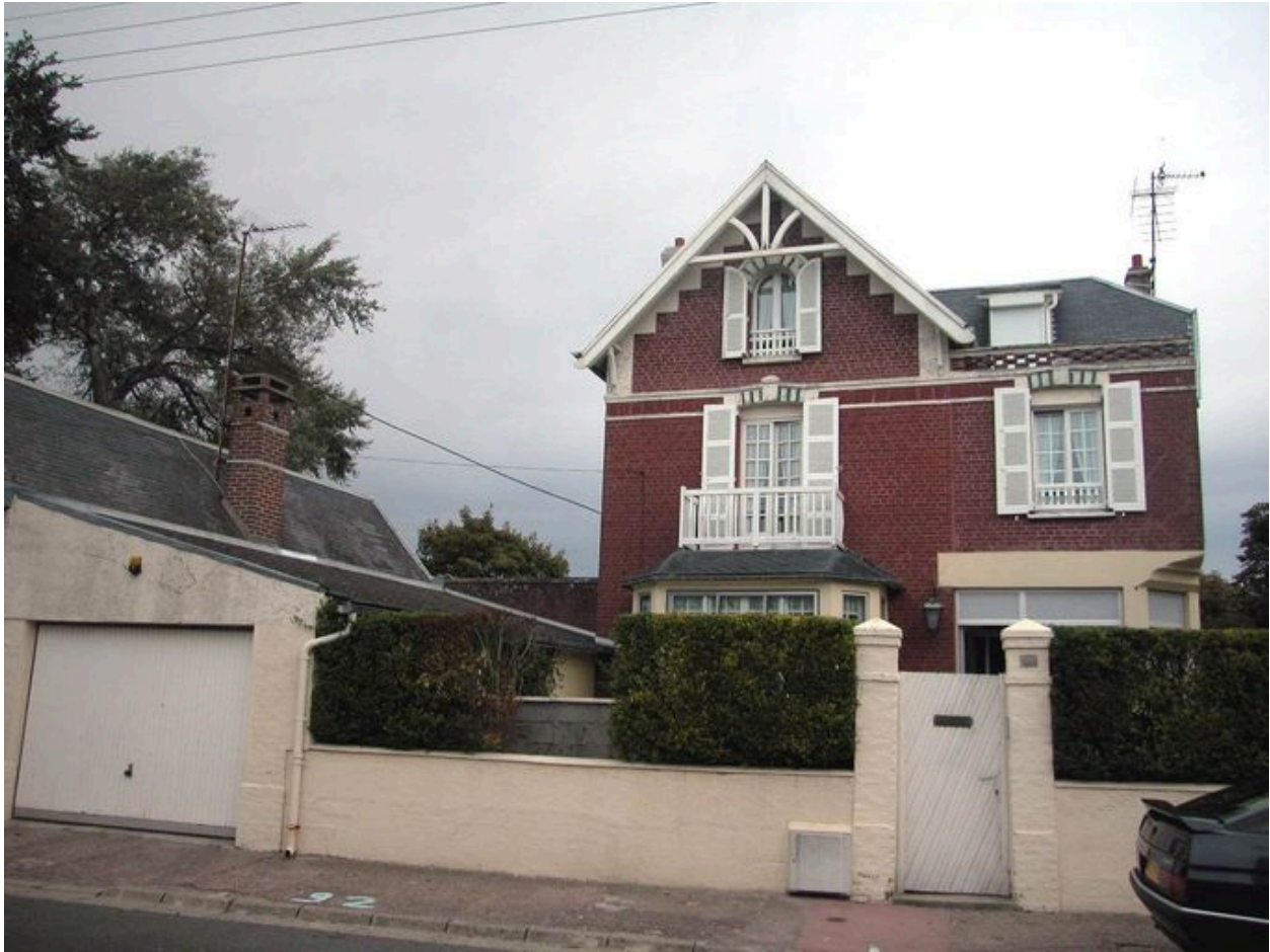
Garage à l'aplomb de la rue, 60 rue du Capitaine (1985 AW 145).