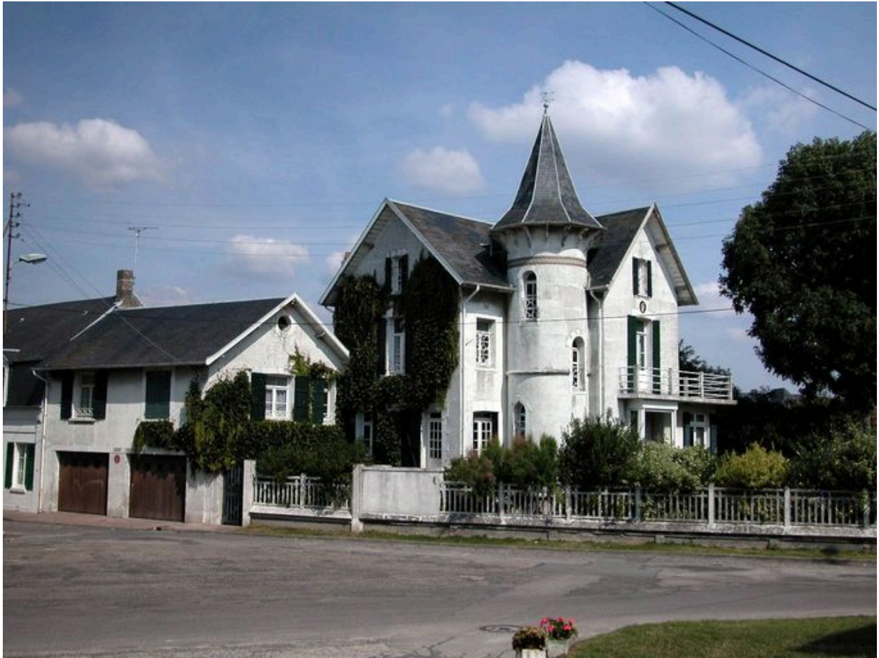
La villa Minuta, dénaturée, 2 rue du Château (1985 AS 84).