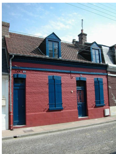
Ancienne maison avec porte latérale donnant accès à la retire en fond de parcelle, 38 et 40 rue de la Prison Jeanne-d'Arc. IVR22_20058003748NUCA