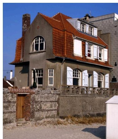
Vent Debout, de style régionaliste flamand, rue des Chalets (1985 AT 130). IVR22_20068000207XA