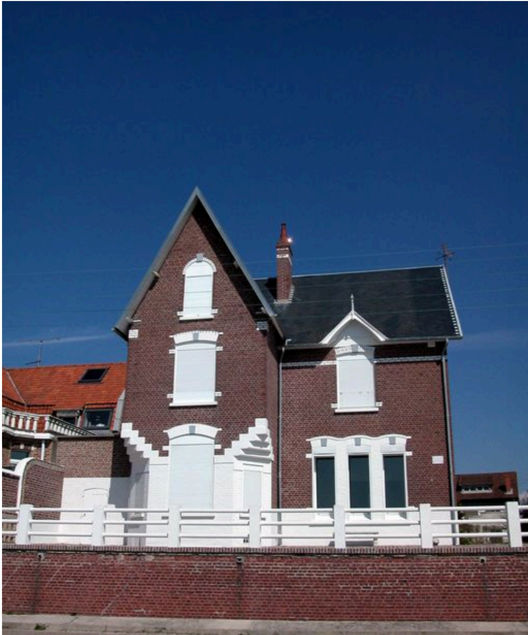
Villa dite Le Rayon vert, promenade Jules Noiret (1985 AV 266).