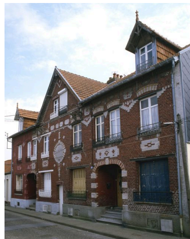
Maison à quatre logements accolés, Gai Séjour, rue Pasteur (1985 AR 39 à 42). IVR22_20068000133XA