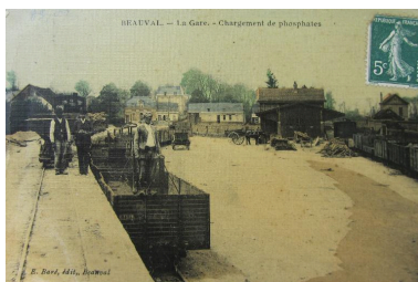
Scène de chargement des phosphates à la gare de Beauval, début 20e siècle (Coll. part.). IVR22_20138015812NUC2A