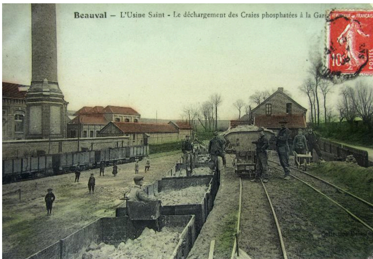
Scène de déchargement des craies phosphatées à la gare de Beauval, début 20e siècle (coll. part.).