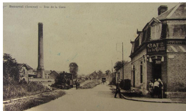
La rue de la gare a début du 20e siècle (coll. part.). IVR22_20138015666NUC2A