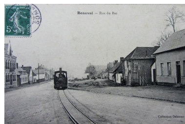
Locomotive sortant de la gare de Beauval pour rejoindre la carrière de phosphates, début 20e siècle (coll. part.).