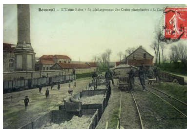
Scène de déchargement des craies phosphatées à la gare de Beauval, début 20e siècle.