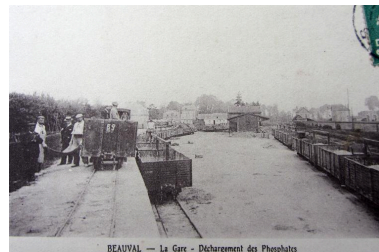
Déchargement des phosphates en gare de Beauval, début 20e siècle IVR22_20138015813NUC2A