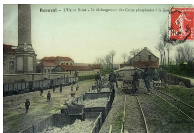
Scène de déchargement des craies phosphatées à la gare de Beauval, début 20e siècle (coll. part.). IVR22_20138015811NUC2A