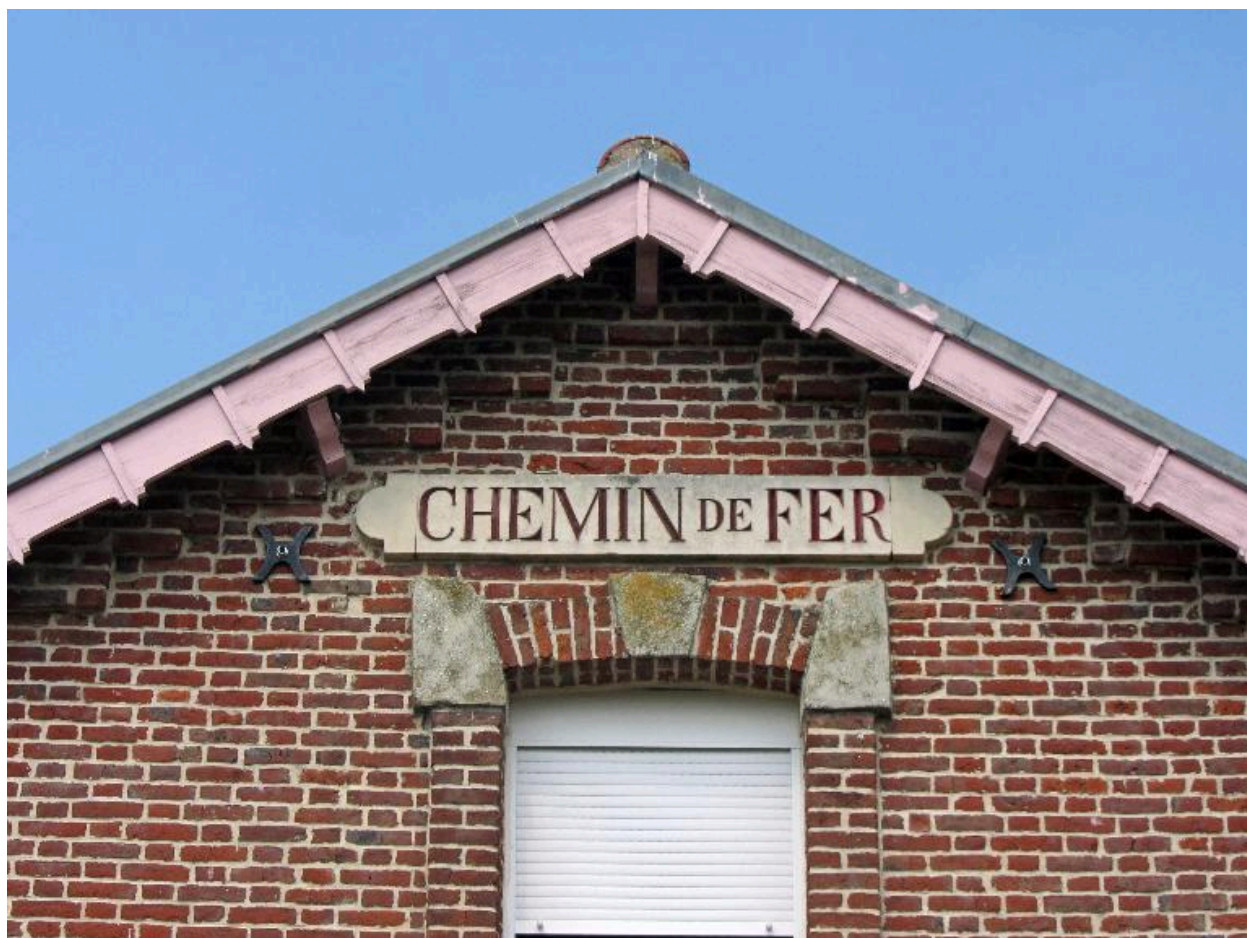
Détail de l'inscription "chemin de fer".