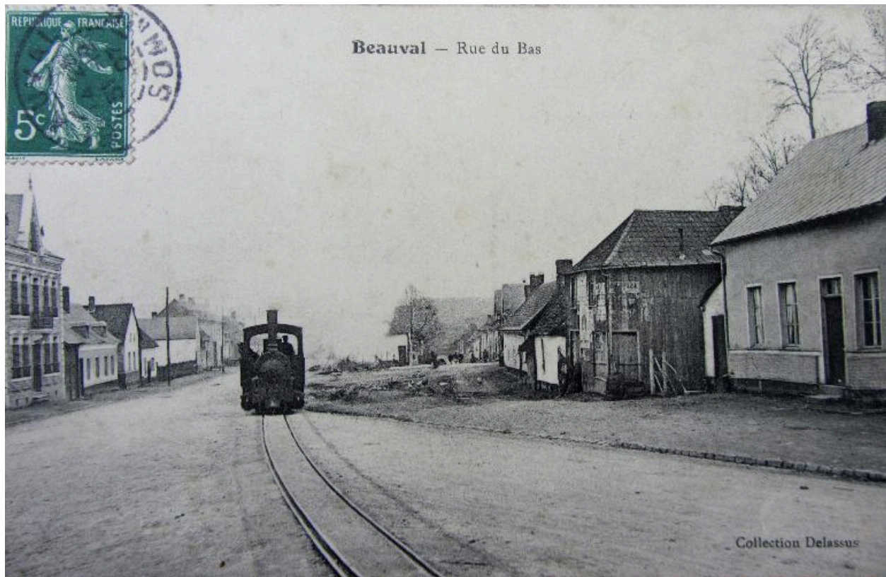
Locomotive sortant de la gare de Beauval pour rejoindre la carrière de phosphates, début 20e siècle.