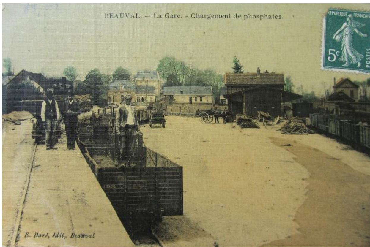
Scène de chargement des phosphates à la gare de Beauval, début 20e siècle.