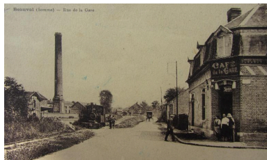
La rue de la gare a début du 20e siècle (coll. part.).