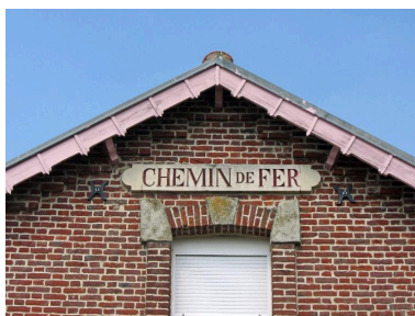
Détail de l'inscription "chemin de fer".