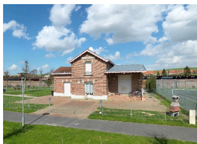
Vue d'ensemble. IVR22_20138000074NUC2A