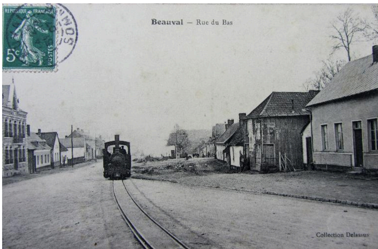
Locomotive sortant de la gare de Beauval pour rejoindre la carrière de phosphates, début 20e siècle.