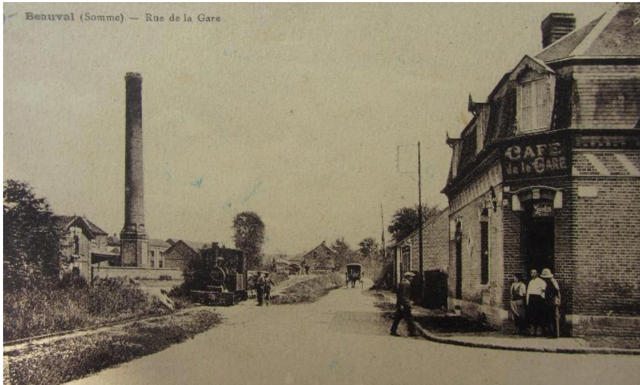
La rue de la gare a début du 20e siècle.