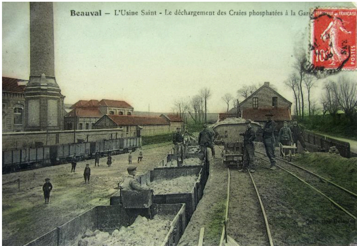
Scène de déchargement des craies phosphatées à la gare de Beauval, début 20e siècle.