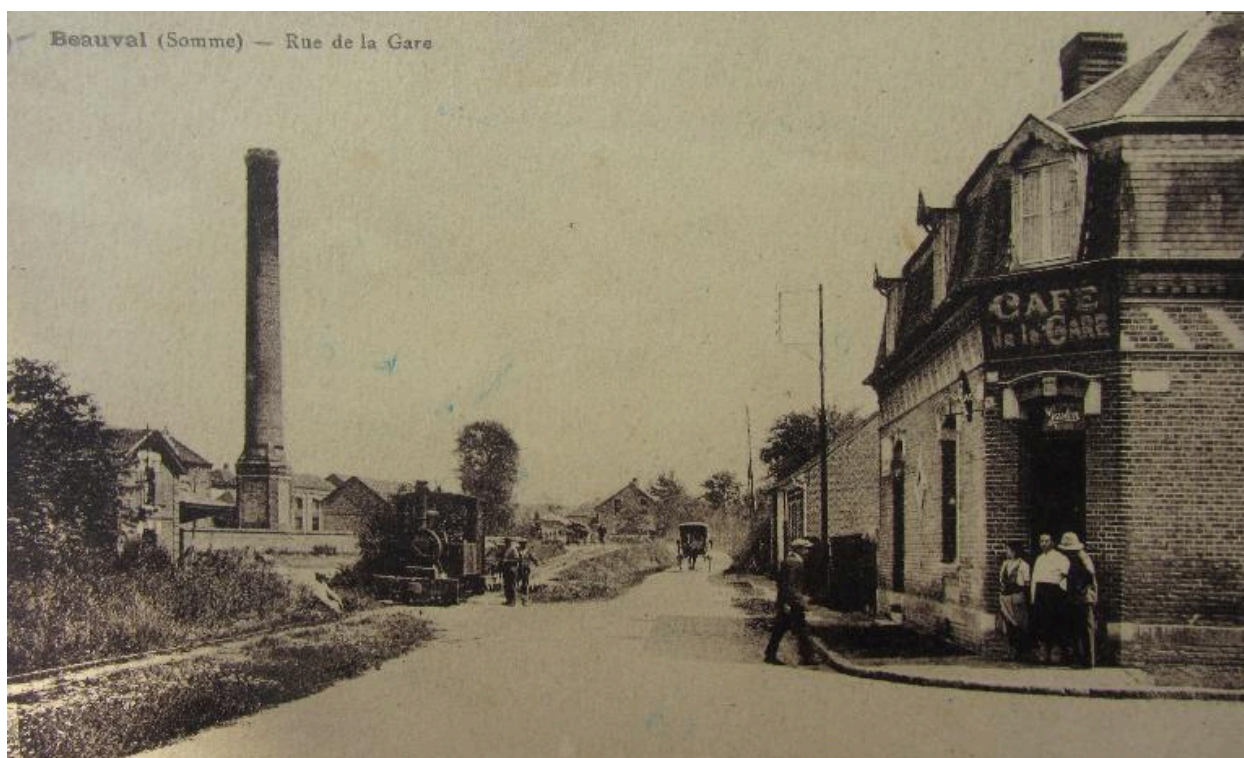
La rue de la gare a début du 20e siècle.