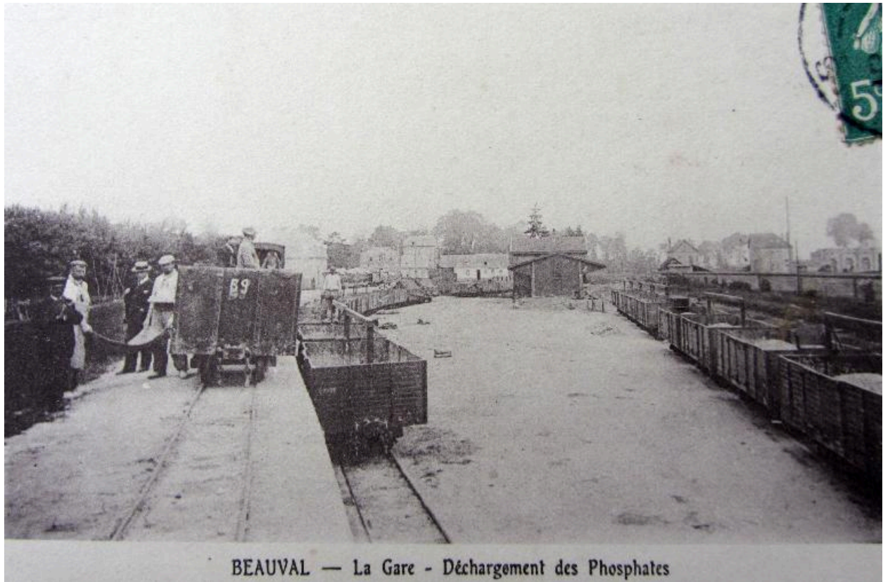
BEAUVAL — La Gare - Déchargement des Phosphates

Déchargement des phosphates en gare de Beauval, début 20e siècle (coll. part).