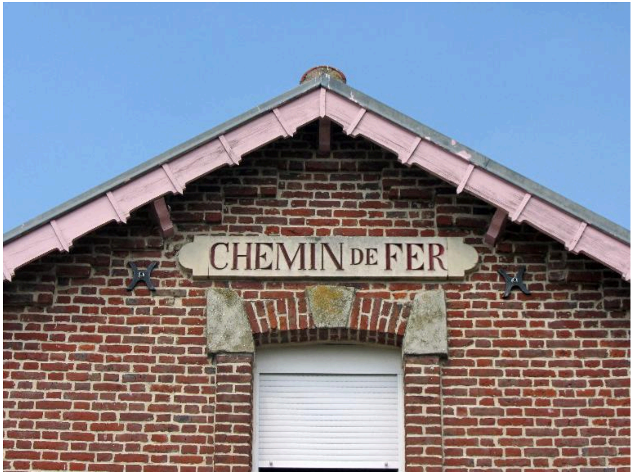
Détail de l'inscription "chemin de fer".