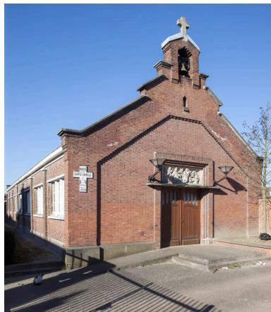
Élévation antérieure de l'église. IVR31_20155900898NUCA