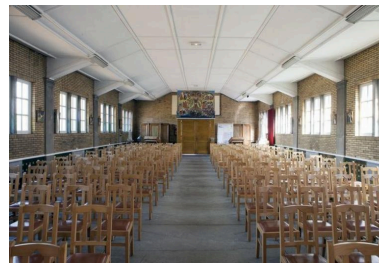
Vue générale depuis le chœur. IVR31_20155900900NUCA