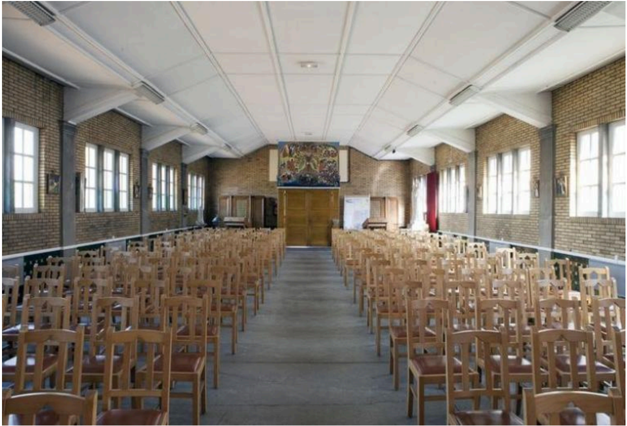
Vue générale depuis le chœur.