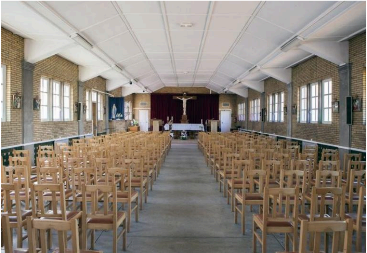
Vue générale vers le chœur.