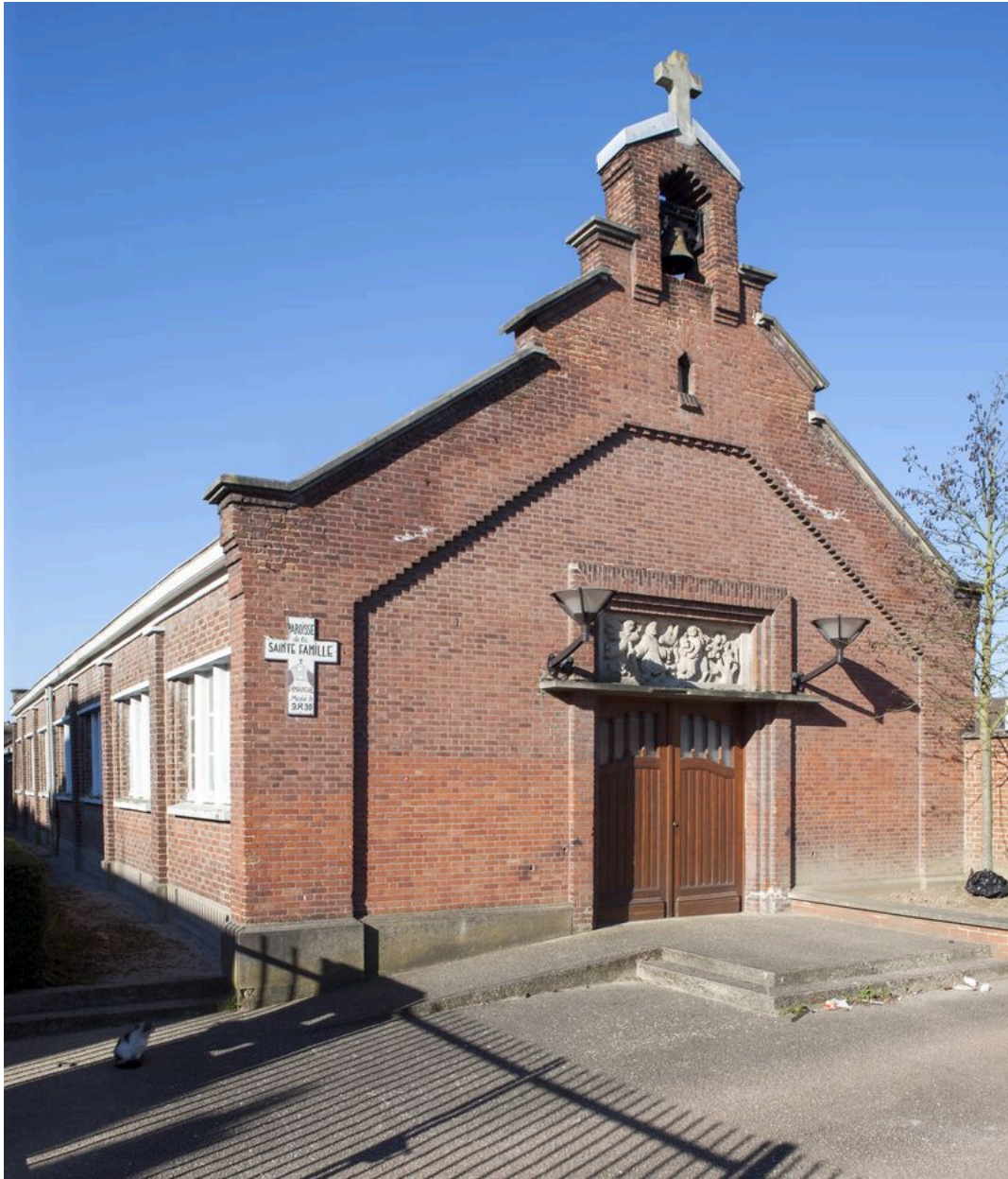
Élévation antérieure de l'église.